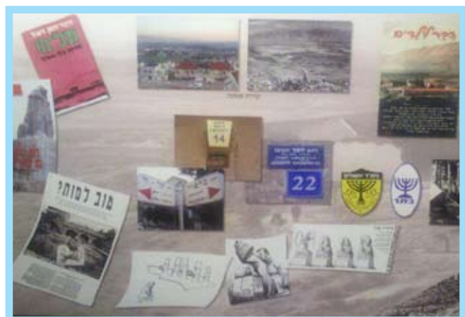
קטע מתוך התצוגה, חדר המיתוסים בחצר תל-חי.

אתרי המורשת מייצגים עולמות תוכן שונים המשתנים ומתחברים. ביקור במוזאון, אתר מורשת, או אנדרטה, הוא קריאת טקסט וכמו ביקור בגן האוטופי צריך ידע קודם כדי לדעת לקרוא אותו. מבקרים בגן האוטופי שלא ידעו כי הדבורים מסמלות חברות, שהשדרה קוראת למחשבה, שלכנסיה יכולת למקד תפילה ושבספרייה יש אפשרות לפתוח טקסטים נוספים, יהלכו בגן כאנאלפביתים. יש להניח שמתוך דאגה הם ירססו את הדבורים, יחריבו את החומות המצוירות וירמזרו את השדרה בגן. קחו למשל מקום מקודש במסורת הציונית כמו חצר תל-חי. כל שנה נפגשים בה חברי בית"ר עם חברי הנוער העובד ואלו גם אלו שואלים את עצמם מה עושים פה חניכי התנועה השנייה?