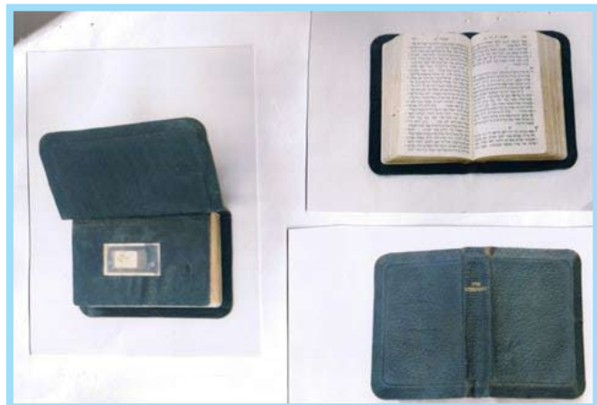
ספר תנ"ך של משפחת פיינברג.

גם אם נסגור את הדלת בפני ההיסטוריה היא תפרוץ אלינו דרך החלון.