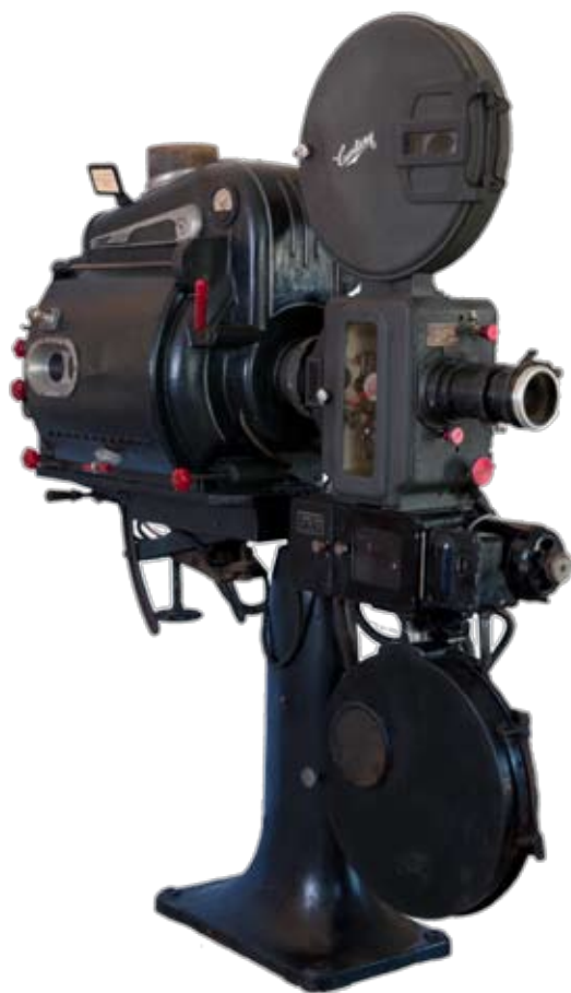
מקרנת קולנוע, מוזאון העיר חיפה.

המפגש, המדומיין בהחלט, של חשיבת בנימין עם המציאות במדינת ישראל של שנות האלפיים, של מאמצים המתחוללים בה לטפל באחריות בזיכרון הרצוני והלא רצוני של המקום, איננו עניין שיכול להיות שלם. בנימין עצמו, שנקרא על ידי חברו גרשום שלום ונשיא האוניברסיטה העברית יהודה מאגנס לעלות ארצה ולפרש אותה בעבודתו המדעית, לא עשה זאת. הוא לא יכול היה ללמוד עברית ולהכריע גם מפני ששמע קולות נוספים שתבעו ממנו ללכת בדרכים אחרות וגם בגלל העובדה שנאחז בעבודה הגותית אחרת. בכל זאת, ראיתי בחשיבתו המדגישה את השוטטות על פני התיירות או הצליינות, מקור עמוק ומקורי לחשבון נפש של העולם הציוני ישראלי בתוכו צמחתי ובו אני פועל. כתבו עליו כי הוא חווה על עצמו את המעבר בין משוטט לפליט. אני דמיינתי כי הוא יכול היה לעשות מעבר נוסף: מפליט לעולה, אך בתקווה שלא יאבד את חוכמת המשוטטות ואת ראייתו המחודדת והמקלפת של הפליט. עליותו הדמויונית לארץ, פריצתו אל יחד וקהילה, אל נוף חקלאי, אל השפה העברית, אל הגנה ומדינה, נראית מוזרה. ובכל זאת, אני מאמין, כי לנו היא מעניקה פרספקטיבה מעמיקה, ביקורת ומשאת נפש. לו אני חב לא מעט מהכתוב כאן למרות שהאחריות על הפירוש היא שלי בלבד.