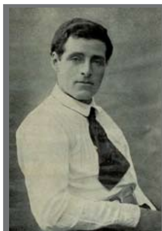
יוסף טרומפלדור.

הסיפור של טרומפלדור אורגן כסיפור של הגנה ונשען על מסורת ההגנה העצמית היהודית בקהילות שבימים ההם לא הצליחה למנוע את הרצח הגדול. באותה עת הועלתה לראשונה השאלה שהתגלגלה מאוחר יותר לימי מלחמת העולם השנייה 'האם נלך כצאן לטבח?' מעניינת ביותר השתיקה הקיימת בארץ לגבי האירועים הללו. למרות שבספרות העברית נכתב לא מעט על הימים הנוראים ההם בפולין ובאוקראינה, רק קיבוץ גבת, שנקרא על שם קדושי פינסק שנרצחו באותם ימים קשים, הקים יד לאסון. זיכרון מאורעות תל-חי התמודד עם הטרואמה, כיסה עליה והשכיחה. טרומפלדור עצמו לא ניצח בקרבות בהם השתתף לא במלחמת רוסיה-יפן, לא בקרב גאליפולי ולא בתל-חי. אי אפשר היה להקים לכבודו שער ניצחון. דווקא משום כך הוא התאים להיות גיבור: איש הנאבק על דרכו וסולל דרך חברתית, איש המוכן להגן על יצירתו ועל אנשיו בכוח אך גם איש שאינו מאמין באתוס של כוח ובפולחן של מוות וקרבת. סיפורו נוצק כ'אגדה' על אדם המייצג אפשרות היסטורית חדשה.