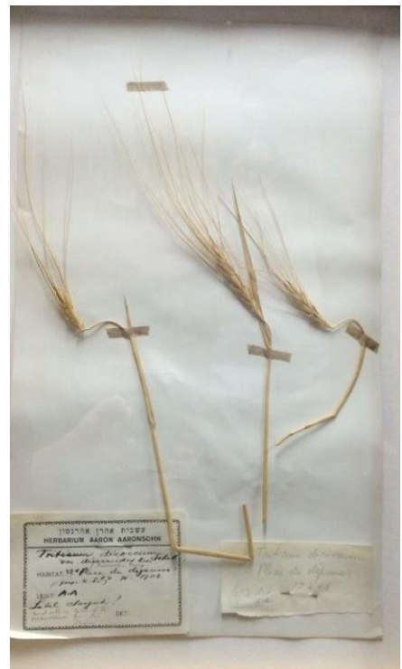
שיבולת הבר, "אם החיטה" שמצא אהרן בעבר הירדן המזרחי ב-17 באפריל 1908. אוסף בית אהרנסון, מוזיאון ניל"י