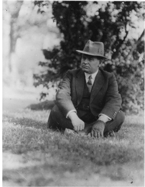
אהרן באחת מנסיעותיו לחו"ל.