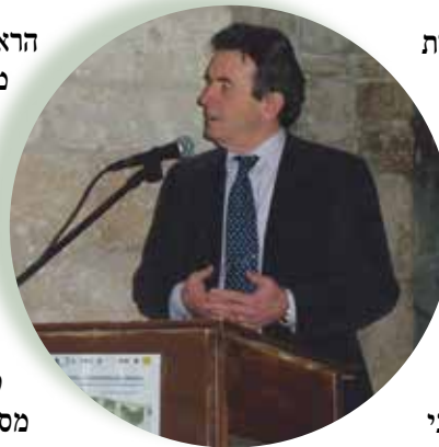
פרופ' קלאודיו מודנה נושא דברים בכנס

סדנת המהנדסים הייתה השנייה בנושא שימור שמתקיימת בישראל ואחת ממטרותיה הנוספות היא להעלות את המודעות לפן ההנדסי בתחום, שמשווע למהנדסי שימור נוספים ■