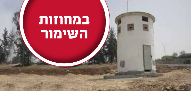
הפילבוקס במשכנו החדש

הפילבוקסים: מכנה הפילבוקס ברחוב דרך חברון הועתק למרחק קצר עקב הרחבת הכביש. המועצה לשימור אתרים תשלט את שלושת מבני הפילבוקסים שנותרו בירושלים