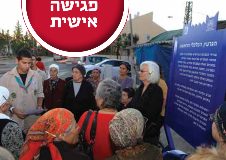
ראש העין – אירוע חנוכת השלט ליד הגרעין הכלכלי הראשון

פרנסתם כל אותם שהיו כאן לפנינו. אלו נושאים המעסיקים אותי גם בסיורי מסביב לעולם. בצד השליחות המקצועית שלשמה אני יוצא, אני משתדל לבקר באתרים ובמתחמים היסטוריים, ללמוד את תולדות המקום, לראות וללמוד כיצד משמרים ולהביא אתי בשושי את רשמי. שכן, בארץ שלנו שכיות חמדה לאינספור שעלינו ללמוד לשמון למעננו ולמען הדורות הבאים, הן בשל חשיבותן ההיסטורית והן בשל ערכן התרבותי והאסתטי. עלינו לכבד את העבר ולזכור ש"אין בית אשר נבנה מהתקרה". כל דור הוא חוליה בשלשלת ארוכה, נדבך על גבי נדבך וחובתנו לשמר את כל הנדבכים הללו.