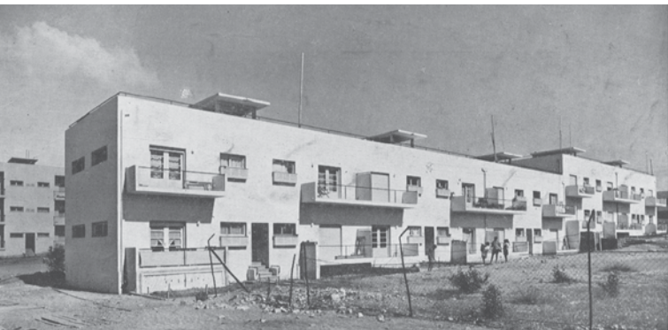
מתחם לכיא (מגזין "הבנין" מס' 1 - אוגוסט 1937)

'מעונות הפועלים' של מתחם לכיא נבנו בשולי שכונת הגנים רמת יצחק, עבור חברי תנועת 'פועלי ציון שמאל'. המעונות כוללים שלושה מבני דירות מלבניים מקבילים, המתנשאים לגובה שתיים עד שלוש קומות ונחצים על ידי חדרי מדרגות וכן מבנה נפרד ל'צרכניה קואופרטיבית'. כמקובל במתחמי מעונות העובדים, גם כאן ניתנה התייחסות מיוחדת לנושא הנוי ותוכנו שטחים ציבוריים לרווחת הדיירים.