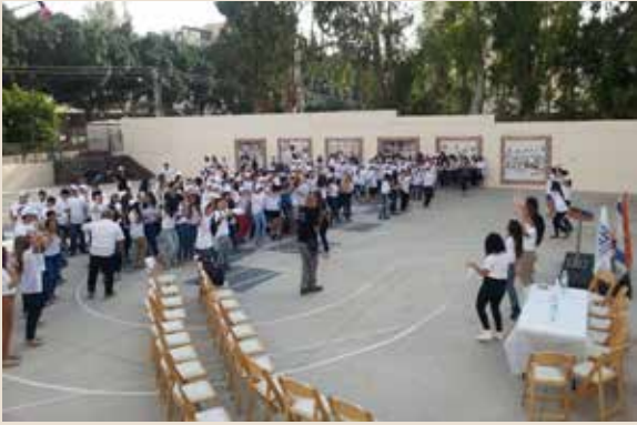
"אמץ אתר" ברחובות - פתיחת האירוע ברחבת בית דונדיקוב

בשבוע שימור אתרים התקיימו שפע אירועים, סיורים, ימי עיון וכנסים, אשר משכו אליהם מאות אנשים. לפניכם רשמים מן האירועים.