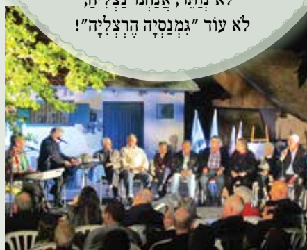
"סיפורי יוסי" ...