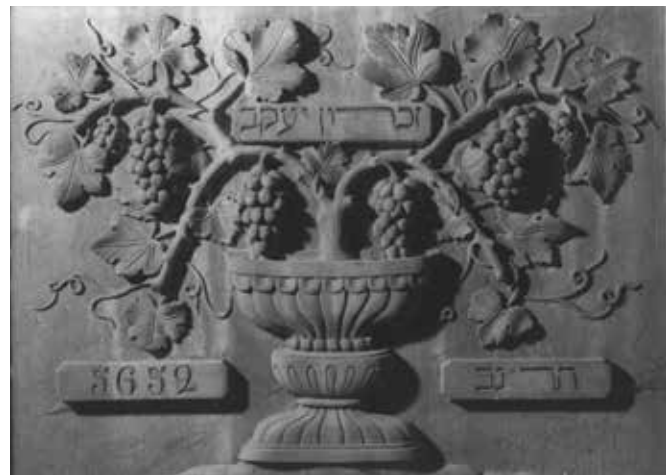
סמליל היקב

בקיץ תרס"ג (1903) נאספה בזכרון יעקב "הכנסייה הראשונה" - התכנסות ארצית ראשונה של כל נציגי היישוב היהודי הקטן, שמקצתם נבחרו בבחירות ואחרים מונו ביישובים השונים. בסך הכל מדובר היה ב-67 צירים. מירושלים באו 18 צירים, מיפו - שבעה, מזכרון יעקב - שישה, מפתח תקוה, מצפת ומראש פינה - ארבעה צירים מכל אחת, מראשון לציון ומטבריה - שלושה צירים מכל אחת, וממושבות קטנות יותר בעת ההיא הגיעו ציר או שניים. גם העיר חיפה היהודית, אז בראשית התפתחותה, יוצגה על ידי ציר אחד בלבד.