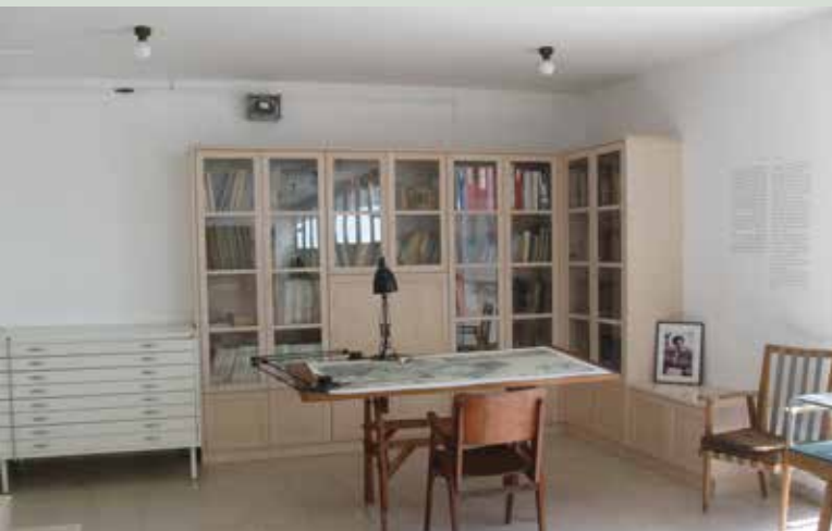
חדר העבודה המשוחזר של ביקלס במשכן לאמנות עין חרוד