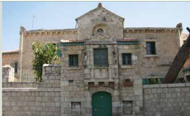
בית תבור לפני ההרס