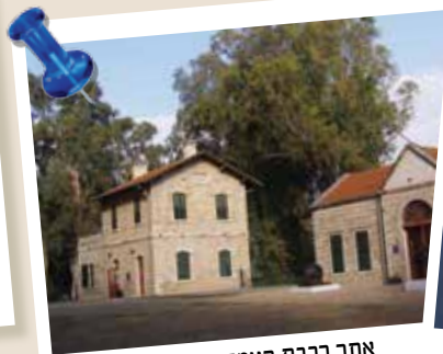
אתר רכבת העמק כפר יהושע