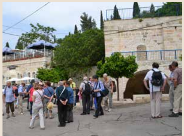
עין כרם לאן? סיור בעקבות יום העיון