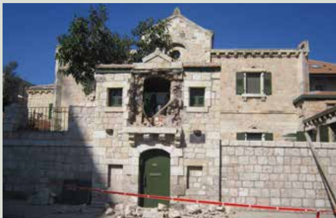
ההרס בחודש מרס 2013