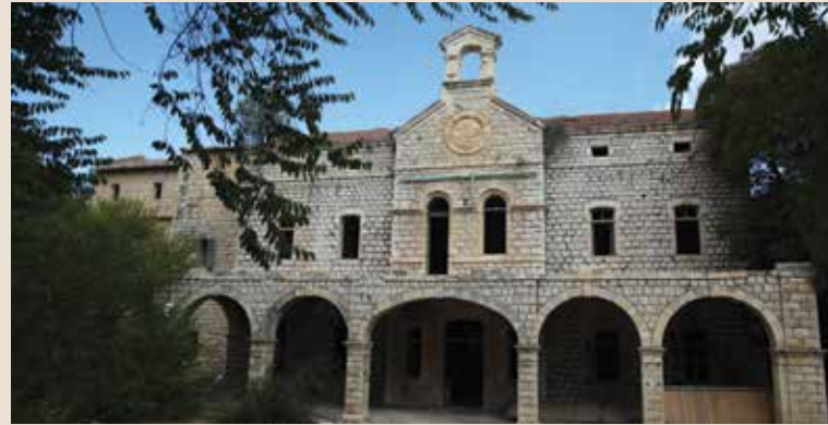
הבניין הראשי

בית בוסל שוכן ברחוב ירושלים, פינת רחוב האר"י, וסיפורו מתחיל בשנת 1895, עת רכש המיסיון האנגלי כשמונה דונם בשוליה הצפוניים של צפת. בשנת 1904 נחנך כבית חולים ושימש את אוכלוסייתה של צפת והסביבה. הכתים נבנו מאבני גיר מסותתות, כמנהג המקום ועם