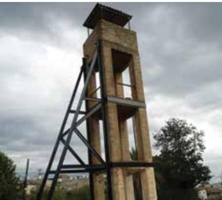
מגדל השמירה בראש העין

בישראל והמועצה האזורית רמת נגב החליטו לשקם את הגשר על מנת שימשיך לשמש למעבר כלי רכב באזור תיירותי יפהפה. שיקום הגשר מתבצע במסגרת פרויקט 'הצלת מבנים', בשיתוף ובמימון "ציוני דרך" במשרד ראש הממשלה