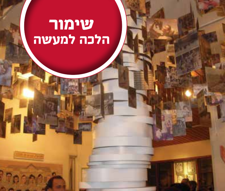
עץ משפחת הקיבוץ במוזאון החצר הישנה בעין שמר