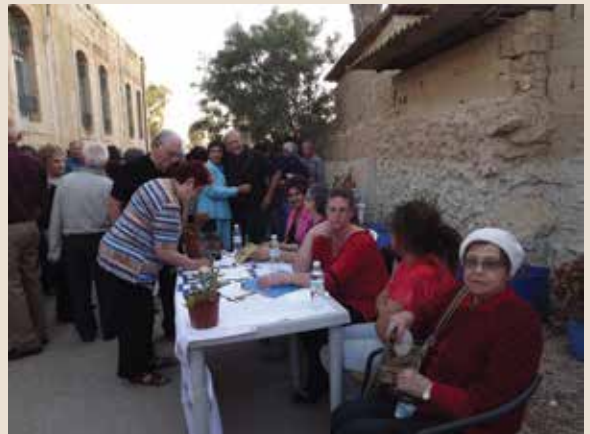
פתיחת שבוע שימור אתרים בבית האמנים בבאר שבע