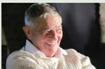
רגע של נחת...