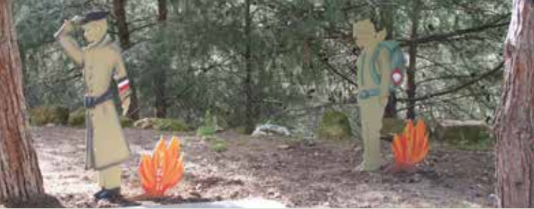
מדורות הפלמ"ח

חומה ומגדל בגן השלושה נציב את המכוניות שהובילו את הציוד להקמת יישובי חומה ומגדל, לאחר שיתיימו עבודות השיפוץ; בגדרה התחלנו כשיקום באר המים; כמגדל המים ככפר יהושע נשמר את מערכת השאיבה והזרמת המים לקטרים; מוזאון התעופה האזרחית נפתח באתר הצניחה החופשית שלייד מושב הבונים ואנו פועלים למען שיתוף פעולה בעתיד ■