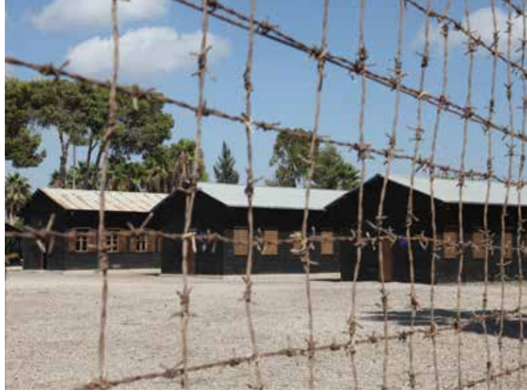
אתר מחנה המעפילים עתלית לאחר השיקום