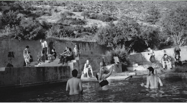
בוסתן כיאט בוואדי שיה

חומה ומגדל בגן השלושה נציב את המכוניות שהובילו את הציוד להקמת יישובי חומה ומגדל, לאחר שיתיימו עבודות השיפוץ; בגדרה התחלנו כשיקום באר המים; כמגדל המים ככפר יהושע נשמר את מערכת השאיבה והזרמת המים לקטרים; מוזאון התעופה האזרחית נפתח באתר הצניחה החופשית שלייד מושב הבונים ואנו פועלים למען שיתוף פעולה בעתיד ■