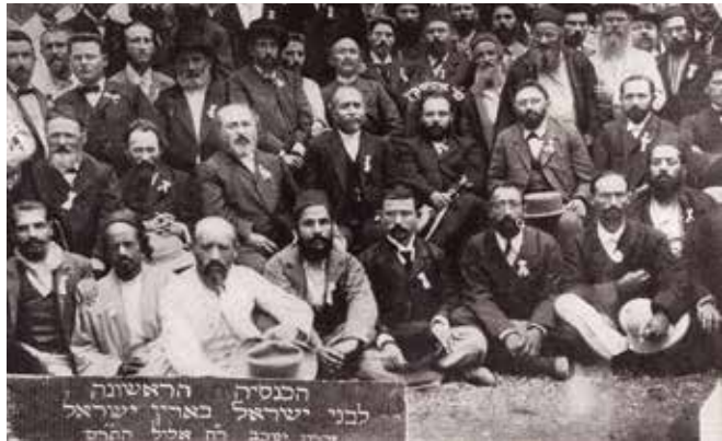
"הכנסייה הראשונה" בזכרון יעקב - מנחם אוסישקין מופיע בציון שמו

ה"כנסייה" נמשכה ארבעה ימים והרוח החיה בארגונה ובניהולה היה המנהיג הציוני מנחם אוסישקין. מטרתו העיקרית הייתה לאחד את היישוב נגד תכנית אוגנדה של הרצל, שפורסמה באותה עת והוא זכה לתמיכה גורפת בהצעתו לשגר מברק להרצל נגד התכנית.