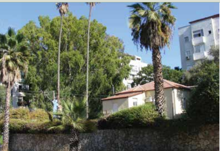
בית שניידרמן (מתוך תיק התיעוד)