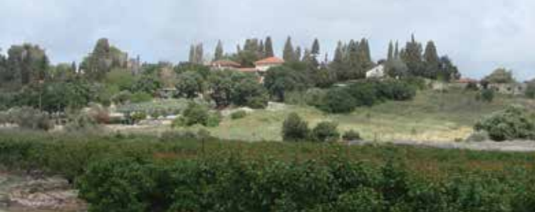
בת שלמה