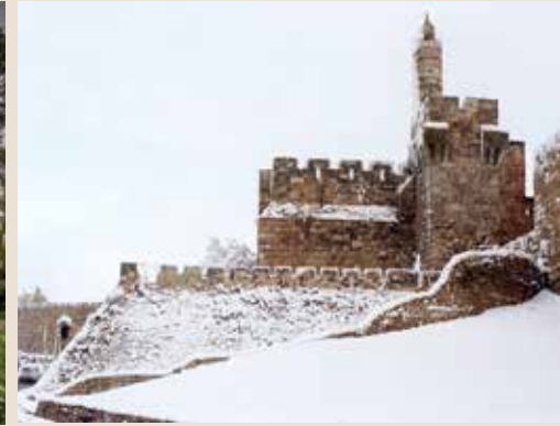
מקום ראשון מגדל דוד בשלג