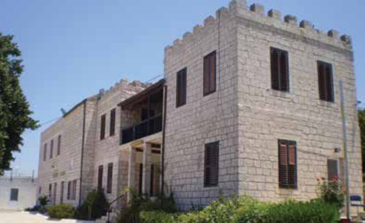
בית אוליפנט בדאלית אלכרמל

שימור באילניה: לקראת גיבוש תכנית מתאר חדשה למושב, יזמו תושבי רחוב הראשונים, הלב ההיסטורי של המושב סג'רה, תכנית מפורטת במטרה לשלב את נושא השימור תוך הסדרת עקרונות תכנון ופיתוח במתחם ההיסטורי. המועצה לשימור אתרים סיעה באמצעות מימון מחקר ייחודי ■