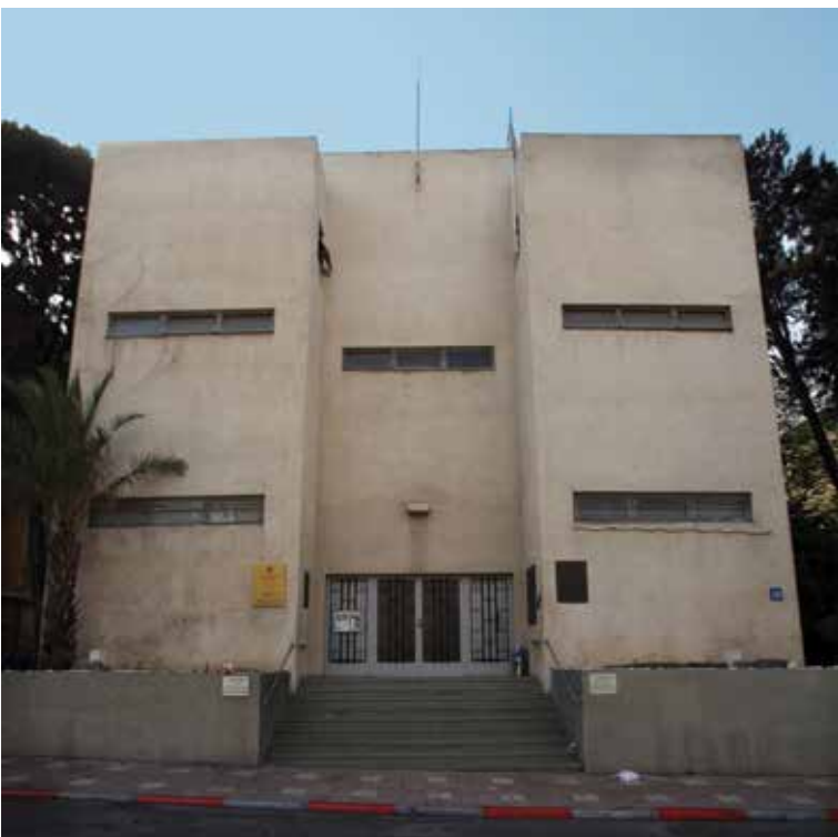
בית העצמאות בתל אביב

כבר רואים בה את השינוי. חֶשְׁבו כיצד הייתה נראית העיר אלמלא המאבקים הללו אותם הובילה המועצה. כיום אנו רואים יישובים ברחבי הארץ שאימצו את השימור כחלק מהתפיסה התכנונית שלהם כמו זכרון יעקב, מזכרת בתיה ורבים אחרים. שימור הוא לעתים יקר, ואולי יותר זול לבנות קניון או מגדל, אבל יותר ויותר יזמים מבינים את הכוח שיש בשימור ובשילוב הישן עם החדש. לא תמיד התוצאות מביעות את מה שהיינו רוצים לראות מבחינת השימור ולכן שמה היום המועצה דגש על הפצת הידע המקצועי באמצעות ימי עיון ופרסומים. בצד הפעילות לשימור פיזי, שחלקו מתבצע על ידי צוותי השימור שלה, עוסקת המועצה בחינוך לשימור ולמורשת ההתיישבות ומטפלת בהגברת המודעות הציבורית לחשיבות הנושא. היא מהווה "מטרייה" לכ-130 אתרי ביקור ומוזאונים לתולדות היישוב ומפעילה בעצמה תשעה מהאתרים הללו. המועצה הינה עמותה ולא רשות ממשלתית הפועלת מתוקף החוק, ועם זאת מצליחה לשנות את התפיסה ביחס לשימור.