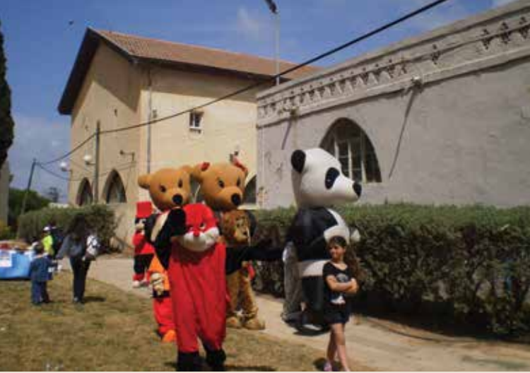
חוגגים פסטיחי על רקע המבנים ההיסטוריים

בימי חוה"מ פסח נערכו ימי "פסטיחי" במקוה ישראל. במהלך שלושת ימי החג ביקרו באתרי מקוה ישראל כ-10,000 מבקרים, שנהנו ממפגש בלתי אמצעי עם מגוון בעלי חיים, סדנאות הפעלה לילדים והדרכות באתרים ההיסטוריים