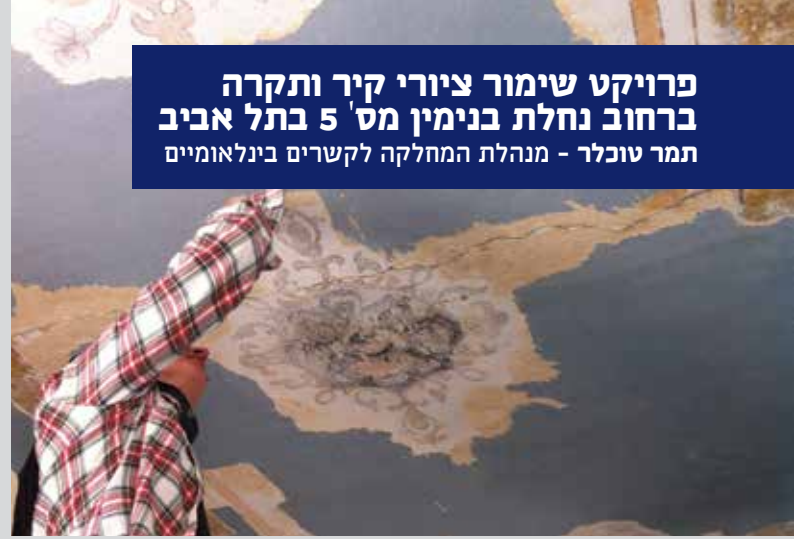
ציורי נוף ראשונים שנחשפו על גבי תקרה