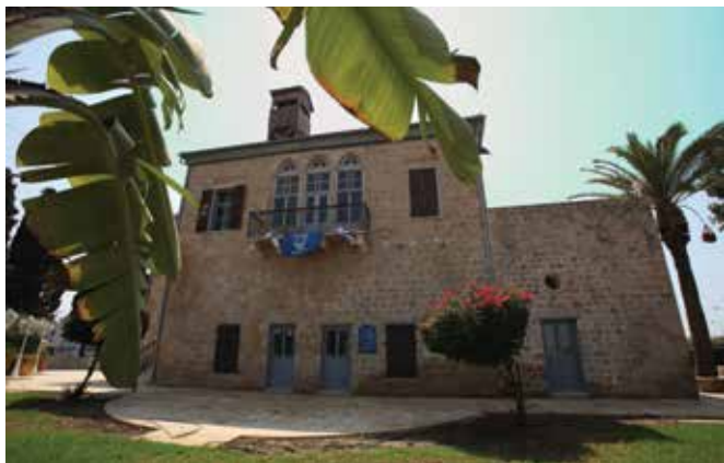
בית ליברמן לאחר השימור

כאמור, הוועדה המחוזית דנה בתכנית ובהתנגדות שהגישה המועצה והחליטה לקבל את ההתנגדות בחלקה. מועצה לשימור אתרי מורשת בישראל טוענת כי תכנית זו תפגע בבית ליברמן, שכבר היום שוכן בין שני מבנים מסחריים גדולים, ואינה נכונה לסביבתו. לכן קוראת המועצה לבחון מחדש את התכנון בשטח זה, תוך שילוב שיקולי שימור המתחם ■