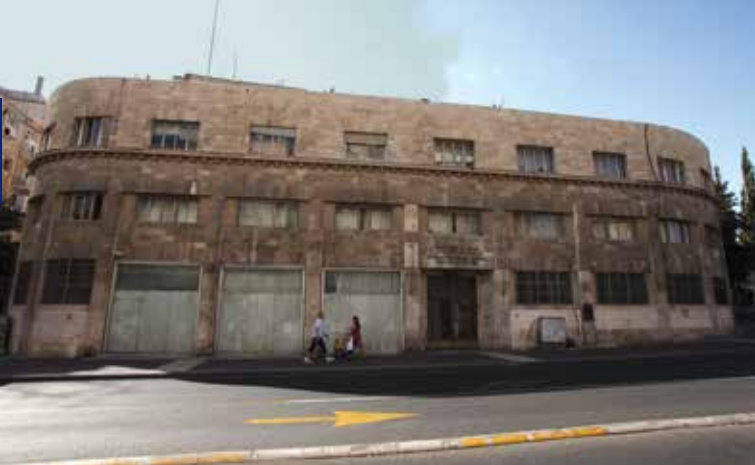
בית פרומין בירושלים