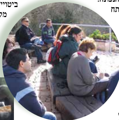
2. שיתוף חברי קיבוץ סטודנטים ורשויות תכנון בשימור חדר האוכל בתל יוסף, מרס 2012

בכל הדרכים שהוצגו לעיל שיתוף הציבור יכול להתבצע בחקיקה - קביעת חוקים הכופים את שיתופו של הציבור, או בהסכמה. השינוי ביחס החברה למורשת תרבותית, הבלטת הערכים - ההיסטוריים, האסתטיים או הסמליים, ההזדהות הגדלה עם הנכסים המבטאים ערכים אלה, ושיתוף הציבור בתהליך בחירת הנופים והנכסים הראויים להיכלל ברשימת מורשת, הובילו להכרה בכוחו של הציבור וביכולתו לשנות עמדות ותהליכים. לכוח וליכולת ביטויים מגוונים והם מתקיימים בשלבים שונים. כך למשל מקבל ציבור על עצמו לנהל נכסי תרבות ונופים שהוכרו לשימור בליווי הדרכה והנחיה ממסדית (תצלום 1) במקרה אחר מתדיינות קבוצות המייצגות אינטרסים שונים בדבר ערכיותו של נכס (תצלום 2) ובמקרה נוסף, הציבור שותף מלא לניהול התופעה ולשמירתה (תצלום 3)