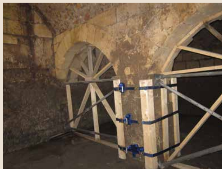
הבור הצלבני לאחר הפינוי

בחצר בית ילין התגלה בור צלבני. זהו חלל מיוחד בן 90 מ"ר, הכולל שני אולמות המחוברים באמצעות שלוש קשתות. במאמץ משותף של המועצה לשימור אתרים ורשות העתיקות פונה הבור והוא עתיד לשמש כאולם תצוגה במסגרת מרכז המבקרים של האתר ■