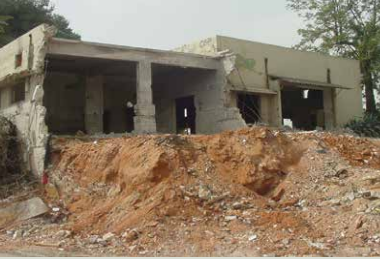
ההרס - שנת 2007

קיבוץ גבעת השלושה, באתרו הישן, נוסד בשנת 1925 באזור שכיום נמצא בלב פתח תקוה, מול קריית המוזיאונים. בראש גבעה, ממנה נגזר שמו של הקיבוץ, ניצב עדיין חדר האוכל בסגנון הבינלאומי (באוהאוס), אותו תכנן האדריכל אריה שרון. הוא נבנה בין השנים 1936-1939 וסביבו היה גן מטופח שכלל אלמנטים עיצוביים מאותה התקופה, חלקם עדיין קיימים במקום. לפני כעשור, עמותה לקידום החינוך התורני בפתח תקוה (נעם) ביקשה מהעירייה לבנות על הגבעה בית ספר יסודי וישיבה. הקמת המוסדות הללו היתה מסתירה את מבנה חדר האוכל ופוגעת באופן בלתי הפיך בשימור המבנה וסביבתו. ההקצאה לעמותה לא פורסמה להתנגדויות הציבור, ובשנת 2007 עלו דחפורים על השטח והרסו ללא היתר את כל חלקו הצפוני של חדר האוכל הפונה לרחוב הראשי (רחוב ארלוזורוב) לצורך