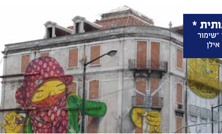
1. נכסי מורשת תרבות בלב ליסבון, פורטוגל, המשמשים מרכז תרבות ותיאטרון. הגרפיטי מעיד על ניכוסו הציבורי של הנכס, ליסבון, יוני 2012

פרופ' עירית עמית-כהן - יו"ר איקומוס ישראל וראש מסלול לתואר שני "שימור ופיתוח נוף ונכסי תרבות", המחלקה לגיאוגרפיה וסביבה, אוניברסיטת בר אילן