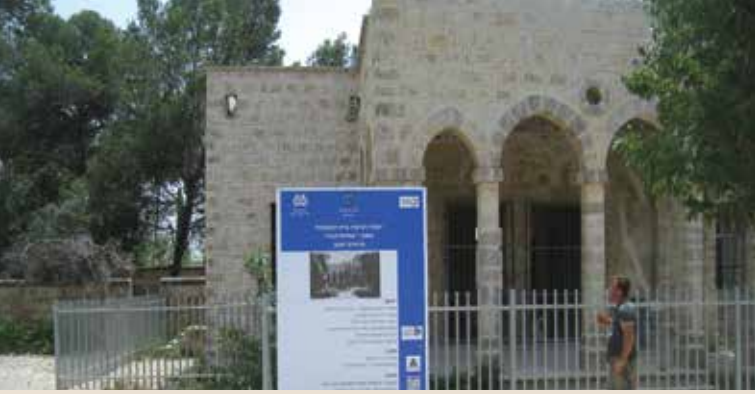
בית לנגה בזכרון יעקב

אוריה, מגדל המים במחניים, כבשן הסיד באל רואי והרפת בעיינות נמצאים בעבודה. במקביל אנו מקדמים תכנון מפורט ליתר הפרויקטים המיועדים לעבודה בשנת 2014 ■