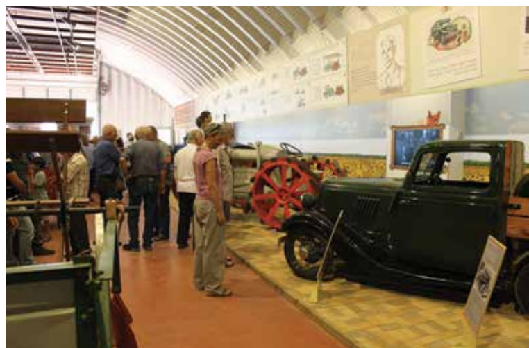
ההאנגר החדש בחצר הישנה בעין שמר

היום אוצר הוא מונח המדרג עובדי מוזאון בתחום המקצועי. ישנם למשל אוצרים לחינוך שאינם מופקדים על אוספים או עורכים תערוכות. כמו כן, פועלים היום אוצרים עצמאיים, שאינם קשורים למוסד יחיד, והם מתכננים ומלווים הקמת תערוכות בנושאים שונים ובמקומות שונים. עבודת האוצר כבר אינה נשענת אך ורק על העולם האינטלקטואלי אלא נובעת גם מהניסיון המעשי ומדרכי ההפקה של אמנים חזותיים.