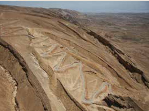
מקום שלישי מעלה עקרבים

פרויקט זה הינו תחרות צילום של אתרי מורשת, שהופעל על ידי עמותת ויקימדיה ישראל, התומכת בפעילות אתר האינטרנט ויקיפדיה, האנציקלופדיה החופשית בישראל, בשיתוף מועצה לשימור אתרי מורשת בישראל. זהו חלק ממיזם בינלאומי שמטרתו העלאת המודעות לאתרי המורשת. נותני חסות נוספים לפרויקט הינם גוגל ישראל, איגוד האינטרנט הישראלי וגליץ, בית הספר לפרסום. במהלך התחרות הציבור נקרא לצלם ולתעד את אתרי המורשת וכן להשתתף במגוון פעילויות ללא תשלום כגון סיורים באתרי מורשת וסדנאות צילום. בתום התחרות התכנסה ועדת השיפוט ובחרה את התמונות הטובות ביותר מבין אלפי התמונות שהועלו. שלושת