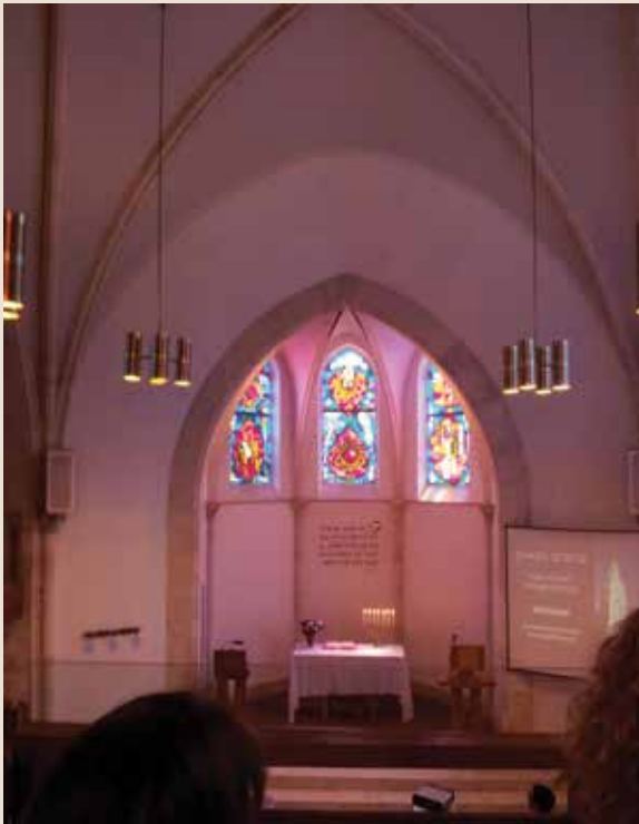
פסטיבל בתים מבפנים בתל אביב: ביקור בכנסיית עמנואל במושבה האמריקאית-גרמנית ביפו