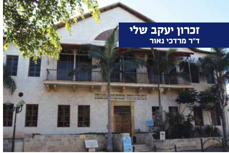
בית הפקידות, כיום מוזאון העלייה הראשונה

אחד משיריו הנודעים של הזמר אושיק לוי נקרא "זכרון יעקב שלי" והבית החוזר שלו אומר: "זכרון יעקב שלי, זכרון יעקב / לא תמצא מקום כזה, כזה טוב" (מילים ולחן: נפתלי אלטר).