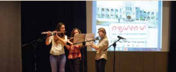
תלמידות הגימנסיה באתנתחא מוזיקלית