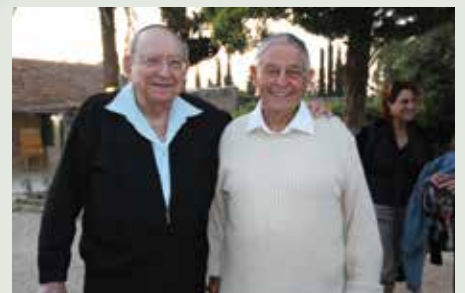
יוסי בחברת ח"כ וחבר הוועד המנהל לשעבר גרשון שפט