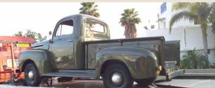
הטנדר שב למשטרת נהלל

"ישראל נגלית לעין" הוא מיזם קהילתי לתיעוד ולגיבוי של תמונות הארץ, תושביה ותולדותיה. מטרתו: לחזק את השותפות של תושבים מכל שדרות הציבור בסיפור המורשת הישראלי לדורותיו, על ידי שיתופם כמתעדים או מתועדים במפעל לתיעוד חזותי ושימור של תמונות מאלבומים פרטיים. במסגרת זו תושבים מתנדבים מתעדים את קהילתם. חומרי התיעוד נשמרים בארכיון המקומי ומגובים בארכיונים המרכזיים וברשת ארכיוני ישראל. התמונות ישמשו למחקר, לעיון, ללימוד, לתצוגות, לאירועי תרבות ואמנות, לפרסומים ועוד. את המיזם מוביל יד יצחק בן צבי בסיוע "ציוני דרך", משרד התרבות והספורט, מועצה לשימור אתרי מורשת בישראל וגופים נוספים. ניתן לצפות באלבומים באתר: www.israelalbum.org.il בחודש מרס נערך ביד בן צבי בירושלים יום העיון "ברחובות שלנו: