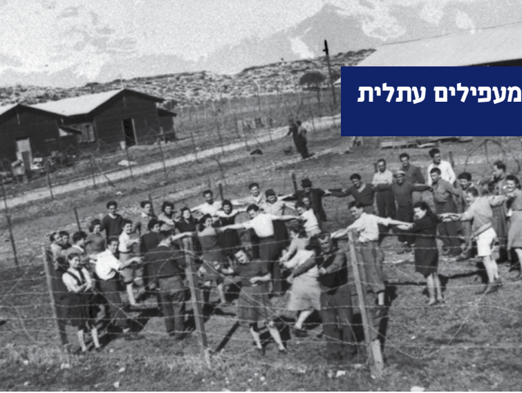
מעפילי האונייה "אנצו סירני" במחנה המעפילים עתלית. שנת 1946

"למען אלו אשר נולדו בארץ, למען אלו שמדינת ישראל היא להם דבר ברור ומוכן מאליו, כמו השמש הזורחת כל בוקר במזרח, כמו ריחה המשכר של פריחת ההדרים – למען אלו, אנו מביאים מסיפוריהם של חברינו, אשר כדי לזכות ולהגיע אל האור, עברו באפלה הגדולה – ואשריהם שזכו בכך".