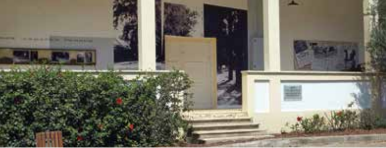
הכניסה למוזאון