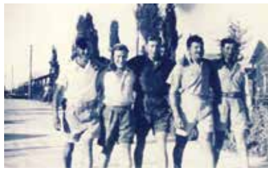
אנשי אצ"ל במחנה

ולאסוף עדויות ממקור ראשון, ברגעים האחרונים בהם אנו, בני דור ההמשך, עדיין יכולים לשוחח עם חלק מהמעפילים, ולשמוע את קורותיהם ואת תחושותיהם. פעמים רבות אנו מגלים כי לא תיעדנו סיפור ועתה מאוחר מדי. מסיבה זו אנו מקפידים לאסוף מכל מבקר באתר פרטים של אנשים שהיו מעפילים או פעילים, ומנסים לפרסם את המאגר בכל דרך אפשרית. התחקירנים מתקשרים אל מי שהיו מעפילים, או אל בני משפחותיהם ואוספים מידע. דרך שיחות הטלפון אנו מגיעים למעפילים רבים נוספים, בני משפחה, חברים ומכרים וכך מתרחב המעגל. חלק מהתיעוד מתבצע בבתיהם של המעפילים או של בני משפחותיהם. קבצי האודיו והווידיאו נשמרים במאגר ובעתיד יעברו עריכה ויצורפו בחלקם למערכת הממוחשבת החדשה. אנו אף מקיימים שיתוף פעולה עם ארגונים אחרים העוסקים בנושאים שיש בהם חפיפה לנושא ההעפלה כמו "יד ושם", "משואה" ואחרים, ועם ארכיונים בהם אצורים חומרים היסטוריים רבים.