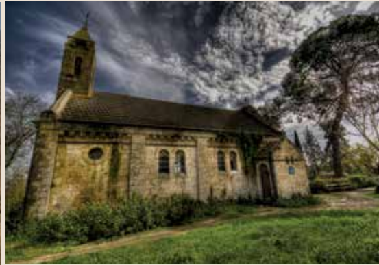
מקום שני הכנסייה באלוני אבא