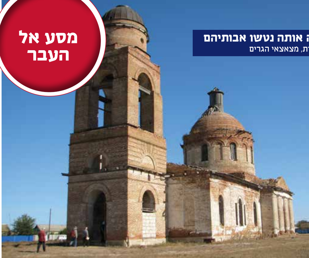
הכנסייה בסלודניקי