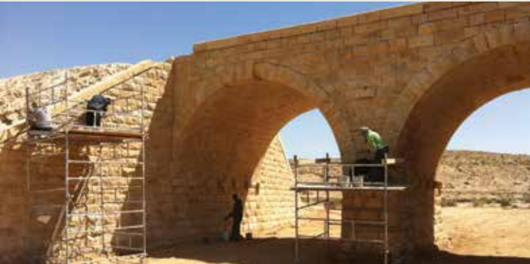
שיקום הגשר

בתי באר בתל אביב: בעקבות פעילותנו הציבורית להעלאת המודעות לשימור בתי הבאר, יזמה עיריית תל אביב עריכת סקר. בוועדה המחוזית נמצאת תכנית לשימורם וכן הכרזת סעיפים 77 ו-78 על חלקם, כאשר חלק מהמבנים מוגנים במסגרת תב"עות נקודתיות