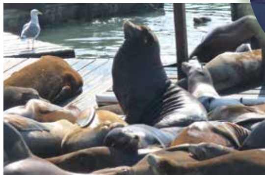
3. שמירה על כלבי הים בסן פרנסיסקו, ספטמבר 2012

* גרסה מורחבת של המאמר, כולל הפניות, מופיעה באתר האינטרנט של מועצה לשימור אתרי מורשת בישראל www.shimur.org.il