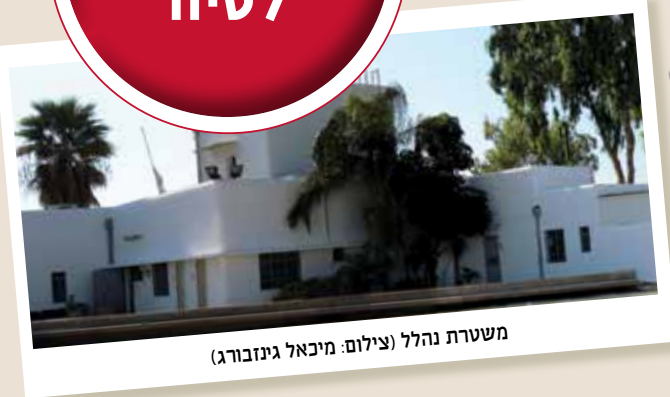
משטרת נהלל