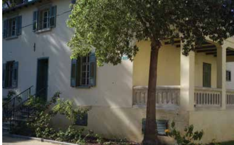
שרונה בתל אביב