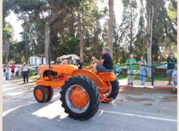
כנס מיכון חקלאי עתיק בעין שמר - תהלוכת הטרקטורים