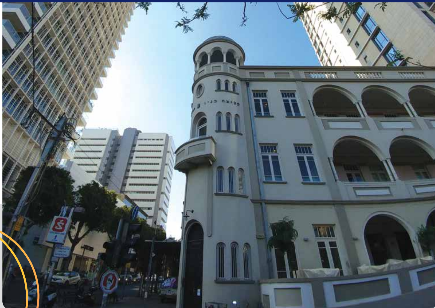
תל אביב, שד' רוטשילד 32 (בעבר מלון בן נחום)