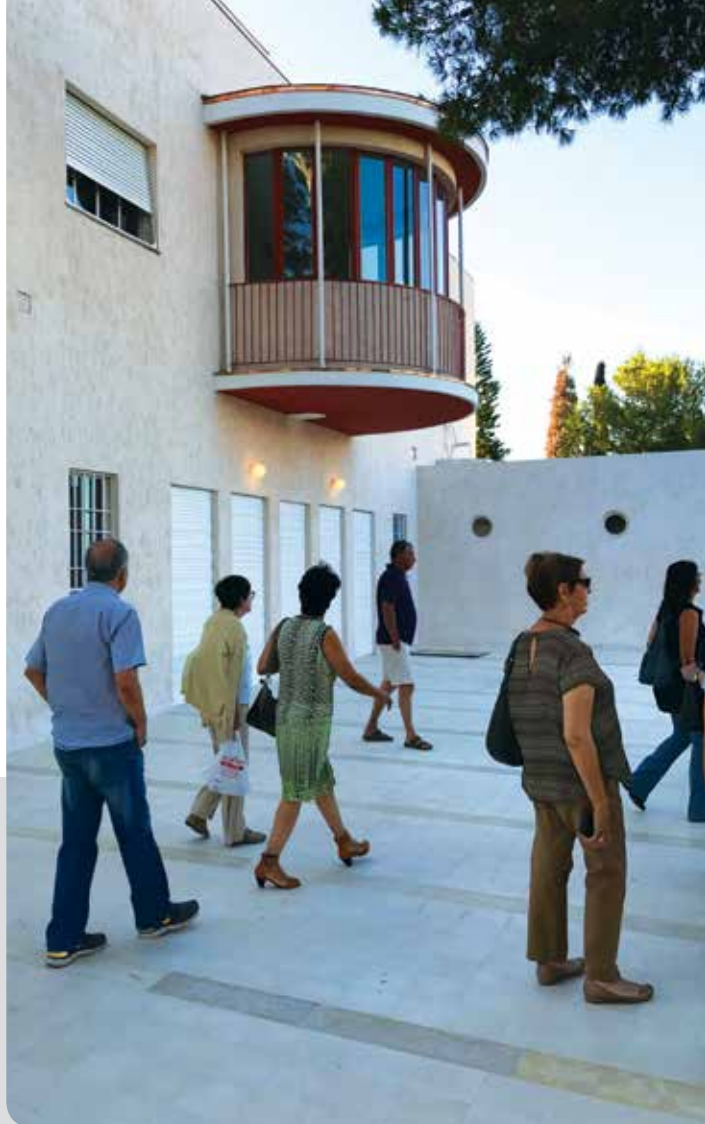
רחובות, בית ויצמן

מועצה לשימור אתרי מורשת בישראל מארגנת סיורי שימור ומורשת לקבוצות מאורגנות, על פי תיאום.