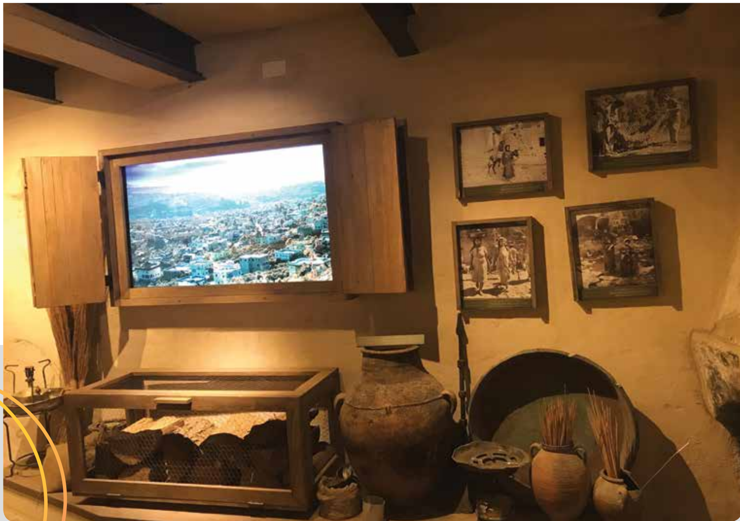
פקיעין, בית זינאתי מורשת יהודי פקיעין, מרכז מבקרים