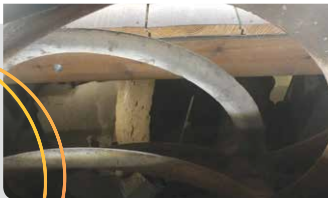
תל אביב, שרונה-הקריה, בית הבד