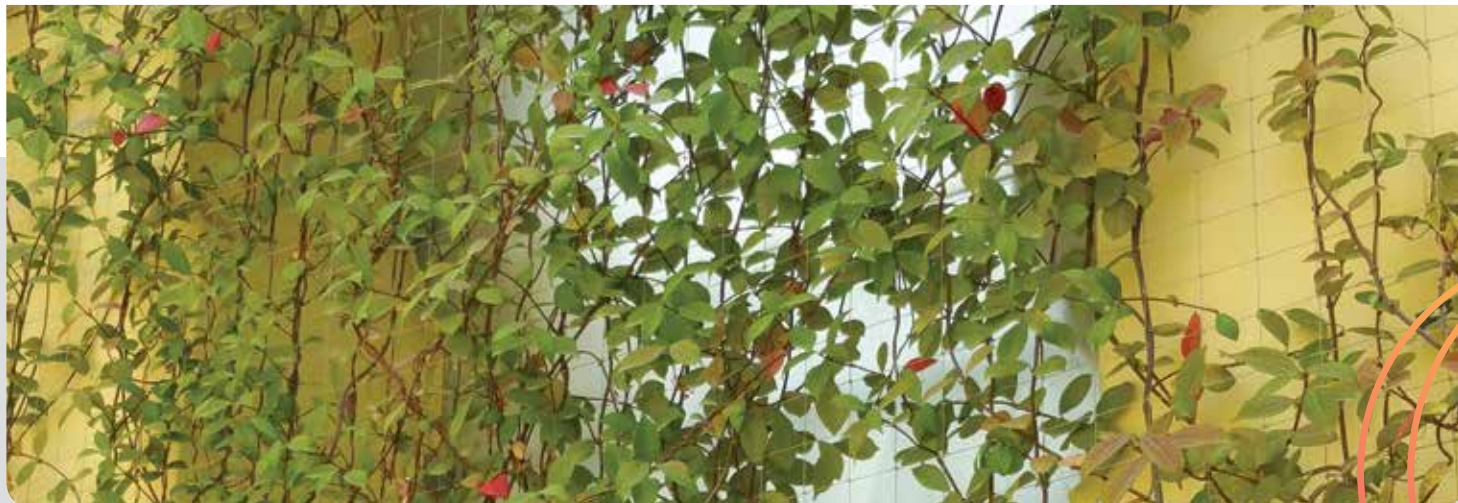
באר שבע, מחאון לתרבות האסלאם ועמי המזרח

כנס לציין 100 שנה לייסוד ארגון מגדלי הדבש יום חמישי, כ"ג באלול תשע"ז, 14.9.2017 שעה: 09:00 פרטים והרשמה: טל' 08-9404491 בשיתוף: בית ראשונים נס ציונה, עיריית נס ציונה, מועצת הדבש