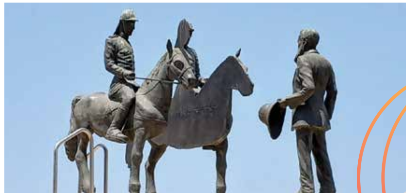
פגישת הרצל והקיסר הגרמני וילהלם השני, מקוה ישראל, פסל של האמן מוטי מזרחי

ערב עיון יום רביעי, ה' בחשון תשע"ח, 25.10.2017 מחווה לתערוכה: "בלוז לכחולי המדים" המוצגת במוזאון חצר היישוב הישן ע"ש קפלן, ירושלים פרטים והרשמה: טל' 02-6276319, 052-4002478 * כיכר ספרא, בנין 1, קומה 0