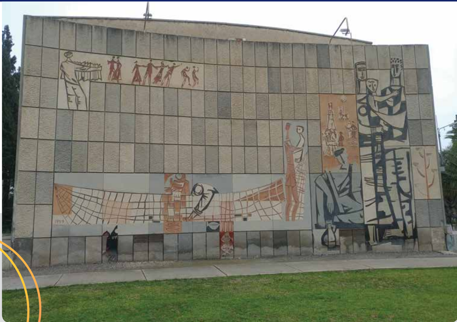
אשדות יעקב איחוד, בית קרפ: עבודת הצייר אריק קורן