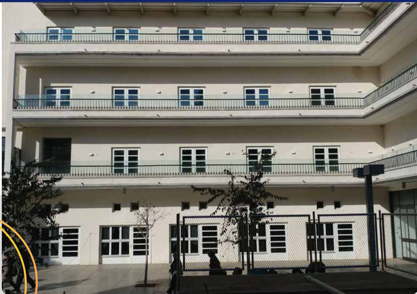
תל אביב, בית צעירות מזרחי, רח' דב הזז