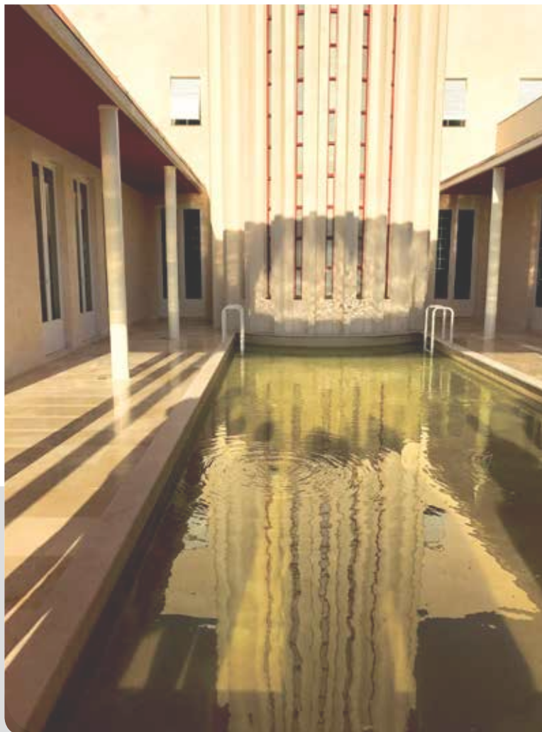
רחובות, בית ויצמן