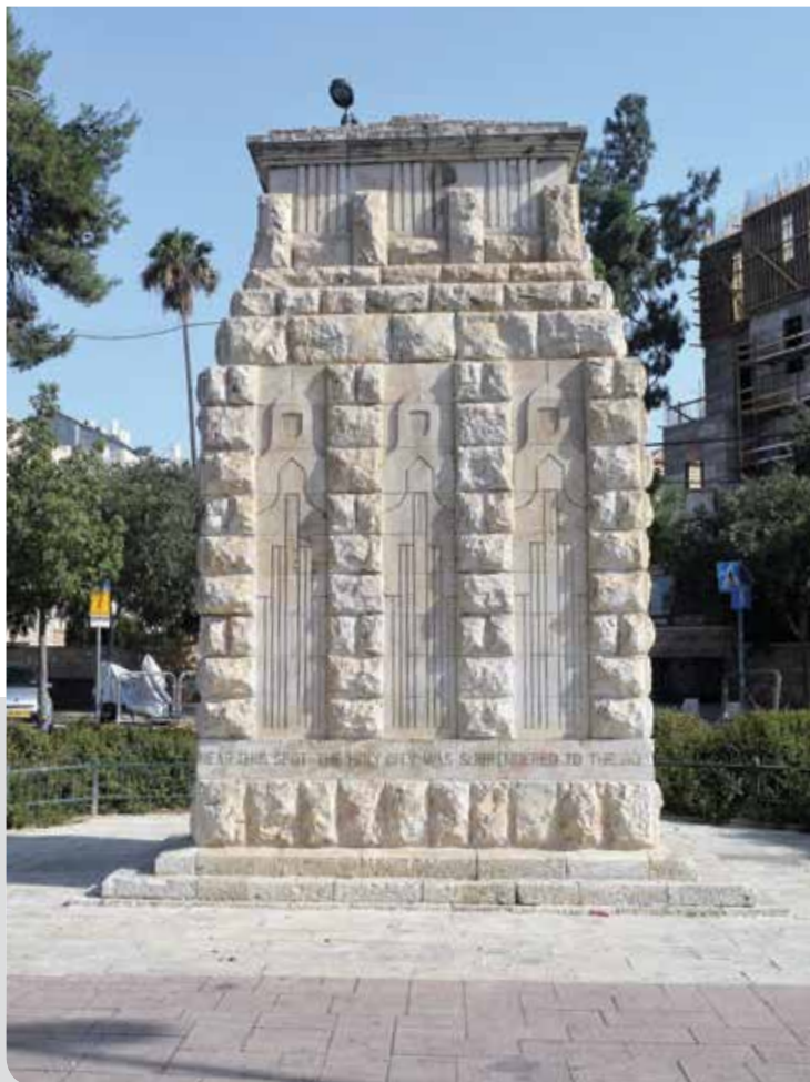
ירושלים, האנדרטה לכיבוש ירושלים ע"י הבריטים במלחה"ע הראשונה, שכונת רוממה