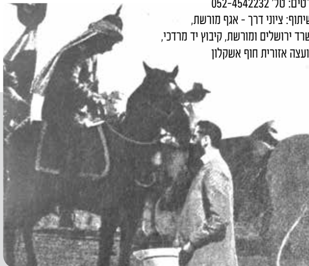
פגישת בנימין זאב הרצל והקיסר הגרמני וילהלם השני בשערי מקוה ישראל 1898

יום חמישי, ו' בחשון תשע"ח, 26.10.2017 פרטים: טל' 052-4542232 בשיתוף: ציוני דרך - אגף מורשת, משרד ירושלים ומורשת, קיבוץ יד מרדכי, מועצה אזורית חוף אשקלון