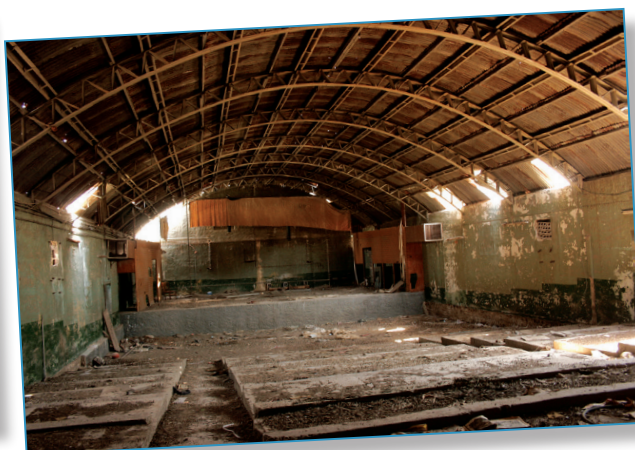
אורי פדן, אדריכלים