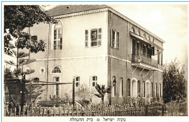
מקוה ישראל • בית ההנהלה