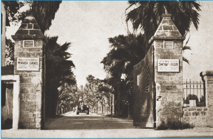
ארכיון ביה"ס החקלאי מקוה ישראל

החל מהקמתו של המבנה בשנת 1895 עד לשנות ה-60 של המאה ה-20 הייתה חלוקה תפקודית ברורה בין הקומות: בקומה התחתונה היו משרדי בית הספר והקומה העליונה שימשה למגורי המנהל ולאירוח אישיים.