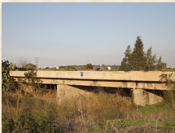
גשר פריזר נחל גוברין