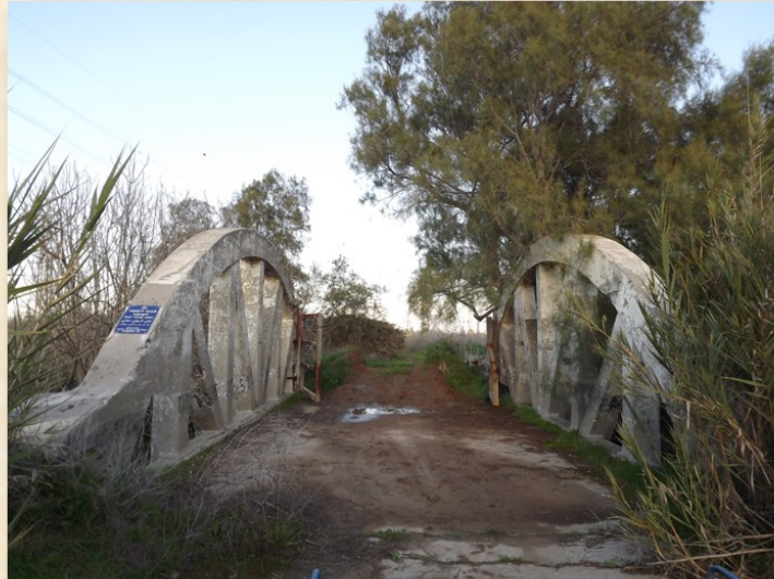
גשר הקשתות נחל לכיש

זחלתי קצת החוצה והצצתי לאורך הכביש כדי לוודא אם כולם עומדים על שדה המוקשים. ואכן, המשוריינים עמדו על המוקשים. כבר התחלתי לזחול בחזרה לעבר תיבת הפיצוץ כדי ללחוץ על הכפתור והינה ראיתי פתאום, במבט אחרון, בסוף השיירה שתי משאיות ועליהן מיטות ילדים לבנות! אחרי הזעזוע הראשון צעקתי אליהם "מי אתם?" ואכן התברר שהיו אלה ילדי דורות ורוחמה שעמדו על המוקשים. הואיל והנגב נותק וקשר האלחוט אתם אף הוא נותק, החליטו על דעת עצמם לפנות את הילדים צפונה. היה זה הרף עין שקבע את גורל השיירה."