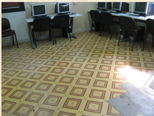
ריצפה מסוגנת בקומה השנייה