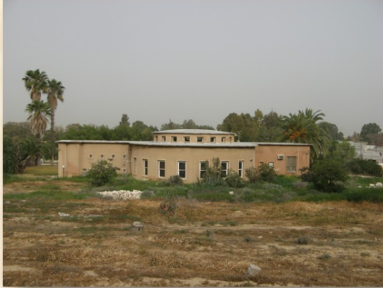
בית בורוכוב - משמר הנגב

קיבוץ שהוקם בצד בֵּיר-מְנַצְוֶה (=ב'אר מנצחת') על-ידי בוגרי ' הנוער הבורוכובי ' ונקרא תחילה ' מצודת בורוכוב '. במלחמת העצמאות שימש גם ' משמר-הנגב ' בסיסה של אחת משתי מחלקות ' חיות-הנגב ' (ראו ' אורים ', לעיל!) – ומכאן אף יצא לימים הכוח, אשר כבש את באר-שבע .