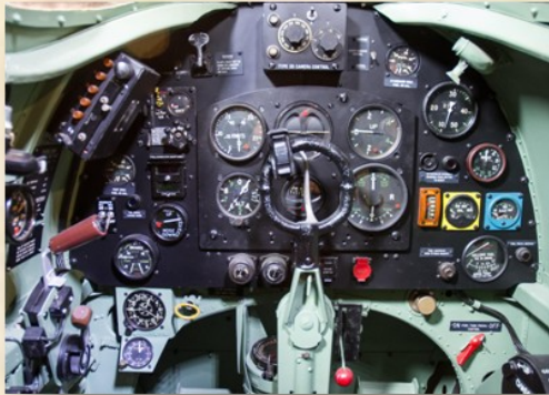
לוח מכשירים תא טייס מטוס ספיטפייר