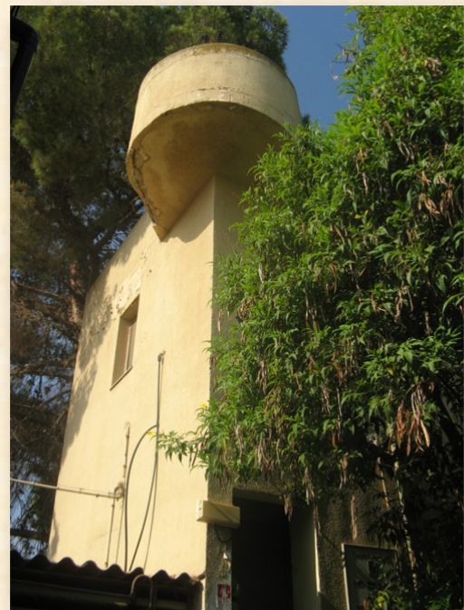
בית הביטחון שובל

קיבוץ על מקום יישובם לשעבר של בני כָּלֵב , משבט יהודה (דבה"י"א ד: 1) – אשר מקור שמו בבני החוֹרֵי מהר שְׁעִיר, שנתערבו בבני כָּלֵב. לימים נתגלגל ב' סוֹבֵלָה ', המצוינת ב'מפת מידבא' – וכך הפך בפי הבדווים לח'רבת אֶזְבָּאֵלָה [=הזבל'], עַם בֵּיר-זְבָאֵלָה [=באר-הזבל'] בצידה. לאחר קום המדינה נשאו את שמו ' ה"שוֹבֵלִים" – שורה נוספת של ' י"א נקודות ' על ' סף המדבר ', בין בית-קמה לבין תקומה (בצד כביש 293), רובן ככולן מושבי עולים חדשים ! אברהם הַרְצֶפֶלְד , שעמד בשעתו בראש 'המרכז החקלאי' של הסתדרות העובדים ונהג ללוות כל 'עליה על הקרקע' בניגון חסידי ובריקוד הורה סוער, היה מלא גאווה על מושבי העולים החדשים אשר הוקמו במרחבי הנגב: 'כל יום עצמאות אני יורד לנגב – לראות שם את היישובים החדשים: ממש אפשר להשתגע... ומי שלא משתגע – הוא לא נורמאלי!!! '