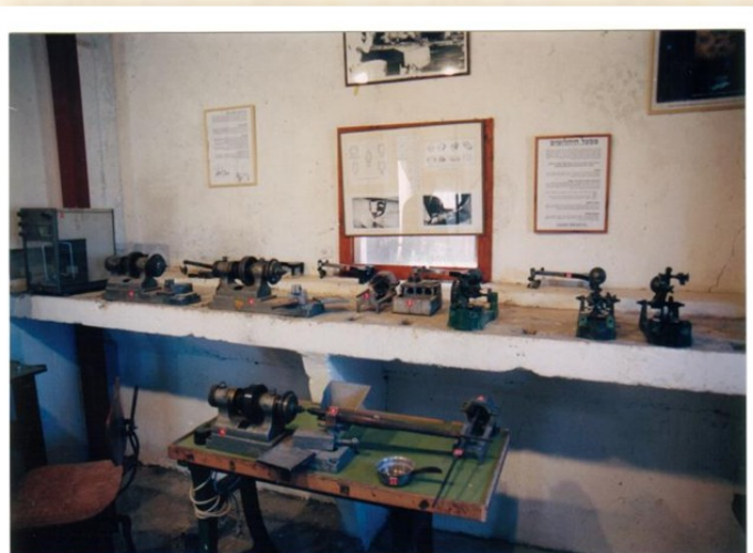
מפעל היהלומים מצפה גבולות