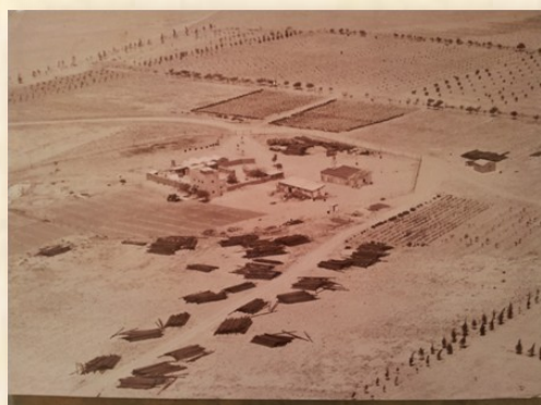
מצפה גבולות בעת הנחת קו המים 1947

גרעין קיבוץ ארצישראלי י"ג' של תנועת 'השומר הצעיר' ישב משכבר הימים ב' עיין-הקורא ', מחנה ההמתנה בצפון-מערבה של ראשון-לציון , אשר נשא את כינויה הראשון של המושבה, בעקבות השם הערבי 'עין קרא' [=מעיינות קרירים] - אשר צלצל באוזני הביליונים, הנלהבים מכל קשר אל 'ארץ אבותינו', כשם מקום תשועתו של שמשון הצמא בשעתו (שופטים ט"ו: 19). חלק מחברי אותו גרעין כבר הקים תחילה את קיבוץ ' גבולות ' - אחד משלושת ' המצפים בנגב ' (1943) – בעוד האחרים מוסיפים להמתין שם ליעלייה על הקרקע'.