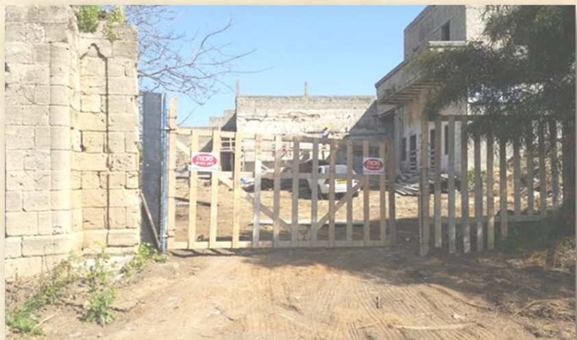
אתר בית הסביל

עד כאן לקט פאה ושכחה חג אביב שמח יוגב עפר מנהל המחוז