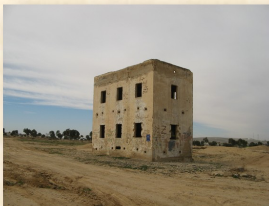
בית הביטחון הנטוש נבטים