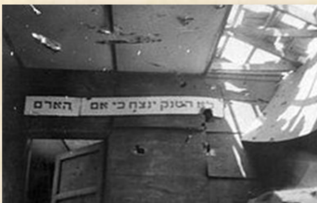
כרזת אחד במאי 1948 בחדר האוכל של הקיבוץ אחר הקרב

על מקומה הראשון של 'דְּנָגוֹר/נירים' יושב היום קיבוץ 'סוּפָה' – וסמוך לו במזרח שומר קיבוץ 'ניר-יצחק' על זכר השם 'נירים' ואף על זכרו של יצחק שדה.