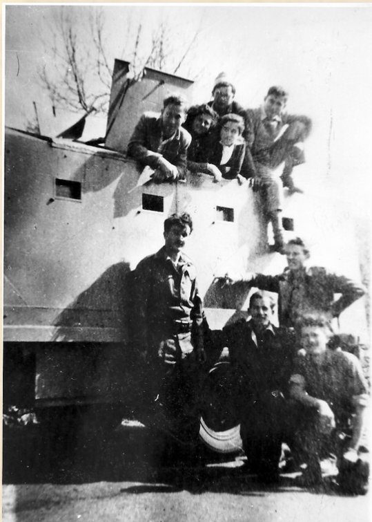
משוריין-ליווי 'ארוך' בשיירות תש"ח

במלחמת-העצמאות צרו על קבוצת 'כפר-דרום' שכניהם הערבים עם 'האחים המוסלמים' ואף צבא מצרים – אשר ציר פלישתו לארץ עבר בצידה! – ארבעה חודשים רצופים, עד פינויה (8 ביולי 1948).