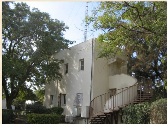
בית הביטחון חצרים

תוך חמישה חודשים ומשהו קבעה אותה ועדה 561 שמות חדשים – שפורסמו ברשימון נספח לשנתון הממשלה תשי"א – ולפיכך רבים בהם השמות, אשר נקבעו על רגל אחת: לשמות הכפרונים 'אל-מִחְרָקָה' ו'פּוֹפְחָה' וכן לזה של יישוב הבדווים 'ח'רבת סְמָאָרָה' הוענק צלצול עברי בהטעמת מלרע – 'מִחְרָקָה', 'פּוֹפְחָה' ו'שְׁמִיר'; בעוד 'קֶלְטָה' זכתה הפעם מידי חברי אותה ועדה בשם המקראי ' חֲצָרִים ' – בעקבות הכתוב 'וְהַעֲוִים, הַיּוֹשְׁבִים בְּחֲצָרִים' (דברים ב': 23), המלמד על ראשית התיישבות-הקבע בצפון-הנגב, בצד מכלאות-צאן.