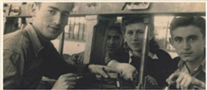
עובדים במלטשת שטיין 1942

זה מה שאפשר להם ל"היעדר" מהעבודה לפעילות מחתרית - קצת כמו היחסים בין הקיבוצים להכשרות הפלמ"ח... בסיום המלחמה נפסק העניין והפועלים פוטרו, לקח זמן עד ששוק היהלומים התאושש. חלק מהמלטשות עמדו נטושות. בסופו של דבר אנשי אצ"ל שליטשו את "היהלום המלחמתי שבכתר", חפרו מתחת לאחת המלטשות הנטושות את הבונקר שם הוסתרו הסרגינטים והלמו בבריטים.. "ויהלום בכתר!".