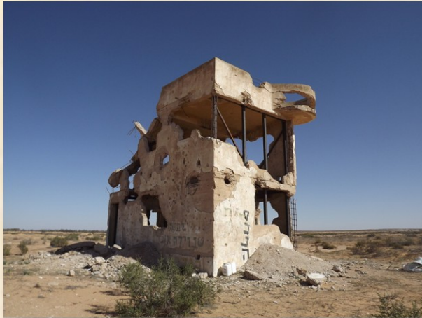
בית הביטחון אורִים אחר שימש מטרה צהלית שוקם ע"י המועצה לשימור אתרים