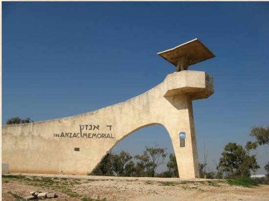
יד האנז"ק - יער בארי

קיבוץ בארי שימש במלחמת העצמאות גם בסיסה של אחת משתי מחלקות 'חיות הנגב' – יחידת-הסיור הנודעת של חטיבת פלמ"ח-'הנגב', שנועדה לשמור על זרועות צינור-המים – כשחברתה ממוקמת בקיבוץ 'משמר-הנגב'.