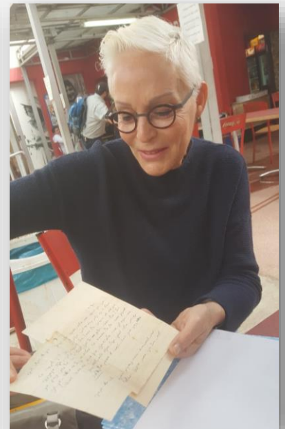
זוה נוסח המכתב: