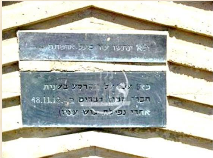
השלט שנותר במקום: עמוד ענן

בדצמבר 1948 נכנסה למקום לגור - כמחנה זמני - קבוצת חברי קבוצת "רבדים" שלא הלכה לשבי הירדנים. החברות מהשבי הגיעו קודם וחיכו בכפר-מנחם לחבריהם שיחזרו מהשבי הירדני. יעדם היה שטח אדמה שנקנה שנים קודם על-ידי יהודים ליטאים, שחלמו להקים ישוב בשפלת-יהודה. המקום היה אמור להיקרא בשם: "כפר-קנאים", לזכר "המרד הגדול" ברומאים בימי בית שני.