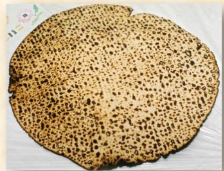
מצה שמורה: Chabad.org

מצה שמורה היא מצה ברמת כשרות גבוהה מהרגיל ונועדה, בדרך כלל, לצורך "מצת מצָה". היא נקראת כך, מפני שהיא נשמרה ממגע מים (פרט למי הלישה) משעה שנקצרו החיטים בעבורה ומפני שבכל שלבי אפייתה, הוקדשו הפעולות לשם קיום המצווה. המנהג הרווח הוא לאכול מצות שמורות בליל הסדר בלבד ובשאר החג לאכול מצות "רגילות". עם זאת, יש המחמירים ואוכלים מצות שמורות במשך כל החג.