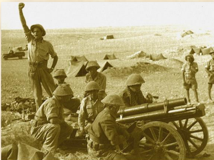
נפוליאונצ'יק בפעולה בנגב: ויקיפדיה

"משלט התאנים" ממוקם כקילומטר וחצי צפונית-מזרחית למשלט עיבדיס. בקרבות הקשים השתתף גם כוח תותחנים אשר היה מסופח לחטיבת גבעתי והגיע למקום עם התגבורת במהלך הלחימה על משלט עיבדיס כסיוע ללוחמים. במפת הקרב ב"ספר גבעתי" נקרא "משלט התאנים" - "גבעת התותחנים". קבוצת חיילי התותחנים הציבה על הגבעה ארבעה תותחים מסוג 'נאפוליונצ'יק' בקוטר 65 מ"מ שיוצרו במלחמת העולם הראשונה. ה'נאפוליונצ'יקים' היו מתוצרת צרפת ונראו ישנים מאוד.. התותחנים היו קטנים ונמוכים, בעלי יכולת דיוק נמוכה ומצבם רעוע למדי. למרות כל החסרונות, השפעתם הייתה משמעותית.