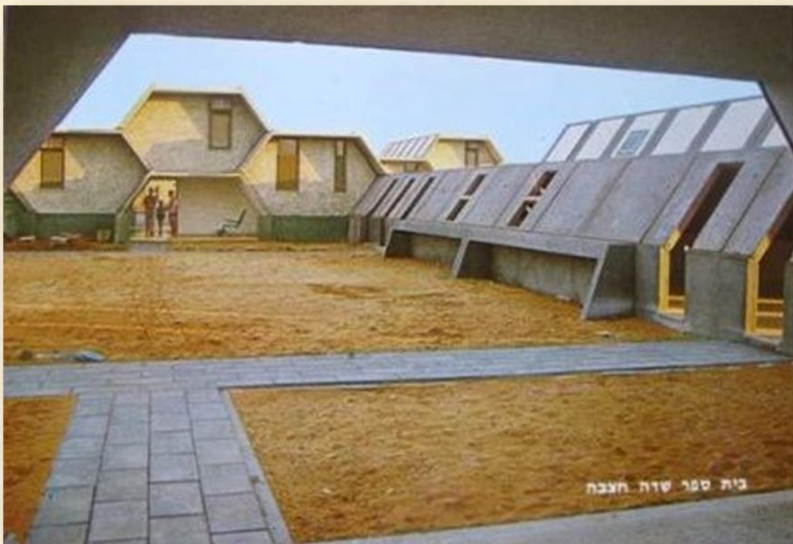
בית ספר שדה חצבה - אדריכל ישראל גודוניץ

גיליון מס' 24 י"א סיון תשע"ט, 14 יוני 2019