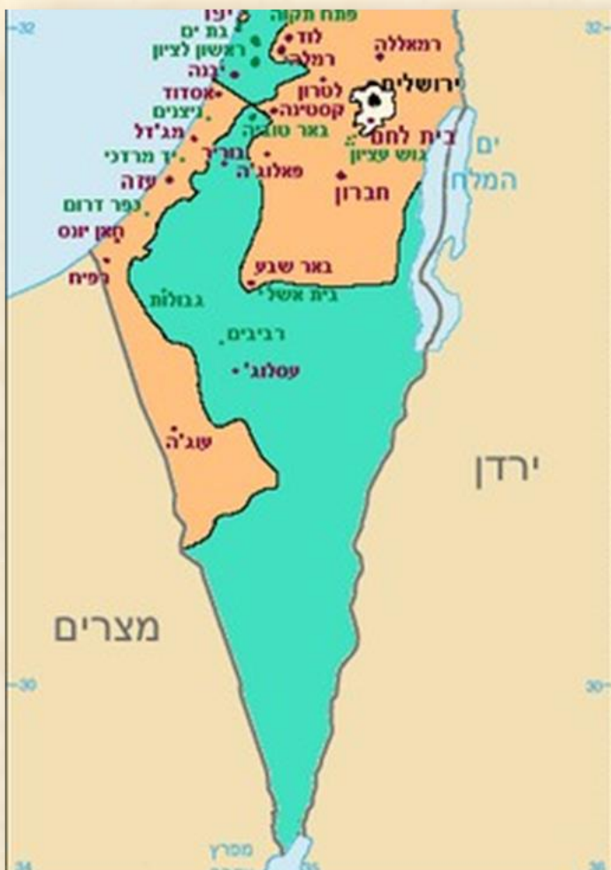
מפת החלוקה דרום הארץ: ויקיפדיה

במפת חלוקת ארץ ישראל שהתקבלה באומות המאוחדות ביום 29 בנובמבר 1947, נכלל רוב הנגב בתחומי המדינה היהודית בזכות 22 ישובים עבריים זעירים שהיו מפוזרים בשטחו; לעומת זאת, בין חבל הבשור לבין הים התיכון נגזרה רצועה ארוכה, מגבול מצרים ועד צפונית לאשדוד, שהייתה מיועדת לעבור לשליטת מצרים כ"שלוחה" של סיני. ברצועה זאת ישבה אוכלוסייה ערבית - חלקה ממוצא מצרי - וכללה משפחות ממוצא בדווי (בעיקר במזרח הרצועה ובדרומה); בתוך שטח הרצועה המוצעת היו גם הישובים העבריים כפר דרום, יד מרדכי וניצנים (שנכבשו לאחר פלישת המצרים עם הכרזת המדינה). נירים (דנגור), בארי, בארות יצחק וסעד נשקו לגבול הרצועה.