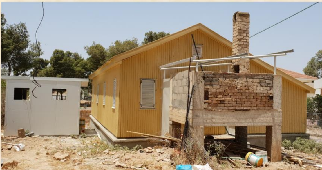
צריף אפיית המצות אחר השימור: עפר יוגב

לאפיית המצות לחג הפסח הלכות רבות המפורטות בתלמוד ובספרי הפוסקים. הלכות אלו מתייחסות לקמח ולמים שמהם נאפית המצה ולתהליך האפייה. אפיית המצות מתבצעת בדרך כלל במבנה המיועד לכך ומכונה "מאפיית מצות".