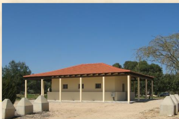
בית שביתת הנשק בגבול הרצועה, תפקד עד 1967: עפר יוגב