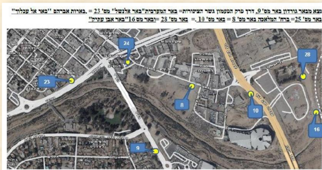
מפת מסלול הבארות