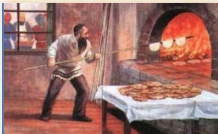
אפיית מצות בכפר חב"ד