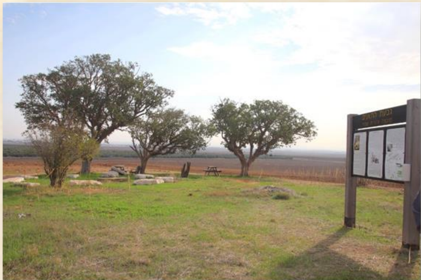
משלט התאנים: עפר יוגב