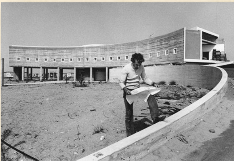
אדר' ישראל גודוביץ בעת השלמת הבניין בשנת 1971: אדר' ישראל גודוביץ

בתנ"ך שהוציא צבי אפרת ב-2004 תחת השם "הפרויקט הישראלי" כיכב גודוביץ כאחד האדריכלים היותר יצירתיים, מקוריים ויחד עם זאת מעשי ומציאותי. כפי שקורה בלא מעט מקרים (ובעיקר היום), עודף היצירתיות לא הביא את עבודותיו להיות מסובכות או מגוחכות ואף יתירה מזאת – עבודות שנוצרו לפני 40 או 50 שנה עמדו במבחן הזמן באופן חסר תקדים. כלומר, ביקור במקום הוא בית ספר לאדריכלות.