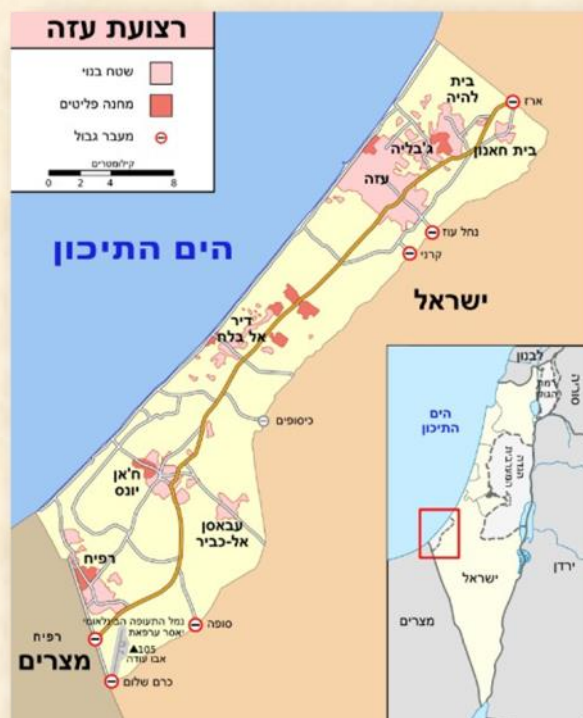
תחום רצועת עזה: ויקיפדיה

מתוך הבלוג "אבני גזית", דן גזית - קיבוץ גבולות