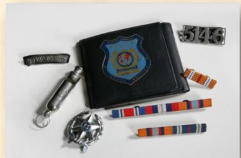
הסמלים כאבני דרך בחייו, כולל מספר השוטר הבריטי: גד סובול