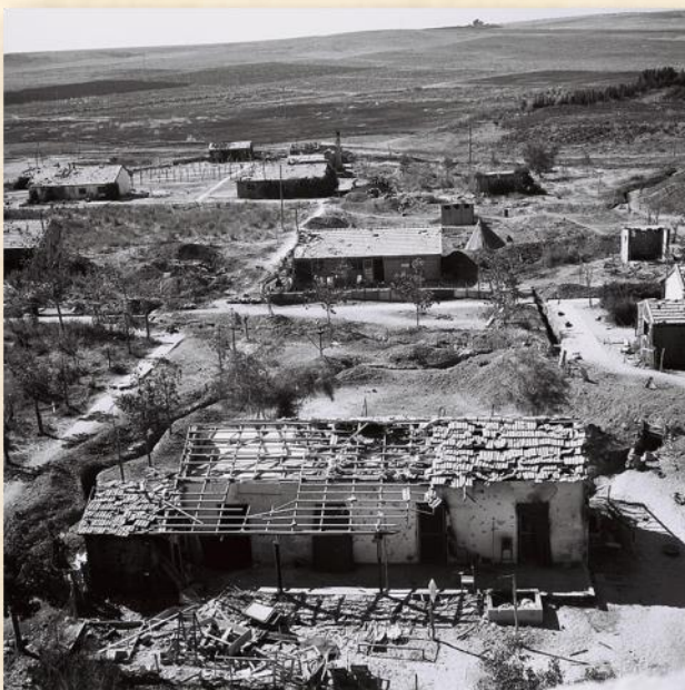
הרס בתים בנגבה