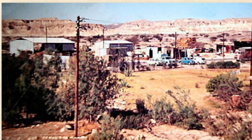
ההיאחזות, תחילת שנות ה-60: אתר מוא"ז ערבה תיכונה

מקצת ממורשתם שוקעה, בהמשך שנות השבעים ועד התשעים, בשכלול גידול הירקות ביישובי הערבה. צאו לדרך, קראו בספר וחשו תחושת ראשוניות במדבר.