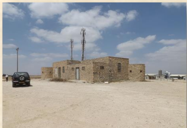
משטרת הרכבים ע"י קיבוץ שובל: שלמה ציזר