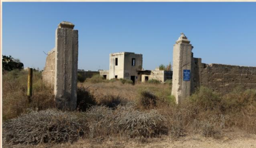
בית באר מוקף חומה בכניסה לאשקלון: ע.י

הרס מרבית החומה לטובת כביש גישה חדש לאשקלון