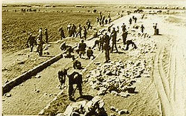
סלילת כביש הרעב: המכלול, אינציקלופדיה יהודית

לפיכך נאלצו המוסדות להפנות תעשייה לאופקים, בשיתוף המועצה האזורית מרחבים שגבולותיה נשקו ליישוב מכל העברים: מפעל למיון ואריזת ירקות, תחנת טרקטורים אזורית, מנפטת-כותנה, מפעלי הטכסטיל "אופק" ו"אופ-אר" (שהעסיק כ-450 עובדים ונודע בחדשנות האדריכלית שלו) וכן מפעלים