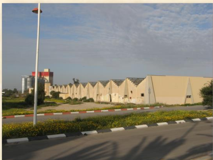
מבנה אופ-אר כיום: עפר יוגב