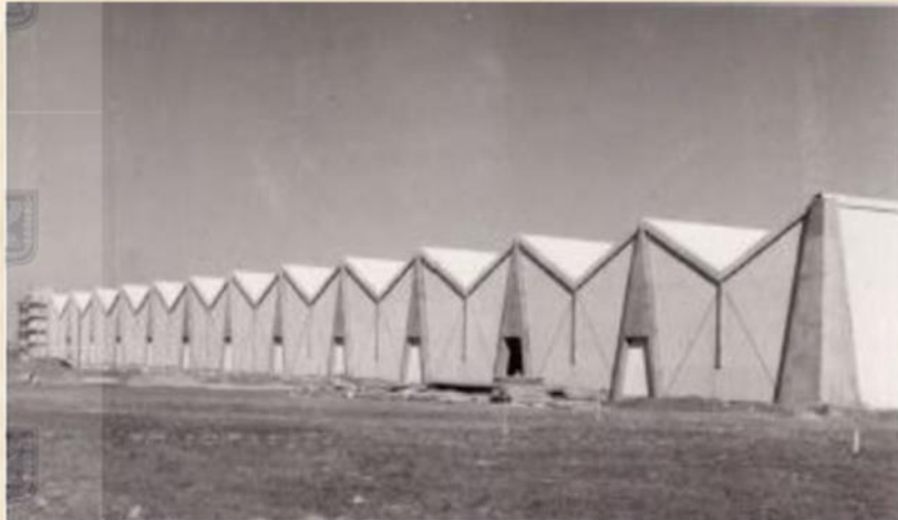
המפעל לקראת סוף הקמתו: הארכיון הציוני

המפעל עסק בייצור חוטים מכותנה גולמית ובדים. הוא פעל 24 שעות ביממה בשלוש משמרות והעסיק רבים מאד מבני המקום. בשיאו עבדו במקום מאות עובדים. אופ-אר היה אחד ממפעלי התעשייה הראשונים בעיירה המתפתחת והייתה לו חשיבות רבה בפרנסת התושבים.