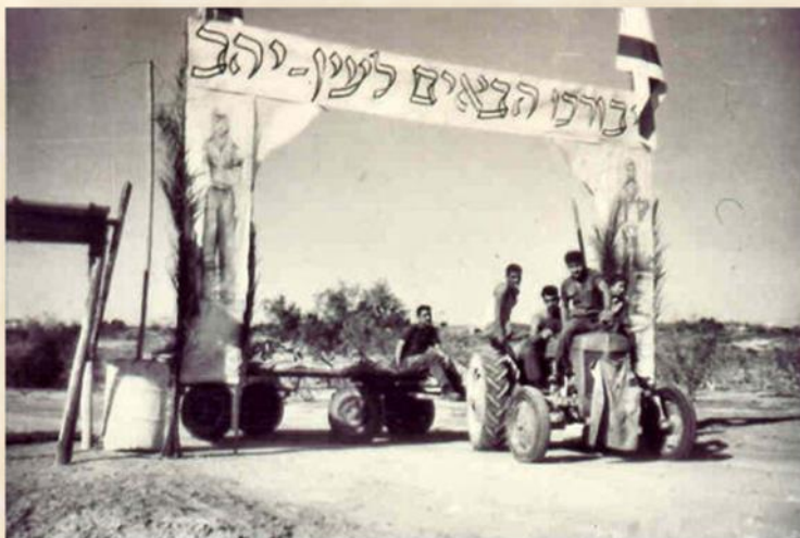
טקס העלייה לקרקע של גרעין נאות במעמד פולה ודוד בן גוריון 14.1.1960