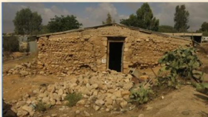
בייקת אבו כף: עפר יוגב

הפריסה הפיזית של היישוב משקפת במידה רבה את אורח החיים הבדווי, מורשת הנוף והמורשת התרבותית.