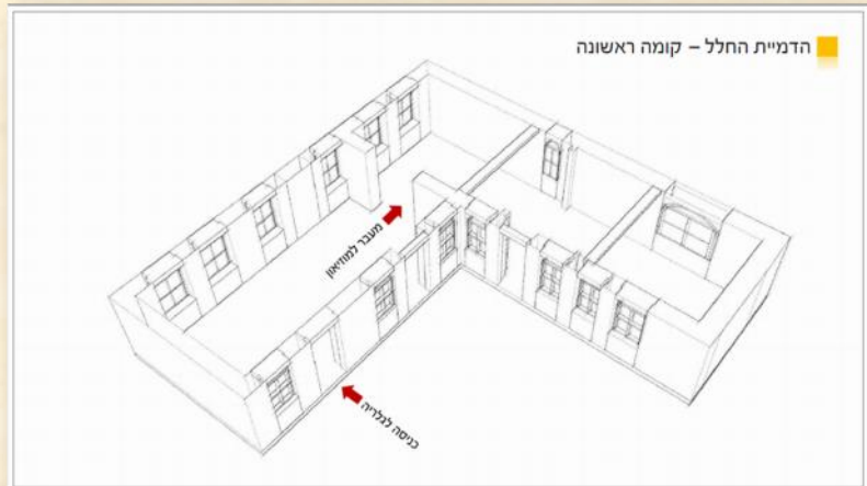
הדמיית קומת הגלריה והמוזיאון : גואל דרורי

ימי הרנסנס של אמנות הצילום תופסים מחדש חלק חשוב בתיעוד, מיום המצאת המצלמה ומראשית הצילום ועד ימינו על-ידי מצלמות