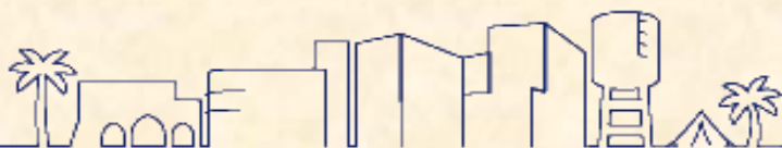
בית הביטחון נבטים: ע.י