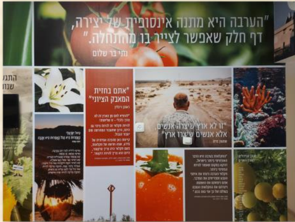
קיר הטפטים במרכז המורשת: שוש שירין

במשך שמונה שנים שכן היישוב על גבעה מעל "העמק הנעלם" שכיום נקרא פארק ספיר. ב-1962 התאזרח היישוב והפך למושבוץ וב-1967 עברו החברים ליישוב הקבע שהפך למושב עובדים. בשנים האחרונות ממשיך מושב עין יהב להתפתח ולהיות עוגן אזורי של פעילות עסקית, תיירותית וקליטה. בעין יהב מתקיים שילוב דורות בין הוותיקים והדור השני והשלישי והוא מתבטא בחגים ובפעילות תרבותית וחינוכית. היישוב מונה כיום כ-200 משפחות וכ-280 ילדים ונוער.