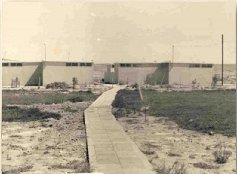
הדרקסלרים ב- 1958