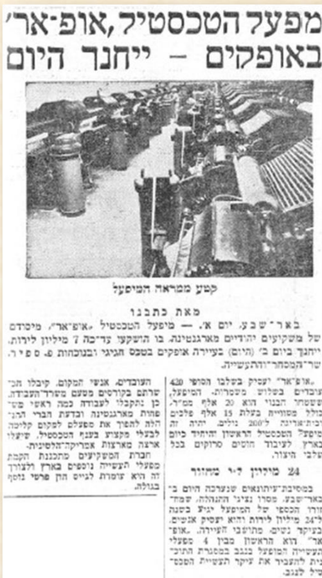
מתוך עיתון "על המשמר" 20 אוקטובר 1960

מפעל הטקסטיל הוקם על ידי משקיעים יהודים מארגנטינה ונחנך בשנת 1961; שם המפעל מורכב משילוב השמות אופקים-ארגנטינה (אופ-אר). את המפעל תכננו האדריכלים אשר גליברמן, יצחק רפופורט וצבי פרנקל והוא כלל מבנה משרדים ואולם יצור גדול עם חלוקת-משנה לאגפים.