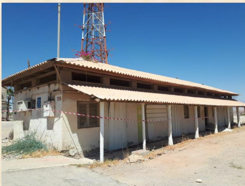
מבנה ראשית הישוב, כיום בסיס עין יהב: שוש שירין

שי בן אליהו ז"ל וחגי פורת ז"ל נענו לקריאתו של דוד בן גוריון וב-1958 הגו את רעיון ההתיישבות בעין יהב, כאשר כל המוסדות לא האמינו שיישוב יוכל לשרוד במקום בתנאים כאלו.