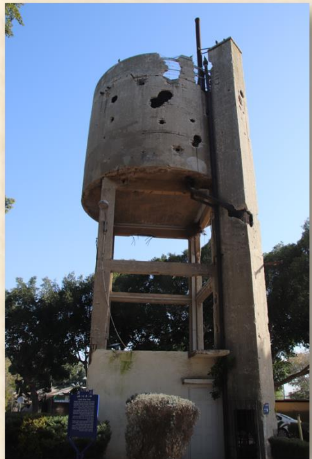
מגדל המים המחורר בנגבה, שומר ושוקם ע"י המועצה לשימור: עפר יוגב

יקירי, היום יכולתי לנוח קצת, כי היום - יום שקט יותר, ואוכל לספר לכם פרטים רבים יותר על הרפתקאותינו האחרונות. ביום חמישי, בנגבה, התחלנו להתכונן ליום קרבות נוסף. המשכנו לשפר את העמדות ואת הבונקרים. היום היה התור שלי לעלות אל המגדל ולצפות מסביב שלוש שעות ביום ושלוש - בלילה, אך בערב הוזעקנו להלחם בגבעות עיבדיס. רגע לפני יציאתנו נודע לי כי חברי הרומני, שביקר אצלנו בבית בעבר, נפצע. אינני יודע לאן העבירו אותו, איני יודע עד כמה חמורה פציעתו. גם אין לי דרך לגלות אם הוא חי עדיין.