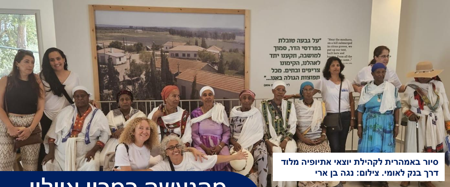
סיור באמהרית לקהילת יוצאי אתיופיה מלוד דרך בנק לאומי.