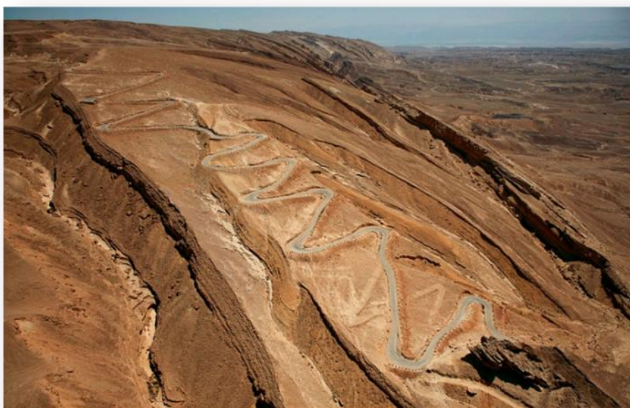
סרפנטינות מעלה עקרבים