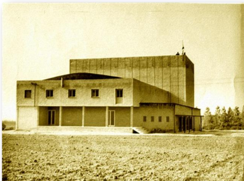
1964: הכניסה הראשית לבית העם – חזית מזרחית : ארכיון ביצרון

בשעתו גרו 500 איש) והיא זוכרת שבכל סרט, הצגה או הופעה לפחות 400 מושבים היו תפוסים בתושבי ביצרון, תושבי מושבים שכנים וגם בחיילים שהגיעו מבסיס חיל האוויר הסמוך. "לא הייתה אז טלוויזיה וכולם הלכו לסרט". חוץ מסרטים הופיעו על במת האולם אמנים כמו להקת הנח"ל, שלישיית גשר הירקון, הגשש החיוור, מירי אלוני, שייקה אופיר וגם יוסי בנאי.