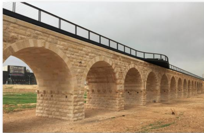
2017 - גשר הרכבת הטורקי כגשר הליכה