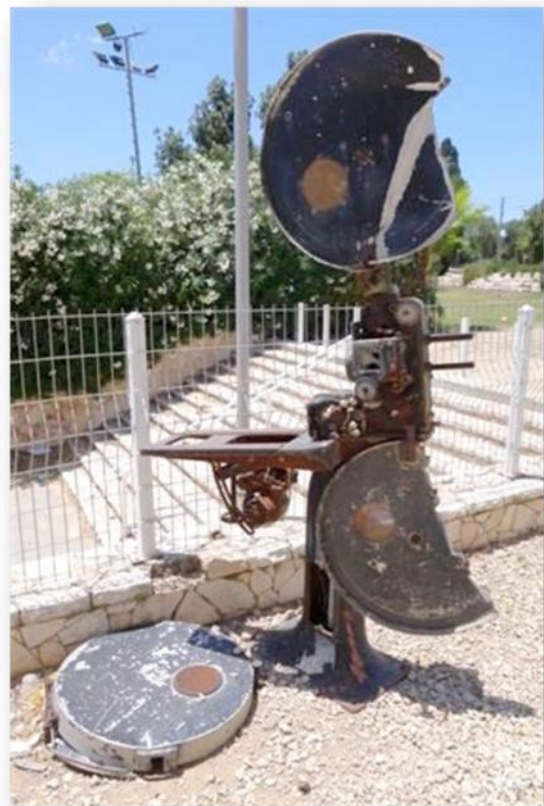
הוצאת המקרן לרחבה הובילה להריסתו: מיכאל יעקובסון

מתוך הבלוג חלון אחורי - אדר' מיכאל יעקובסון