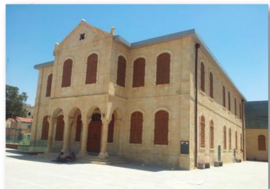
2017 - פארק קרסו למדע בית החולים הטורקי