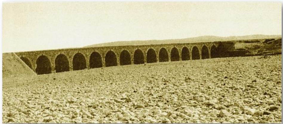
הגשר הטורקי עם סיום בנייתו 1916: ארכיון טוביהו

הפועלים אשר חיו בתנאי תברואה ירודים, נפלו ומתו תוך כדי עבודה מבלי שהשלטון הטורקי יעשה דבר. מכובדים טורקיים, אנשי צבא או ראשי שבטים בדווים שחלו, אושפזו בבית החולים שניפתח בעיר (היום מוזיאון המדע לילדים קראסו בעיר העתיקה) והופעל בסיוע יחידת