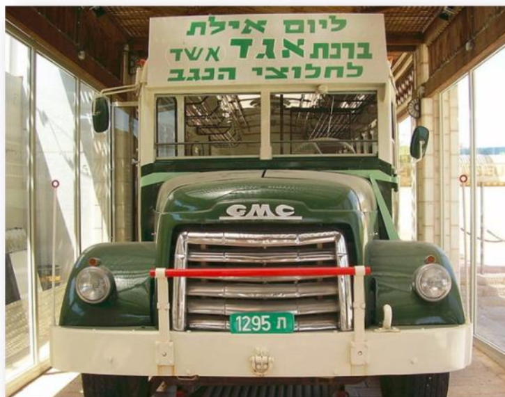
אוטובוס GMC משוחרר כדוגמת האוטובוס שהותקף במעלה עקרבים נמצא במוזיאון אילת

מצבו ההנדסי והבטיחותי של הכביש, אשר מלכתחילה נסלל בסטנדרטים ירודים ביותר, הלך והדרדר במהלך השנים בגלל מצב תחזוקה ירוד, עד אשר בשנים האחרונות נסגר בחלקו על-ידי משרד התחבורה והוכרז כ"כביש ללא אבא".