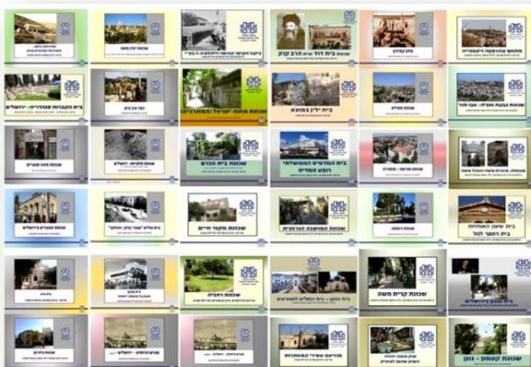
מצגות "תרבות יום א"

ש- איך אתה מנחיל את מורשת השימור לציבור הרחב?