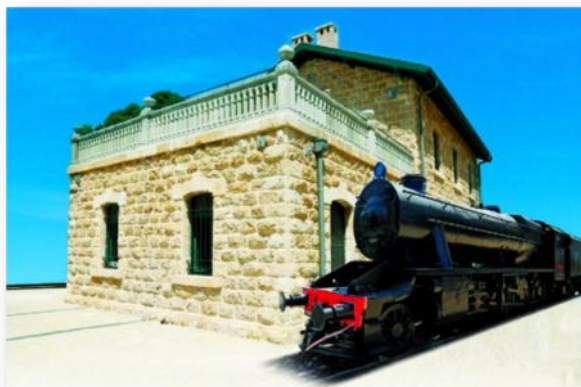
2017 - מתחם הקטר בתחנת הרכבת הטורקית: מנהלת העיר העתיקה