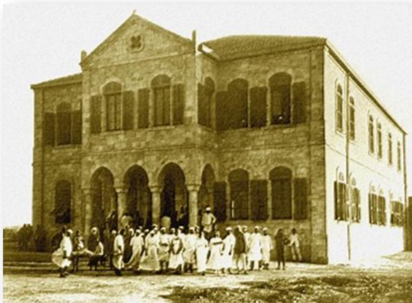
בית החולים למגפות החולירע וטיפוס הבהרות: ארכיון טוביהו

עם פרוץ מלחמת העולם הראשונה החלו הטורקים בהרחבת מסילת הרכבת מבאר שבע דרומה, הרחבה שכללה הקמת גשר רכבת והמשך סלילת המסילה לכיוון סיני וזאת כחלק מהתכנית האסטרטגית לכיבוש מצרים שהייתה אז תחת השפעה בריטית. בהנחת המסילה מכיוון ירושלים דרומה הוחל בשנת 1915 ותוך שנה הגיעה המסילה עד לבאר שבע. בניית הגשר הייתה – כאמור – חלק מהתכנית הגדולה. היותה של תחנת באר שבע התחנה האחרונה, והשבתתה של הרכבת בגלל המלחמה, הובילה לכך שקרונות רכבת רבים עמדו על המסילה ללא שימוש. בסיועם