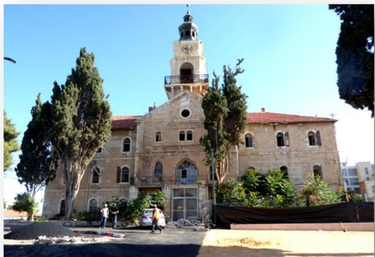
מגדל הפעמון בבית היתומים שהקים יוהאן לודוויג שנלר, לימים מחנה שנלר

בירושלים קיימת למועצה לשימור וועדה ציבורית. יו"ר הוועדה הוא לוליק ישראל ממכון ירושלים. הוועדה מונה 60 חברים ומתוכם 30% אדריכלים ובעלי עניין בשימור. הוועדה מתכנסת רק לצורך מתן פתרון - כדוגמה: הקמת בניין הפירמידה בעיר או הצגת תכנית שימור במתחם מסוים. חלק מחברי הוועדה הציבורית יושבים כמשקיפים בוועדת השימור העירונית בהצגת תכניות וכו'.