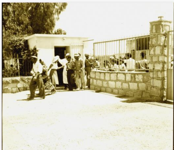
שער בית החולים הדסה (כיום רחוב ההסתדרות)