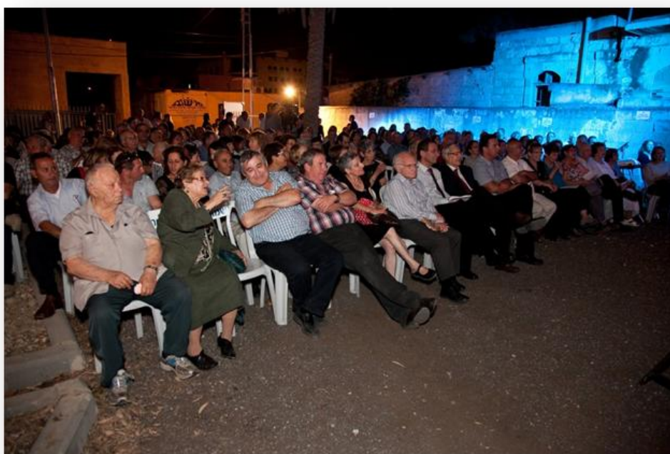
קהל החוגגים במתחם בית החולים