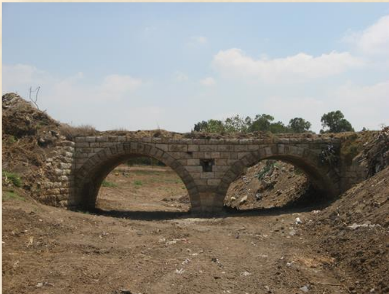
גשר רכבת עותמנית על נחל האלה (קריית מלאכי) בתואי א-תינה (כפר מנחם) בית חנון