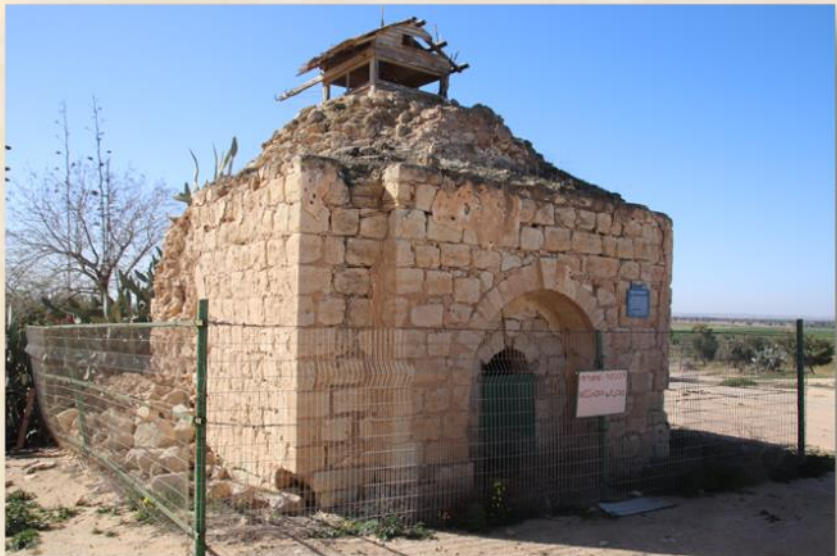
שיחי' (נבי) נוראן (קיבוץ מגן): עפר יוגב