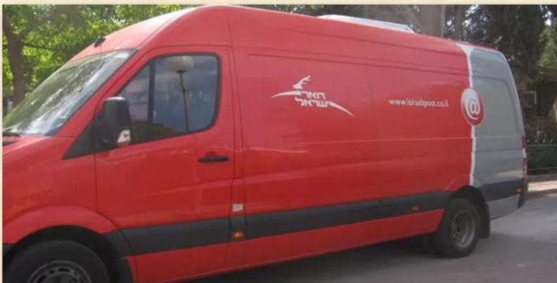
מכונית דואר נע בימים אלה: אתר קיבוץ שריד

היה זה ירחון מכובד שראשית הופעתו היתה בשנת 1952 והוא שרד שנים אחדות ברציפות והפך לדו-ירחון לפני שגווע סופית. הועלו בו נושאים חשובים ומעניינים שנכתבו בידי יודעי-דבר, לדוגמה, גיליון 11-12 מכרך 4 (פברואר-מרץ 1956) פָּלַל את המאמרים כדלהלן: "הדואר בימי קדם", "פלאי עידן הטלפון" (!), "על בולים ואוספים", "הדואר בספרות", "הדואר בפורטוגל", "מקצווי-עולם", וכמובן – עמוד לילדים ומכתבים לעורך. לכל הדעות – תוכן מכובד ביותר.