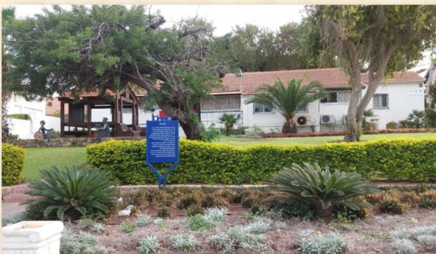
בית עלי, פשטות הגינות 2016 - ד"ר אבי ששון

ב-22 ביולי 1961 נחנכה הספרייה החדשה ברחוב הנשיא, שנקראה על שמו של עלי בן-צבי. חנוכת "ספריית בית עלי" נערכה במעמד נשיא המדינה ומשפחת בן-צבי המורחבת, כולל בתיה לישנסקי (אחותה של רחל ינאית ודודתם של עמרם ועלי). יצחק בן-צבי נפטר בשנת 1963 ובהתאם לצוואתו עבר ביתו, שנקרא "בית עלי", לתושבי אשקלון והמעון הפך למרכז פדגוגי למורים ואחת הפינות שבו הוקדשה כאתר זיכרון צנוע