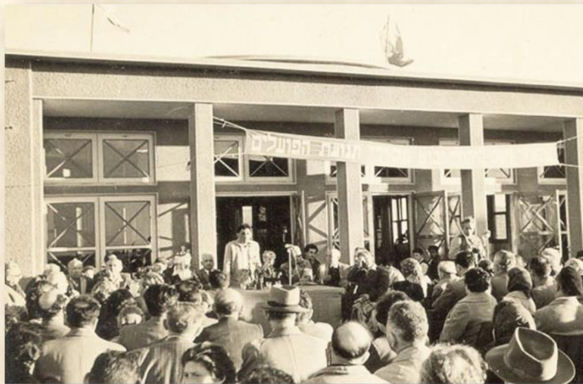
חנוכת בית בורוכוב

תכנון בתי תרבות ובשנת 1945 כתב על תכנון היישוב הקיבוצי).