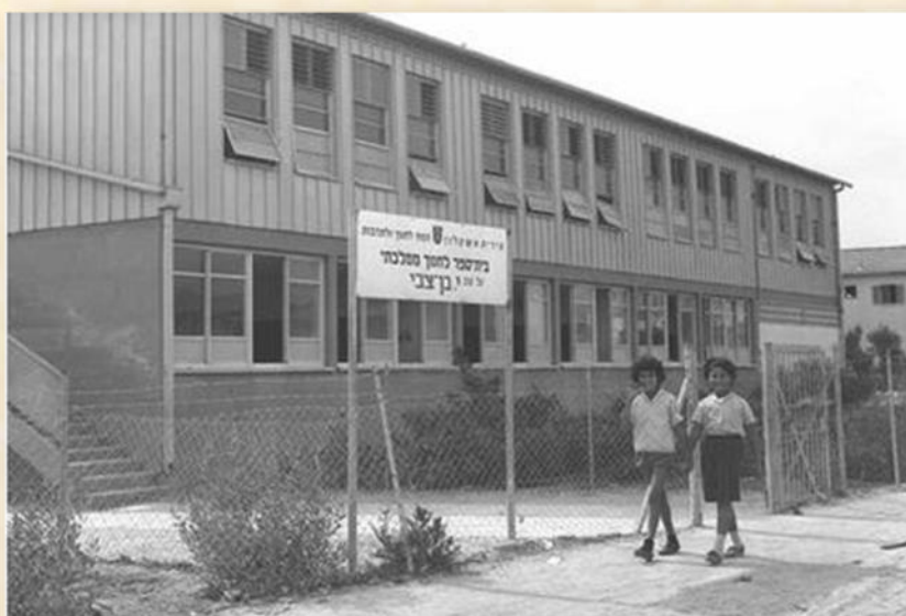
בית ספר ממלכתי בן צבי אשקלון 1964