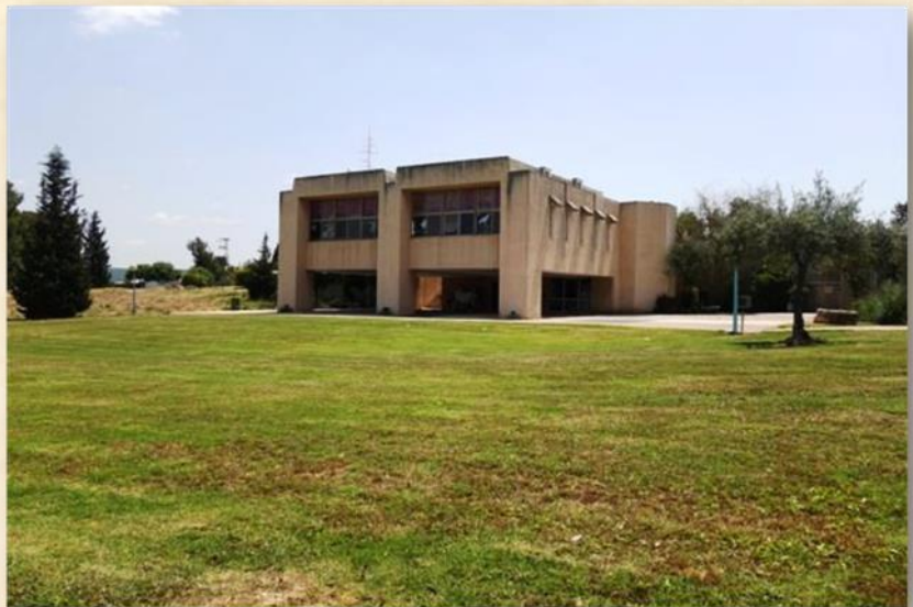
מבנה חדר האוכל: אדר' מיכאל יעקובסון

תשומת לב וחיוב העניק האדריכל שמואל מסטצ'קין לרחבה החיצונית לחדר האוכל. "החל משביל הכניסה לחדר האוכל, השתדלתי ליצור תחושה שאתה נכנס למבנה ציבורי המחייב התנהגות מסוימת", כתב מסטצ'קין בטקסט קצר שתיאר חדר אוכל אחר שתכנן באותה תקופה שבה תכנן את חדר האוכל בבית ניר. "הכניסה לחדר האוכל אינה ישר מהשביל, כי אם דרך חצר מרוצפת המכניחה את החבר לכניסתו". בשונה מחדרי האוכל שנהג מסטצ'קין לתכנן באותן שנים והתאפיינו בשימוש בקשתות שהופיעו בחזית, החזיתות והפתחים