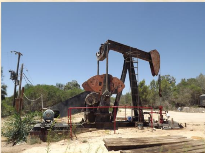
חרגול שאיבת נפט פעיל - עפר יוגב

בשנת 1967- לאחר מלחמת ששת-הימים, נעזב השטח עקב שדות הנפט העשירים באבו-רודס וראס-סודר. בשנת 1972- נעשה סקר חדש, אך נפלה החלטה ממשלתית שלא לפתח את השדה. בשנת 1974 הופרטה החברה על- ידי ועדת-סלמן וחולקה לשתיים: ח.נ.ה. - חיפוש-נפט, ולפידות- הפקת נפט (החברה נמכרה ללוקסנבורג ועוד). בשנת 2016 הסתיים הזיכיון של 50 שנה, ואחרי שנה - חודש לתקופה של 50 שנה נוספות. בעקבות חידוש הרישיון- נחפרה באר חדשה והיא מפיקה מאות חביות-נפט ביום.