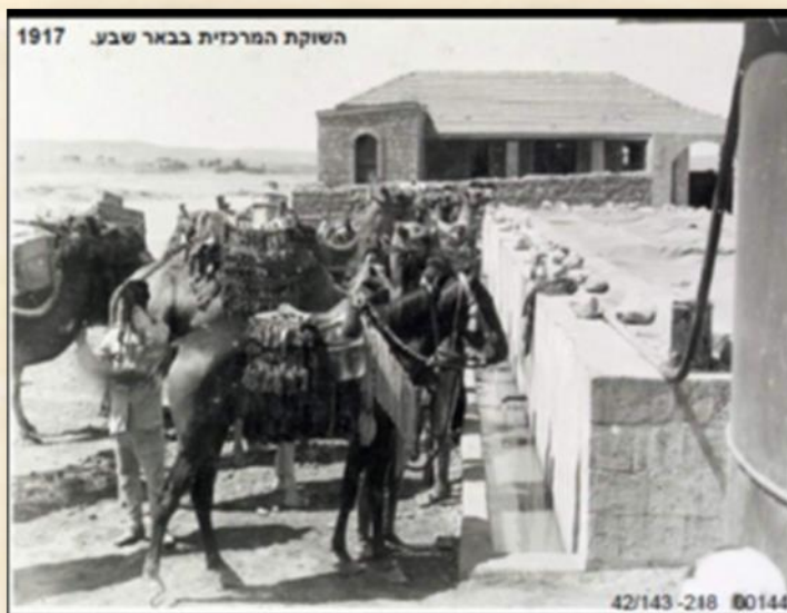
בית הבאר ושקתות להשקיית הסוסים של הצבא התורכי: באר שבע ואתריה- גדעון ביגר ואלי שילר

"המושל הטורקי (עלי אכרם בק) הקים מבנה על הבאר העתיקה בשנת 1906 והתקין משאבה שהעלתה את מימיה לבריכת אגירה ליד הסראיה. משם הוזרמו המים לבתי העיר בצינורות, בכך זכתה עיירת המדבר הקטנה לשכלול זה, זמן רב לפני ערים גדולות וחשובות יותר כמו ירושלים או יפו. הבנין כלל גם טחנת קמח ממשלתית ודלת הכניסה הגבוהה בחזית אפשרה את הובלת החיטה עד המבנה ובו הבאר המערבית, בריכת המים והשוקת המרכזית. בזמנו הגג של המבנה היה מרעפים ובמבנה פעלה טחנת קמח של הממשל הטורקי".