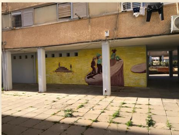
ציורי הילדים: אורן עמית

אורן עמית - מנהל המרכז לאמנות עכשווית ערד