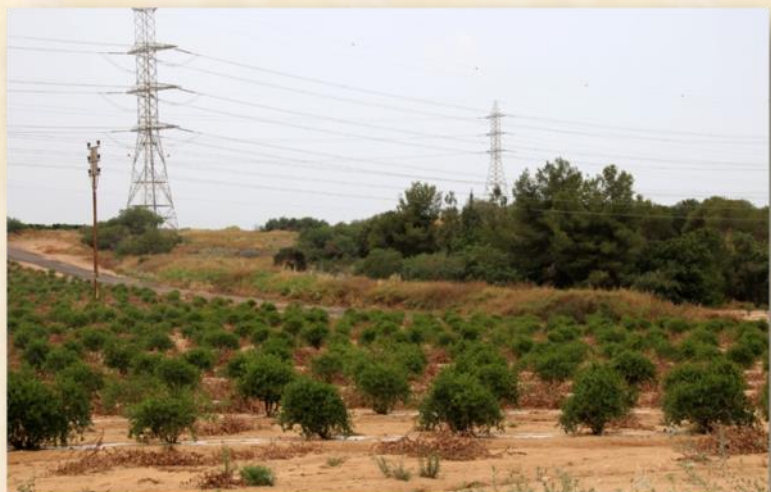
שרידי הסוללה משואות יצחק