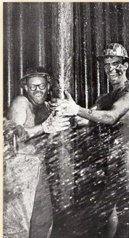
נפט פורץ בחלץ 1955 - ויקיפדיה

בשטח יש ריכוז מוטות מקדחים וראשי קידוח בעלי מבנה המיוחד לכל סלע (שיניים גדולות לסלע רך, שיניים קטנות לסלע קשה).