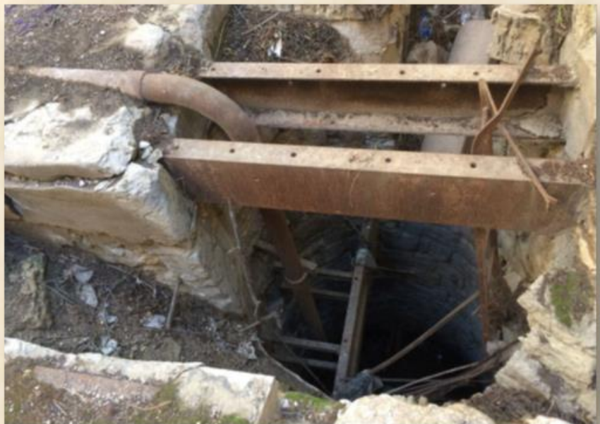
פתח הבאר : שלמה ציזר