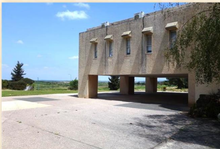
חדר האוכל מבט צד: אדר' מיכאל יעקובסון