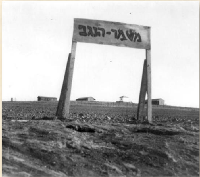
משמר הנגב 1948: ארכיון תמונות הפלמ"ח צילום, ברוך שפיר

שלושת הקיבוצים: רביבים, משמר הנגב ומשאבי שדה השתייכו לתנועת הקיבוץ המאוחד (היום התק"ם). נושא התכנון והבניה נוהל במשותף ממזכירות הקיבוץ המאוחד בתל אביב, על-ידי מחלקת התכנון (היום חברת א.ב. תכנון) ומפעל הבניה (קבוצה קבלנית שביצעה את רוב עבודות הבניה בקיבוצים). במחלקת התכנון היו מספר אדריכלים ומהנדסים ובניהם אדריכל שמואל ביקלס (1909-1975), שהיה ממונה על תכניות האב של שישים קיבוצים בכל הארץ, בהם גם כל ישובי הקיבוץ המאוחד בנגב, ברוב הישובים ששמואל ביקלס תכנן הוא קיבל מנדט לתכנן חלק ממבני הציבור, החינוך, המגורים והמשק כדוגמת בית תרבות "בית בורוכוב" בקיבוץ משמר הנגב.