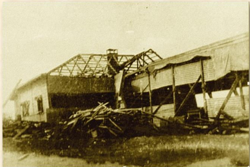
יולי 1948 חדר האוכל ההרוס לאחר הפצצה במלחמת העצמאות: ארכיון דורות

"יש לנו בכל הימים ארוחת צהריים, ארוחת ערב בששי בערב וכיום משווק המטבח גם אוכל החוצה. לא בכל הקיבוצים זה קיים", מספרת בגאווה על פעילות חדר האוכל עירית בדולח ילידת וחברת דורות. בכך מרמזת בדולח על ההצלחה לעמוד בפני התלאות שנלוו לשינויים שהביאו עמם תהליכי ההפרטה. "ב-2006 הקיבוץ עבר שינוי אבל את האוכל הפרטנו כבר בשנות ה-90. ארוחת הערב האחרונה היתה ב-1996. בזמנו היו אוכלים בשבת שלוש ארוחות, אך עם הפרטת המזון, צמצם חדר האוכל את פעילותו".