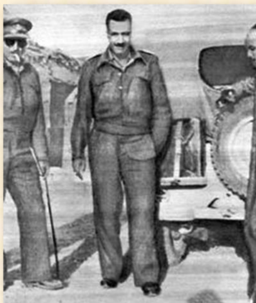
נאצר בכיס פלוגיה עם אנשי המטה שלו דצמבר 1948: אתר קיבוץ גת

מבוסס על יומנו האישי של נאצר שבו הוא כתב כמעט בכל יום במלחמה ותיאר את שראו עיניו ומעשיו מולנו במלחמת השחרור; ועל כן, היומן נטול תעמולה נגדנו, כפי שהיינו רגילים לשמוע ממנו כשהיה מנהיג מדינות ערב שנים לאחר מכן, וכך אפשר גם להעריך את מחשבותיו האמיתיות. היומן היה גנוז בביתו במשך חמישים וחמש שנים.