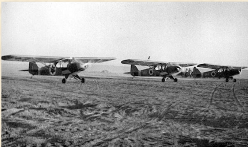
מטוסי הטייסת בגבת, בתקופת מבצע יואב

"מבצע 10 המכות" שהוחלף בשם "מבצע יואב" ("יואב" היה הכינוי של יצחק דובנו, מפקד נגבה, שנהרג בהפצצת מטוס מצרי את הקבוץ), נועד לסלק את הצבא המצרי, שתפס את הכביש בין מגידל (אשקלון) לבית-גוברין וחברון (כביש 35 היום), ובכך ניתק את הנגב ממדינת ישראל. מצפון לכוח המצרי בקו נגבה-גת-גלאון, היו חטיבת גבעתי וכוחות מחטיבה 8 "המשורינת". מדרום לכוח המצרי, בקו גברעם-חוליקאת-חירבת מאחז (צפון-מזרח לבית-קמה), היו חטיבת הנגב וחטיבת יפתח "הצפונית" שבאה לעזרה וכוח מחטיבת עודד. הכביש היחידי שחיבר בין הצפון לנגב מצומת הודיה- לברור חיל (232), היה מנותק בצומת גבעתי-כאוכבה (כוכב מיכאל). דרך עפר (כביש 40 היום) מקסטינה לחירבת מאחז, היתה מנותקת באזור העיירה פלוג'ה (צומת פלוגות) -ועיראק אל מנשייה (קרית-גת). בניסיון לסלק את הצבא המצרי (חטיבה 4) בפיקודם של "הנמר הסודני" בריגדיר סייד טאהא ביי הסודני וסגנו (קצין המודיעין) ג'מאל עבד-א-נאצר, נעשו מספר מבצעים צבאיים תחת השם הכללי "מבצע-יואב" בתאריכים 15-22/10/1948.