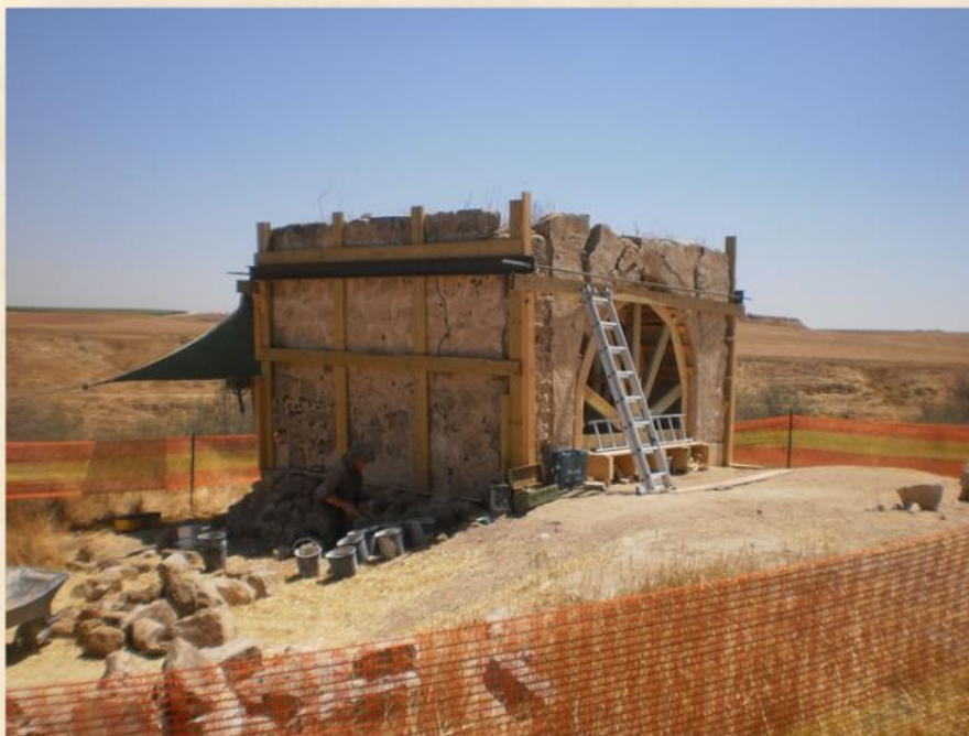
באר אבו באכרה בשיקום : מאיר רונן