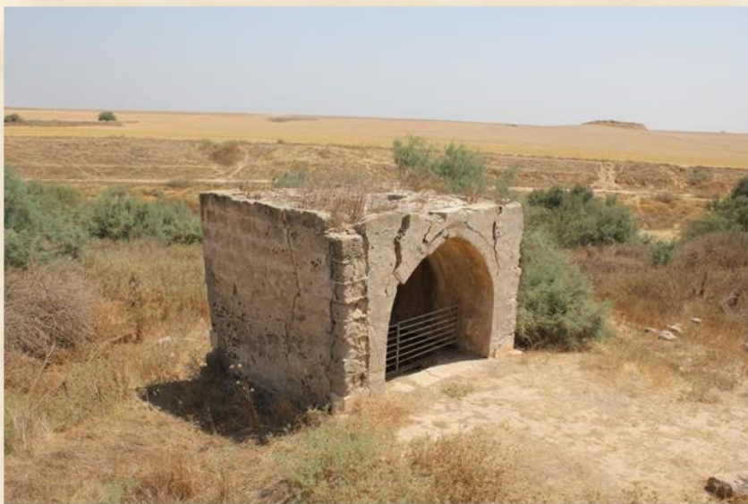
באר אבו באכרה לפני השיקום - מאיר רונן

הבאר הזאת היא אחת מעשרות בארות שופצו, בתכנית רעיונית אחידה, בסביבת שנת ה-30 במאה הקודמת לרווחת הבדווים בצפון הנגב (וראו, לדוגמה, את באר רבובה!) ולטובת המשפץ (השלטון המנדטורי הבריטי) כדי להקל עליו במעקב אחרי תזוזותיהם של הנוודים; בחלק נכבד מן הבארות נותרו חרוטות על הטיח הלח הכוללות, לעיתים, פסוקים מהקוראן ובעיקר – וזה חשוב – שם הקבלן ותאריך ביצוע מבנה