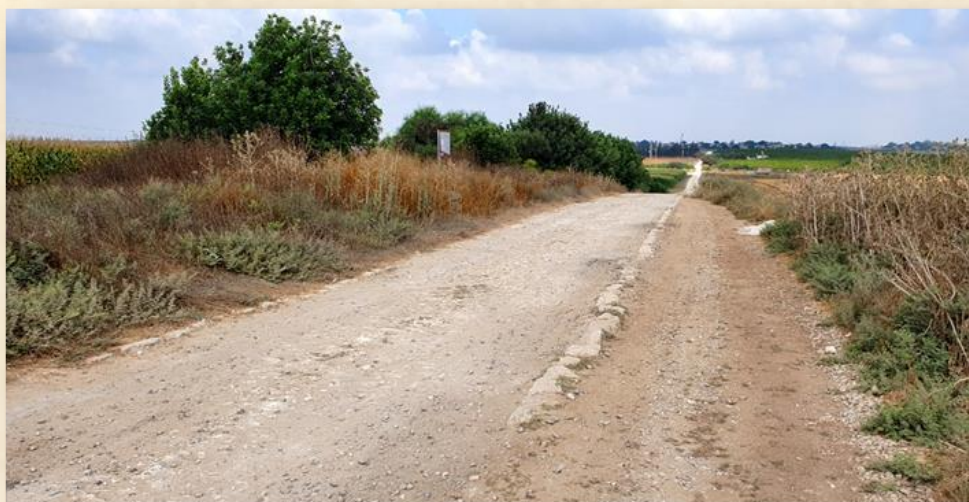
דרך סולינג בין כפר מנחם לכפר הריף כחלק מהדרך ממסמיה: עפר יוגב