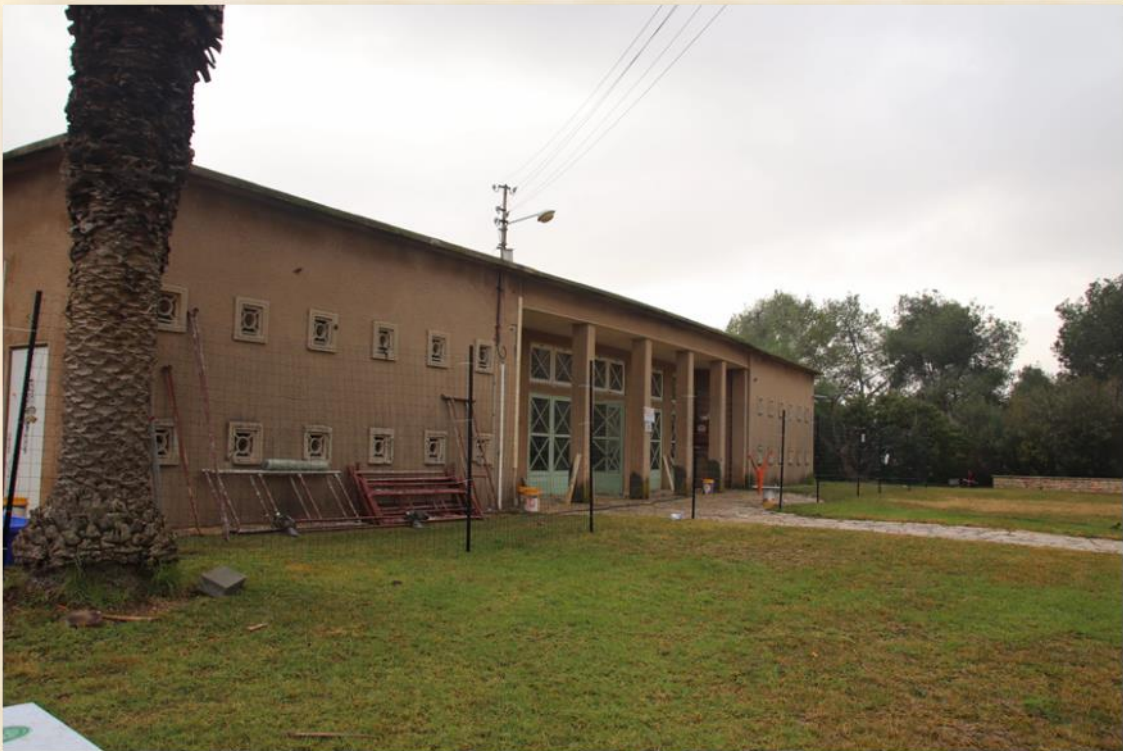
בית בורוכוב בעבודות השימור: עפר יוגב

גיליון מס' 28 י"ט ניסן תש"ף, 13 באפריל 2020