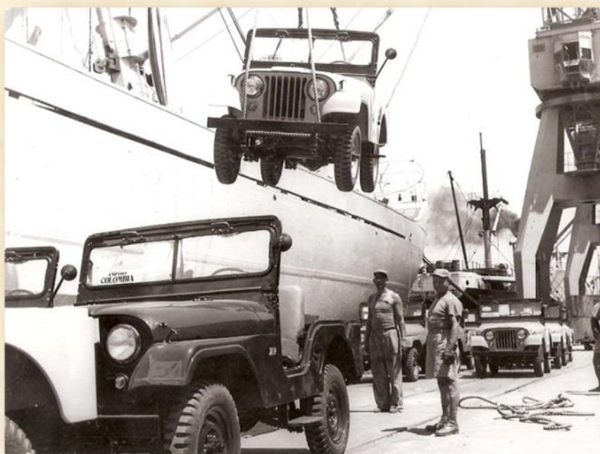
יצוא ג'יפים וויליס

בשנת 1967 המפעל נמכר ונותרו בו 80 איש שהיו לגרעין שהפעיל את "עשות" תחת ניהול התעשייה הצבאית. למנכ"ל מונה עזרא יסודי ז"ל, שניהל את המפעל עד מותו ב-1990. נמשך ייצור מחרטות הריסון וסוקומו שיועדו לבתי הספר המקצועיים עד 1972/3. ב-1968 הייתה "עשות" אחד ממפעלי התעשייה הראשונים בארץ שנכנסה לעידן העבודה עם מכונות בקרה ספרתית. CNC-בשנים 1970-1969 הלך והתמחה המפעל בייצור צבאי: קטיושות, חלקי מתכת עבור פצצות חודרי מסלולים שהיו בשימוש חיל האוויר, ומיזמים שהכניסו את המפעל לתחום תעשיית המטוסים, כמו רכיבים להתאמת מטוס הסקייהוק לחיל