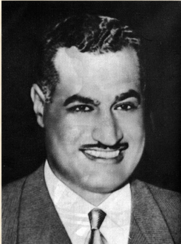
גמאל עבד אל נאצר: ויקיפדיה