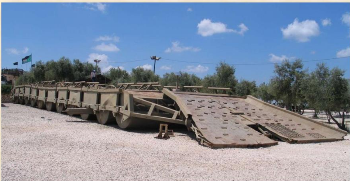
גשר הגלילים