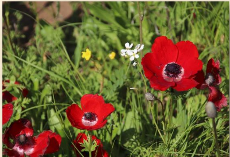
פרידה מהירוק ומהכלניות: עפר יוגב

בריאות ולימים טובים חג אביב שמח עד כאן לקט פאה ושכחה יוגב עפר מנהל המחוז