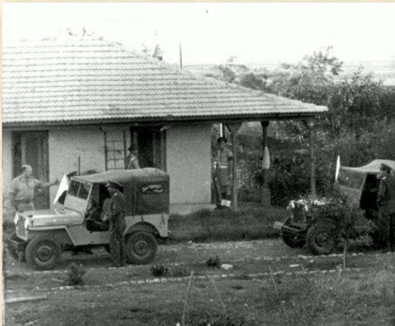
בית נאצר בגת. ליד הגיפ הימני עומד נאצר. זו התמונה היחידה מביקורו בגת. כל שאר התמונות המפורסמות הן מיום פינוי הכיס ומפגישה שנערכה בעירק סואידן: שביט לב

וקישטו את הקיבוץ וגם תמונתו של שמש העמים סטאלין הייתה תלויה על הקיר. הוא נזכר בקולות השירים והריקודים ששמע במרומי התל ולא הבין את פשרם. "הם חגגו את מהפכת אוקטובר בשבעה בנובמבר כמובן". בעודו מהרהר בדבר ועושה את דרכו עם מפקדו לגיפ, שם לב לסדר ולניקיון מסביב ולא ראה זכר למלחמה המתחוללת בין ההתיישבות היהודית לכוחותיו. הקצינים המצריים נפרדו לשלום בחמימות ובלחיצות-יד מירוחם כהן ושלום פינצי מארחיהם ועשו דרכם לשער הקיבוץ.