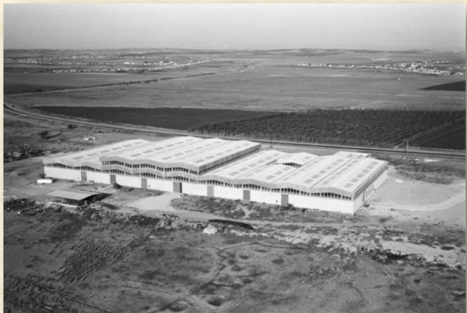
22685 קייזר איילין אשקלון: רמי ערב ארכיון שיכון ובינוי

מדינת ישראל חבה לאפרים אילין חוב גדול, בזכות תרומתו יוצאת הדופן בפעילותו בתנועת בית"ר ובפעילות ההגנה והעפלה של ארגון האצ"ל. במלחמת העצמאות לקח אילין חלק מרכזי ברכישת נשק מצ'כוסלובקיה. הוא מימן מכספו את אוניית הנשק 'נורה', שפרקה את מטען הנשק הצ'כי שלה בתל אביב ב-3 באפריל 1948. בלעדי רכש זה לא היו מגיעים לארץ אלפי הרובים לפריצת המצור על ירושלים במבצע נחשון. כן סייע בהבאתן של שלוש אוניות נוספות שתרמו רבות להצטיידות צה"ל הצעיר. בקשריו הצליח לאפשר העלאת כ-150,000 מיהודי רומניה. הוא רכש בכספו מטוסי קרב ראשונים והעבירם דרך יוגוסלביה, ואף היה מעורב ברכש מטוסי המיסטר 4 הראשונים מצרפת.