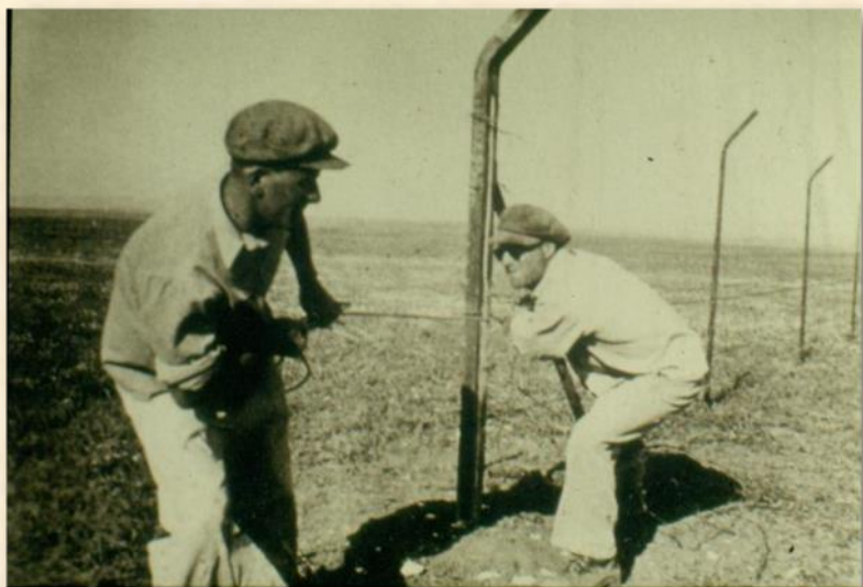
הקמת גדר הקיבוץ 1942 : אתר קיבוץ גת

הקיבוץ עלה על הקרקע בעקבות השלושה. בשנת 1943 הגיעה לקיבוץ משלחת של הנהגת הישוב שכללה את משה שרת ואליהו גולומב וקראה לאנשים להצטרף לצבא הבריטי ולצנוח מעבר לקווי האויב כדי לעזור ליהודים באירופה הכבושה. מתוך שלושים ושבעה הצנחנים שהצטרפו לצבא הבריטי באותה התקופה - שניים היו מגת, שלום פינצי ואלי זוהר.