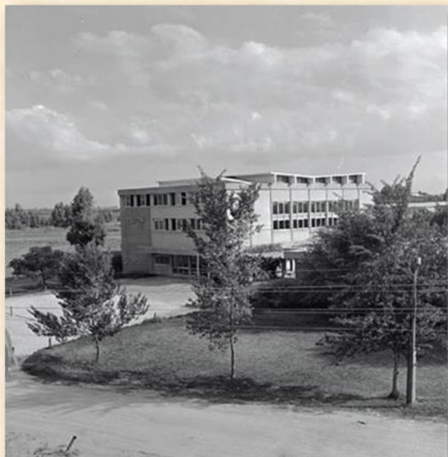
בניין הישיבה תשכ"ח 1968

ישיבת "אור-עציון" על מוסדותיה ובוגריה, מהווה הנצחה משמעותית ליישובי גוש-עציון שחרבו ביום הקמת המדינה וקמו מחדש כשנה אחר-כך בבקעת שפיר והכרמל. השפעת הישיבה על האזור היא משמעותית, הודות לאישיותו ופועלו רב-השנים של הרב חיים דרוקמן.