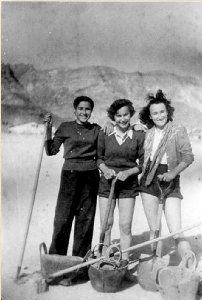
שלוש נערות גדנ"ע מהמחזור הראשון בבאר אורה, סוללת את דרך הסולינג למחנה: באדיבות אביבה שוקולנדר