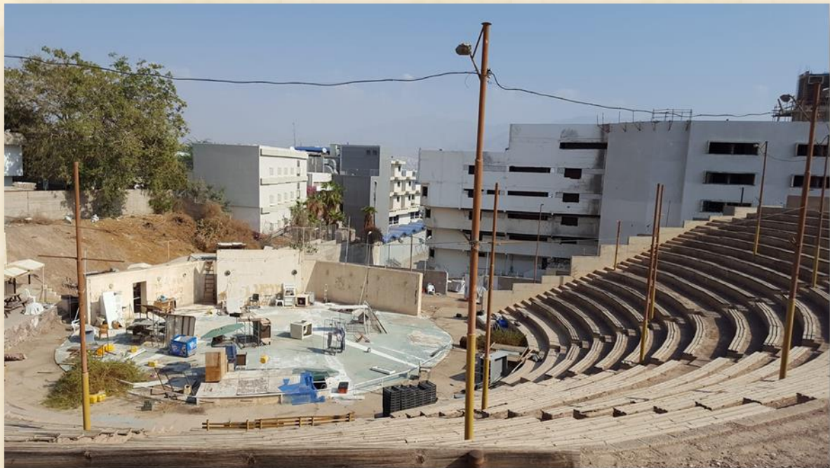
האמפיתיאטרון 2019: אלון