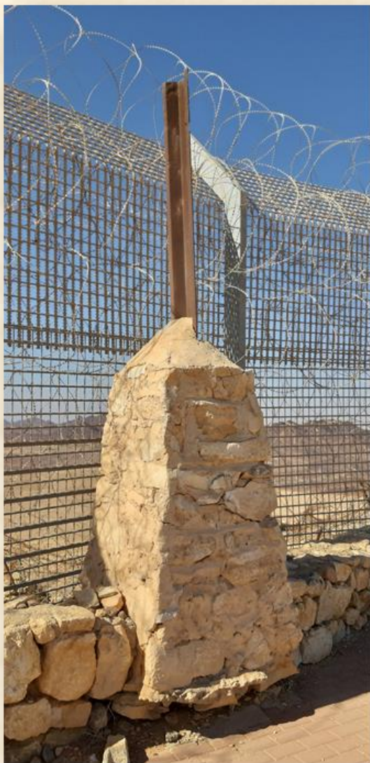
עמוד גבול בין פלשתינה למצריים מ 1906 לא נגיש לציבור עדיין: גדעון רגולסקי

הכביש נסלל במרכז הנגב אחרי האסון במעלה העקרבים. מ1954 עד 1957. בסלילת הכביש התגברו על כמה מעלות קשים שחייבו ידע בהנדסה ואף תעוזה. בכניסה למכתש רמון, מעלה העצמאות. במעבר מדרום לנחל פארן. בהר עיט בחיבור לצומת קטורה.