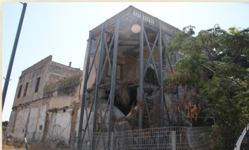
חזיתו הפגועה של בית האמידים

ביום ראשון, 26.12.2021, החלה עיריית אשקלון בשיתוף המועצה לשימור אתרי מורשת בישראל בעבודות ראשוניות במבנה ההיסטורי "בית האמידים". המבנה המיתולוגי יעבור שימור ושיקום ויהפוך למוקד תיירותי הפתוח למבקרים, ויצטרף להיסטוריה ארוכת השנים הטמונה ברחבי העיר אשקלון.