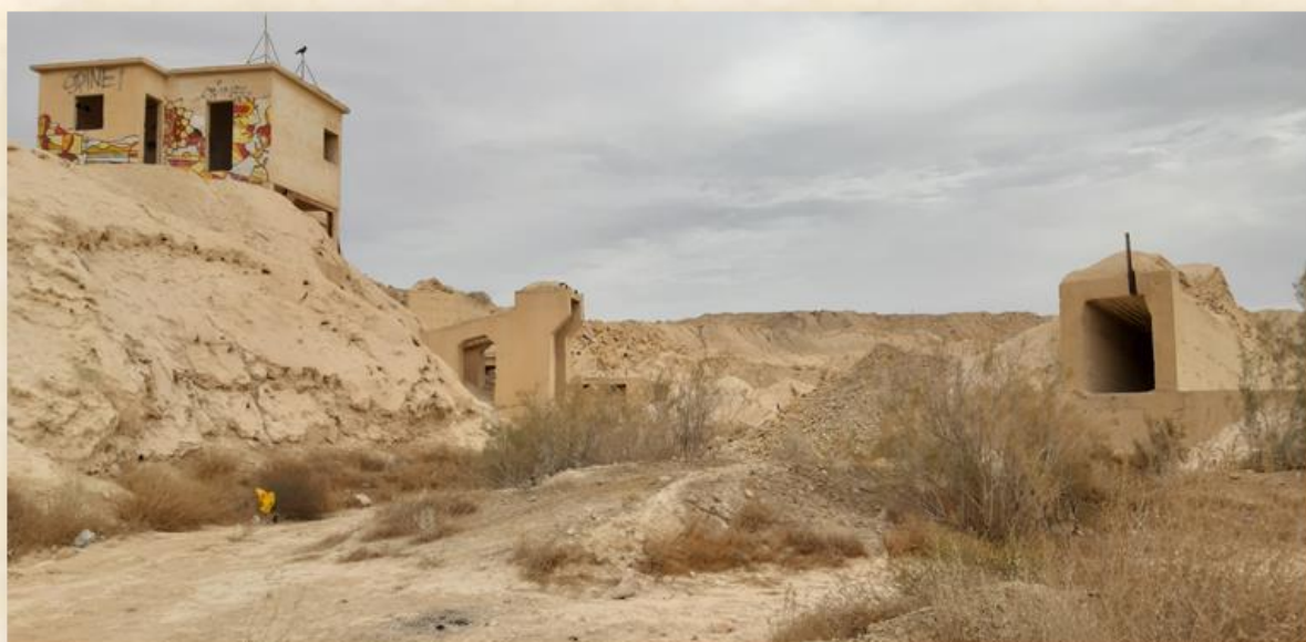
מתקני מחצבת תמר שהוקמה במהלך סלילת הכביש לסדום: גדעון רגולסקי

הכותב הינו עוזר למנהלת מחוז דרום וממונה על אזור הערבה