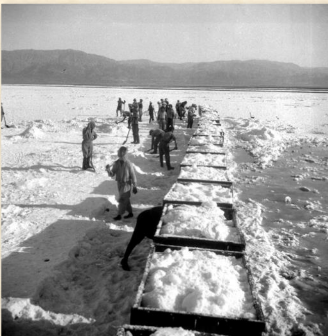
הטעת קרנליט מהברכות לקרונות רכבת

המחנה העיקרי של חברת האשלג הוקם בחוף הצפוני של ים המלח, עוד בטרם קבלת הזיכיון (1930) ותוכנן בתשומת-לב רבה על ידי אחד האדריכלים הנודעים של התקופה, האדריכל היהודי-גרמני ריכארד קאופמן.