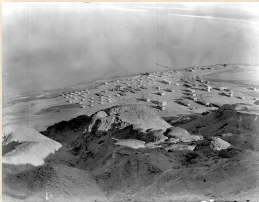
מחנה העובדים סדום מהר סדום