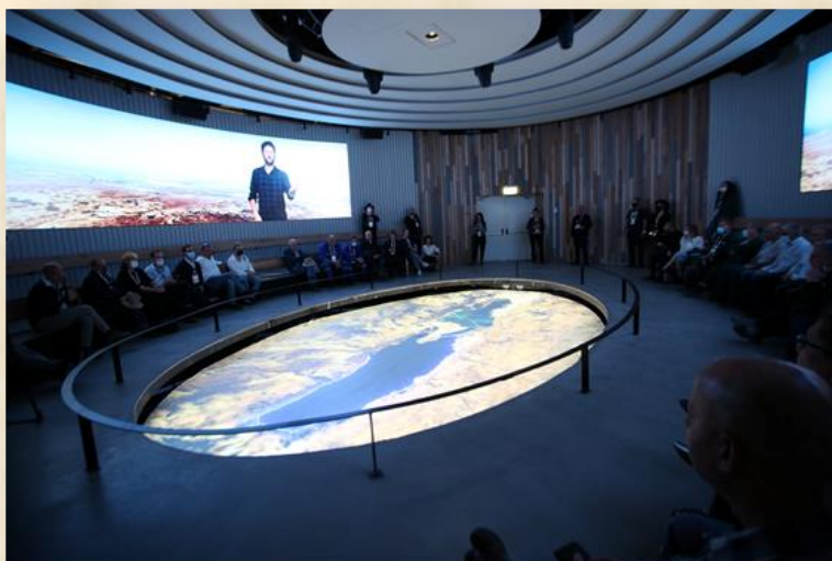
המחשת סיפור בקע ים המלח באתר המבקרים: ארז קמה

אין ספק, שמרכז המבקרים על-שם משה נובומייסקי יוכח כאחד ממרכזי המבקרים החשובים בארץ. יהא זה המעט עבור זכרו של משה נובומייסקי, אשר מדינת ישראל הפנתה לו עורף לאחר הקמתה ושמו, כאחד מגדולי התעשיינים בארץ, נשכח.