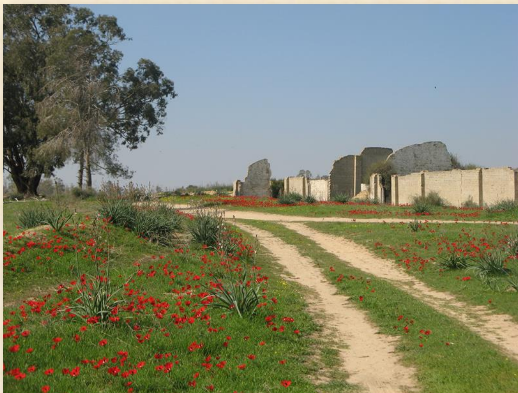
שרידי מבני שירות באזור מחסני התחמושת בתקופת דרום אדום : עפר יוגב