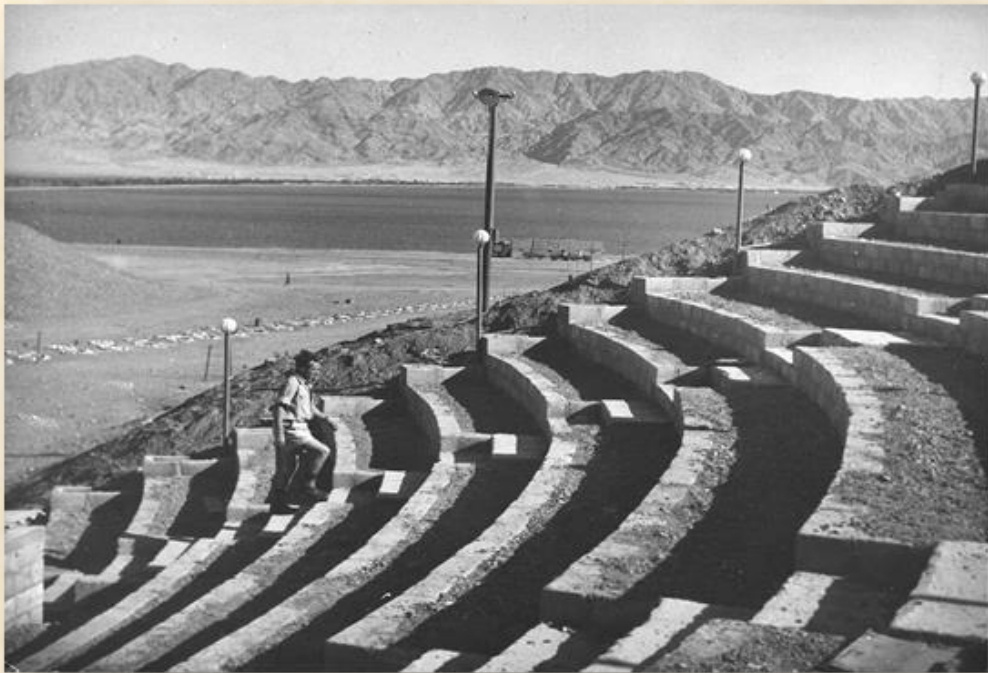
האמפיתיאטרון העירוני 1966 : הסוכנות היהודית

הכותב הינו נאמן שימור אילת וחבר ועדת השימור העירונית