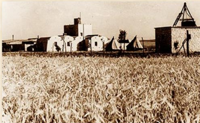
מצפה בית אשל: אתר רגעים היסטורים

בסתיו 1947, ניתן היה לסכם את שלוש העונות החקלאיות. המתיישבים בחנו, בדקו וניסו את אופן ניצול המשקעים והשיטפונות; את עומק החריש הרצוי ושיטות עיבוד קרקע נוספות; התאימו את זני הדגניים, הירקות ועצי הפרי לאקלים ולקרקע תוך למידה בלתי פוסקת מהבדווים; ניסו שיטות לבלימת סחף קרקעי כתוצאה מהרוח ונבדקו השיטות היעילות ביותר להשמדת עשבים שוטים ומזיקים. נשאלת, אם כן, השאלה: מדוע לא אימצו מתיישיבי 11 הנקודות את השיטות שנלמדו שלוש עונות קודם לכן בשלושת המצפים? התשובה לכך מורכבת משני כיווני חשיבה. האחד, כפי שכבר ציינו, למתיישבים ב-11 הנקודות הובטח צינור מים ("קו מים") שיגיע - מיד לאחר העלייה על הקרקע - מאזור ניר עם ומשום כך לא תיווצר בעיה של מחסור במים לחקלאות אינטנסיבית. ואכן, הזרמת המים החלה באפריל 1947, כ-6 חודשים לאחר העלייה. וכיוון החשיבה השני - מיד לאחר עלייתם החלו קרבות בנגב והמתיישבים לא היו פנויים כלל לעסוק ביישום המסקנות החקלאיות שהתקבלו בשלושת המצפים. בנוסף, במידה רבה חל קרע מקצועי בין הקק"ל ומומחיה שהיססו בדבר אפשרות להקמת חקלאות באזור עסלוג' ובגבולות לבין מומחי הסוכנות (תחנת הניסיונות ברחובות ובאוניברסיטה העברית) שטענו כי ההישגים והניסיונות הוכיחו כי ניתן לקיים חקלאות רווחית במדבר. קרע מקצועי זה מנע מיישובי 11 הנקודות "ללכת בגדול" על חקלאות מדברית והם העדיפו להישאר על "הצד הבטוח" ולהקים חקלאות כפי שלמדו במרכז הארץ.