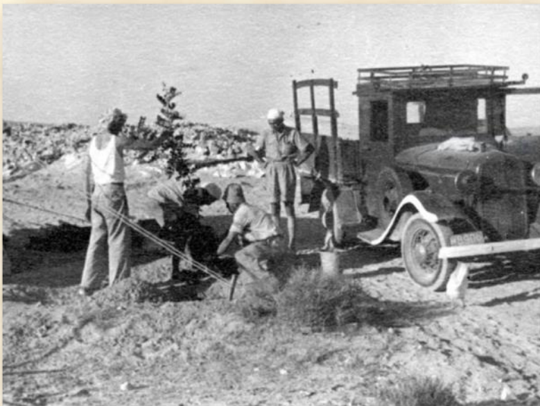
נטיעת העץ הראשון במצפה

תחילה חשבו מומחי ההתיישבות שבאזור "קעת מקבולה" (סביבת רביבים) יורד הרבה גשם משום שהפלמ"ח טייל כאן בתקופות החורף. מהר מאוד התברר שכמות המשקעים היא כמעט אפסית. זאת ועוד: אירועי הגשם באים לא ברציפות ועיתים אף בפעמיים-שלוש - ונגמר החורף. תחילה ניסו המתיישבים לחקות את שיטות העיבוד וסכירת המים של הנבאטים ואחר כך ניסו ללמוד משיטות הבדווים שמסביבם. בתום העונה החקלאית הראשונה, באפריל 1944, שלחו מתיישבי רביבים תזכיר מפורט לקק"ל ובו דרשו קיום ניסיונות חקלאיים בהתאם למה שהם נתקלו בהכת השטח וביניהם: מהי מידת החלחול של קרקע הלס, התאמת הדגניים והירקות לאזור רביבים, מהי יעילות החריש העמוק והכרעה מקצועית בדבר מועד מדויק של זריעת הדגנים - לפני הגשם הראשון או רק לאחריו.