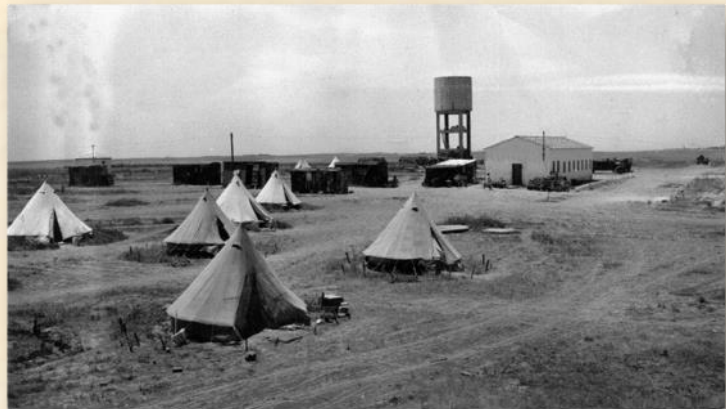
הקיבוץ מגדל המים וחדר-האוכל, אוהלים ובתי קש: מהספר 'מפקד חבר'

אחת הדילמות שאיתן היה שמעון צריך להתמודד היא בשאלת פינוי הנשים והילדים. מיד לאחר הכרזת המדינה, החלה הפגזת בארות יצחק על-ידי הצבא המצרי במטוסים ובפגזי תותחים. שמעון