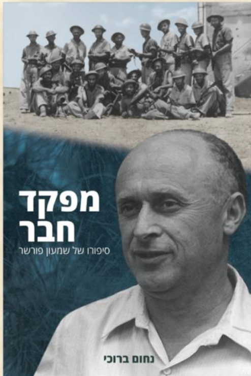
סיפורו של נחום ברוכי: יובל נבו

אחד הקיבוצים, שסיפורו פחות מוכר, הוא קיבוץ בארות יצחק ששכן מול עזה, במקום שבו שוכנים היום קיבוץ נחל עוז וקיבוץ עלומים (במקום נותר מגדל המים שהפך להיות אנדרטת זיכרון להתיישבות בנגב). קבוצת 'רמת-שומרון' שישה ליד כפר-פינס, עלתה להתיישבות בתאריך כ"ג שבט תש"ג, 28.1.1943. חלק מחברי הקבוצה היו כבר במקום כדי לחפש מים בקידוח שהעלה מים מליחים מידי. לקבוצה נמסרו כ