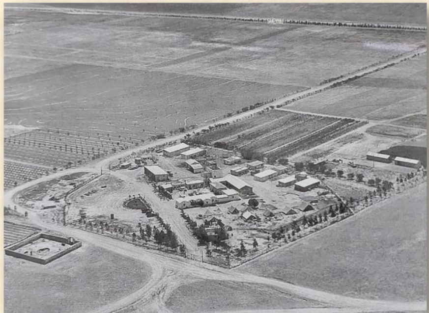
מצפה בית אשל 1947: התוך הספר בית אשל חלוצים במדבר

בית אשל קיבלה גם חזות של יישוב קבע בזכות הפעילות החקלאית הענפה בשטחי הניסיונות שהושקו במי הבאר, בין גידולי הניסיון היו מטעי האגסים והתירס וגידולי חיטה ושעורה, פיתוח ענפים כהובלה במשאיות, טרקטור 6 ומפעל לכלים מפח. במוסדות המיישבים, שבנו את היישוב בדגם המצפה (לא רק בנגב נבנו בנינים שכאלו אלא גם בגליל בשלושה יישובים: חוקוק, רמות נפתלי וביריה) - הכינו תוכנית ליישוב של קבע בדגם המושב. במקביל הכינו תוכנית לעיר עברית ליד באר שבע כמרכז ליישובי הנגב ושמה "אפיקים בנגב".