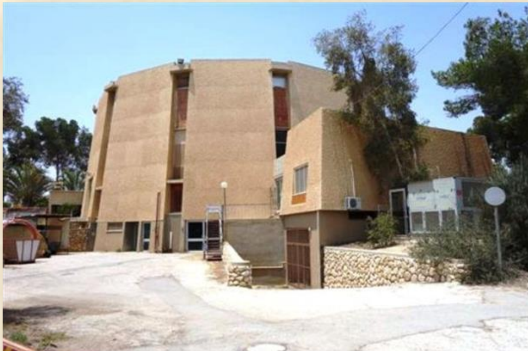
מבט על הבניין מכיוון הרחבה התפעולית שממזרח

הכותב, הינו אדריכל ובעל הבלוג 'חלון אחורי'