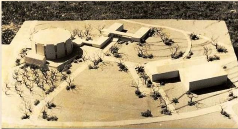
דגם המרכז של קיבוץ רביבים 1970 – מימין חדר האוכל, במרכז בית גולומב ומשמאל מרכז גולדה

סמיכות המבנים לא מנעה מביקלס להציג גישה שונה בתכלית לתכנון המבנה החדש. לעומת "בית גולומב" הצנוע במידותיו ושאפיותיו, גמיש לשינויים ומתאפיין במסות פשוטות ואופקיות, תכנן כעת ביקלס בניין מונומנטלי, גבוה וראוותני. שני הבניינים מקושרים זה לזה והופכים למתחם אחד, אך בעוד ש"בית גולומב" מתאפיין בזוויות ישרות, "מרכז גולדה" תוכנן כאולם מופעים מעוגל, המורכב מ-12 צלעות צרות. בין צלע לצלע מפריד שקע שבו שילב האדריכל חלון וחיפוי קרמיקה