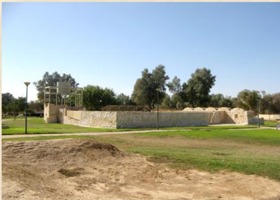
אתר מצפה בית אשל כיום: עפר יוגב

הכותב, הינו חוקר, מורה ומרצה מן החוץ לגאוגרפיה באוניברסיטת בן-גוריון בבאר שבע