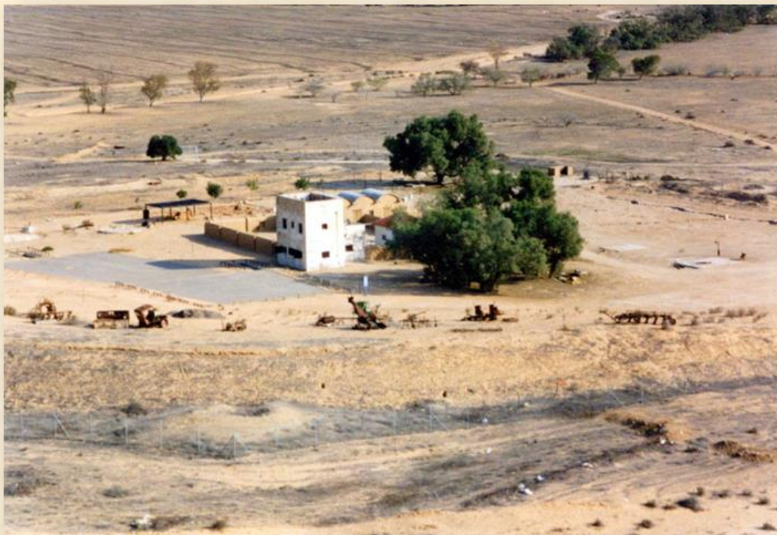
חצר מצפה גבולות כיום

ב- 1946 עזבו ראשוני המקום ועברו להקים את קיבוץ חצור שבשפלה. מחליפיהם יקימו לימים את קיבוץ נירים וגבולות נותרה כתחנה למעבר המצפה לגרעין של קבע. אחרי מלחמת העצמאות ניטש המצפה הישן והוקם יישוב הקבע קילומטר מצפון. צה"ל השתמש במצפה הנטוש כבסיס זמני לכניסת גדודי מילואים לקו הרצועה עד 1967. בשנות הארבעים להקמת המצפה נערך בידי מרכז ההסברה טקס רב- משתתפים. גבולות שייכת היום למועצה האזורית אשכול.