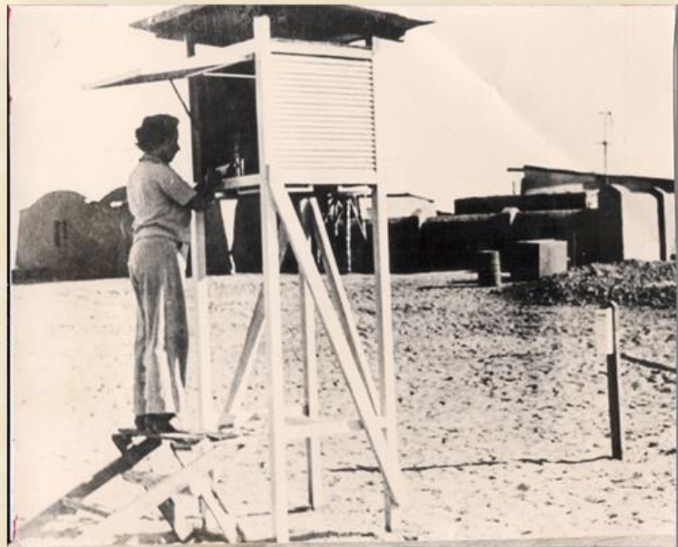
מצפה גבולות תחנה מטאורולוגית: ארכיון גבולות

מהבדווים למדו למנוע סחף-רוח קרקעי והחלו לבדוק נטיעת שדרות עצים במרחקים קבועים של 500 מטרים על-מנת לעצור את הסחף. עוד למדו לבצע חריש שטחי מבלי להרוס את השכבה הקרומית העליונה ששמרה על לחות מסוימת. במוסדות המפקחים על ההתיישבות הוחל בתכנון הניסיונות החקלאיים לגבולות לשנת תש"ה (1945). הוחלט על בדיקת יעילות תוצאת חריש בקיץ וכן חריש בעומק 40 - 50 ס"מ. כנגד סחף הרוח הוצע לנסות להקים סוללות עפר בגובה מטר, כפי שנהגו הבדווים על-מנת להמעיט את נזקי הרוח. בתחום עצי הפרי, הוחלט לנסות לנטוע כרם ענבים ורימונים ולגדלם בשיטה חצי-אקסטנסיבית. בדיון השתתפו וייץ,