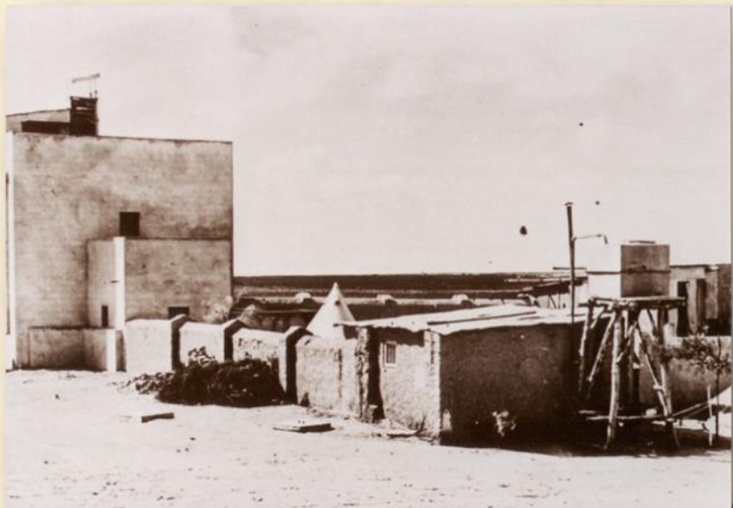
מצפה גבולות 1943