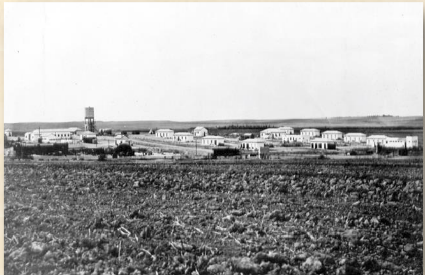
הקיבוץ ערב מלחמת העצמאות: מהספר 'מפקד חבר'

עכשיו, בשניות האלה מה קורה לך? קודם כל, לכל אחד היו בוודאי מחשבות אישיות, אבל דבר אחד היה משותף - חרדה עצומה למשפחה. כי אם אתה שומע את השריקה או את ההתפוצצות, אתה יודע שהפגז הזה, או אשכול הפגזים האלו, לא היו מיועדים אליך. אבל איך אתה יודע שהוא לא פגע במשפחתך?" בסופו של דבר הוכרע שהילדים והמטפלות יכולים להתפנות מהקיבוץ. במהלך הפינוי שמעון הגדיר שכל מי