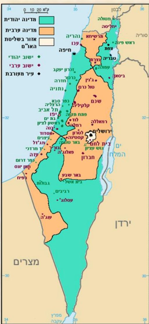
מפת החלוקה

הכותב, הינו נאמן שימור גבולות ובעל הבלוג, "אבני גזית"