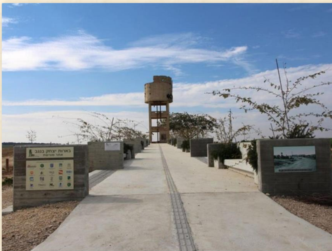
אתר בארות יצחק בנגב, אנדרטת זיכרון לאחר פתוח מועצה לשימור אתרים, המוסדות האזוריים והממשלתיים: יובל נבו