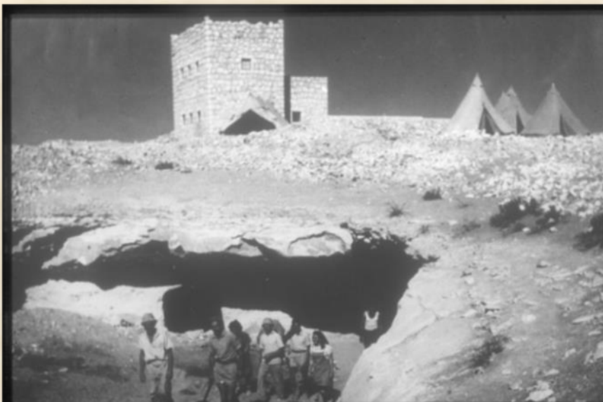
מצפה רביבים 1946