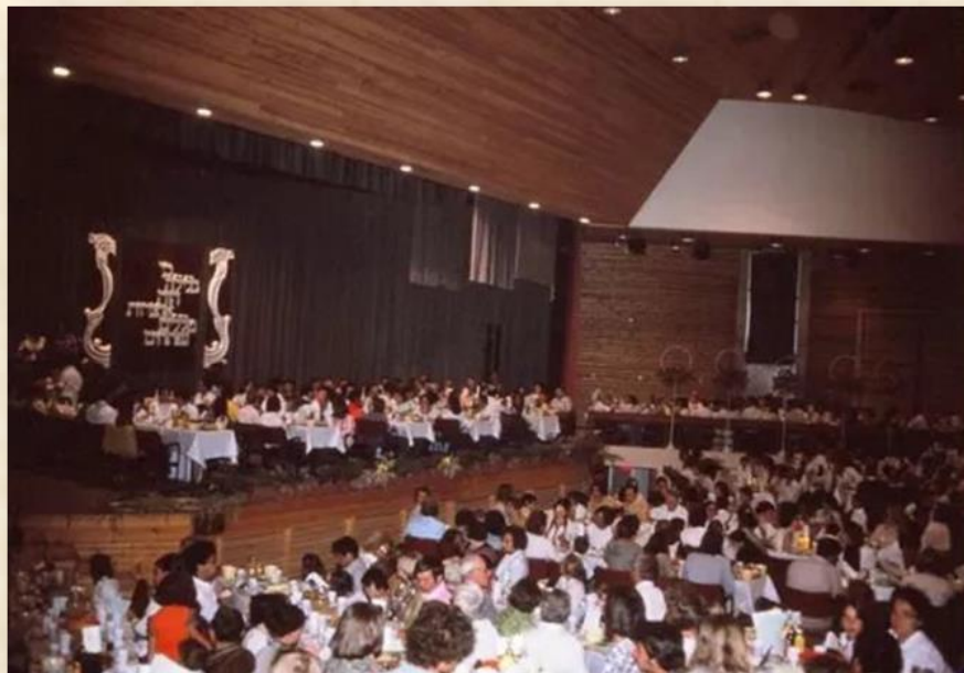
פסח באולם

והכיסאות במספרים שהופיעו על גבי הכרטיס, כמקובל. השינוי שידרג את האולם באופן משמעותי, כשמכל מושב באולם רואים ושומעים היטב. החגים והאירועים הועברו לחדר האוכל והאולם הפך להיות ניתמך על ידי המועצה האזורית. בעקבות שינוי הדירוג שהביא לשינוי חלל האולם, שונתה במעט תקרת העץ, כדי להבטיח אקוסטיקה מתאימה. כשיש מעט קהל, עד כ-300 צופים, התקנו מחיצות שיורדות מהתקרה ואז הקהל יושב קרוב לבמה ובמרוכז ולא