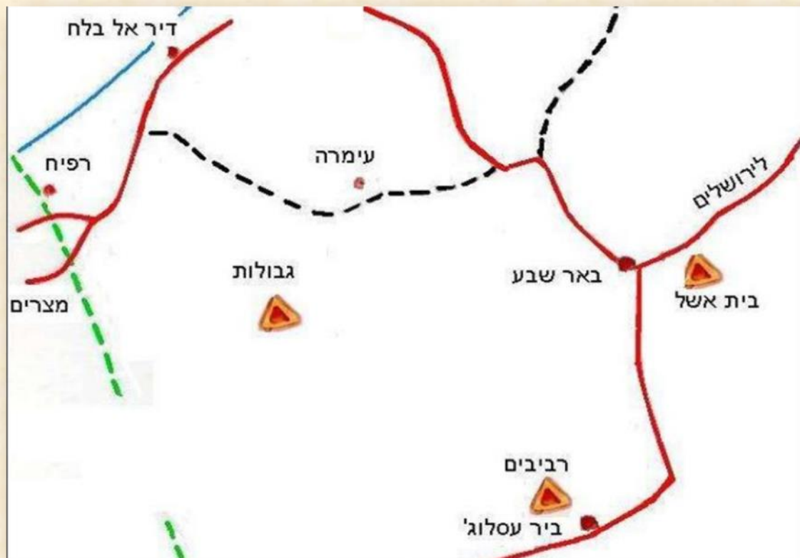
המצפים 1943 : מעליית שלושת המצפים והמערכה על הנגב אמנון דגיאלי