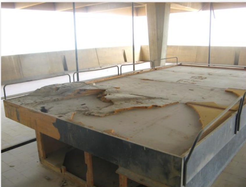
שולחן התבליט במרפסת המוזיאון - 2012

על פי חומר שנאסף מאסף מדמוני, נאות הכיכר - קיץ 2012