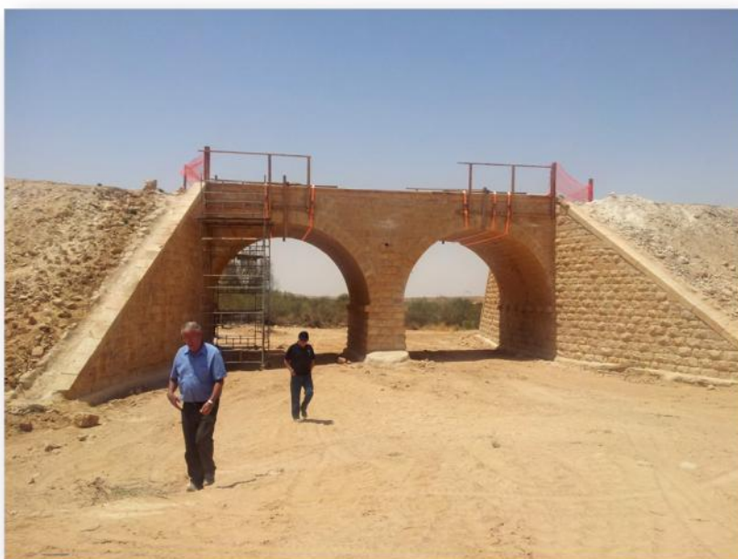
הגשר המשוקם על נחל בארותיים