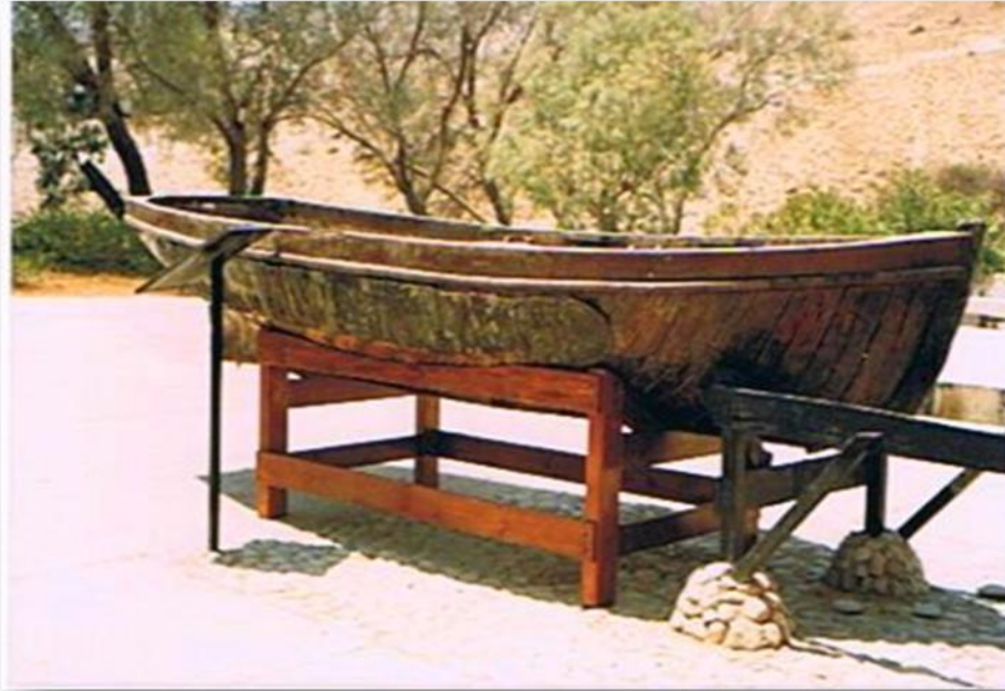
סירתו של מולינה כשהוצגה ברחבת הכניסה