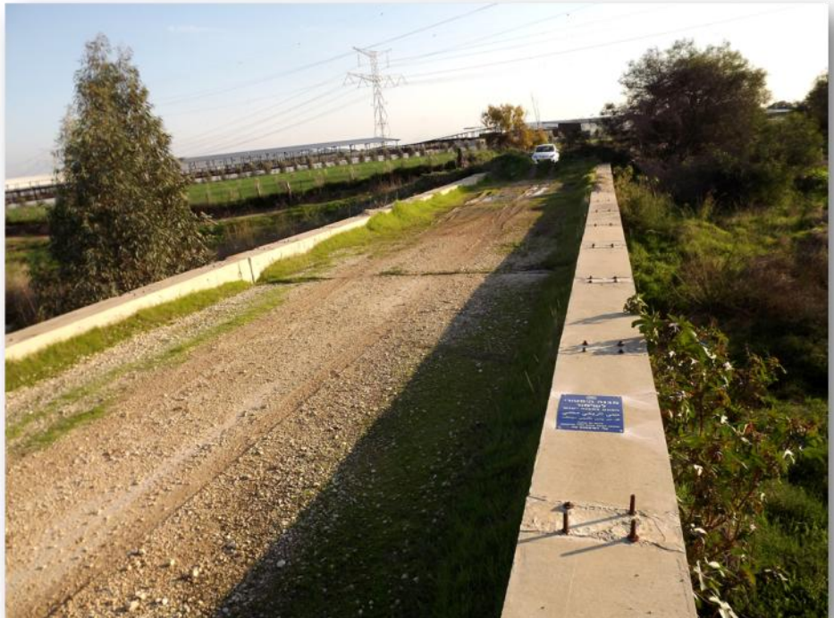
מראה מעל גשר פריזר נחל גוברין

פונתה שושנה מן המשק עם שאר הנשים והילדים ונסעה במשאית באותו לילה גורלי ודרמטי. לולא קלטה אילנה את בכי התינוק ועצרה את פיצוץ הגשר, מאשקה לא היתה כיום סמנכ"לית גד"ש דגנים. הגשר כיום אינו בשימוש, אך ניתן להבחין בו מהכביש הראשי.