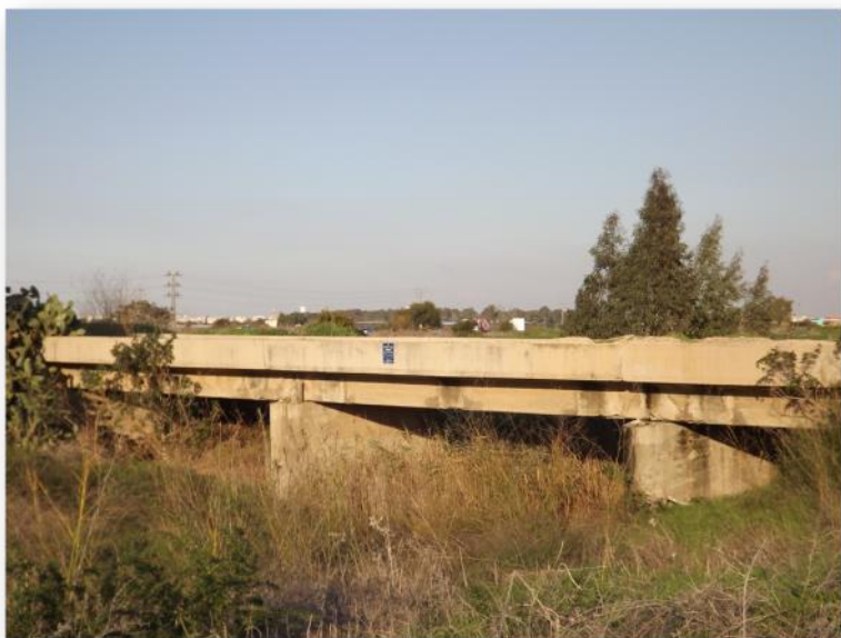
גשר פריזר נחל גוברין

כמה מילים על זאב פריזר ז"ל, נולד בשנת 1898 בבסרביה, בשנת 1920 עלה עם רעייתו לארץ ישראל מאנשי העליה השלישית. אביו של חבר הכנסת לשעבר גדעון בן ישראל. מאז עלייתו ארצה הקדיש עצמו זאב פריזר לבניין הארץ ולביטחונה. נפטר ב 1979 בגיל 81 בירושלים. המהנדס זאב פריזר הקים בשנות השלושים "גשר פריזר" ואת "גשר הקשתות".