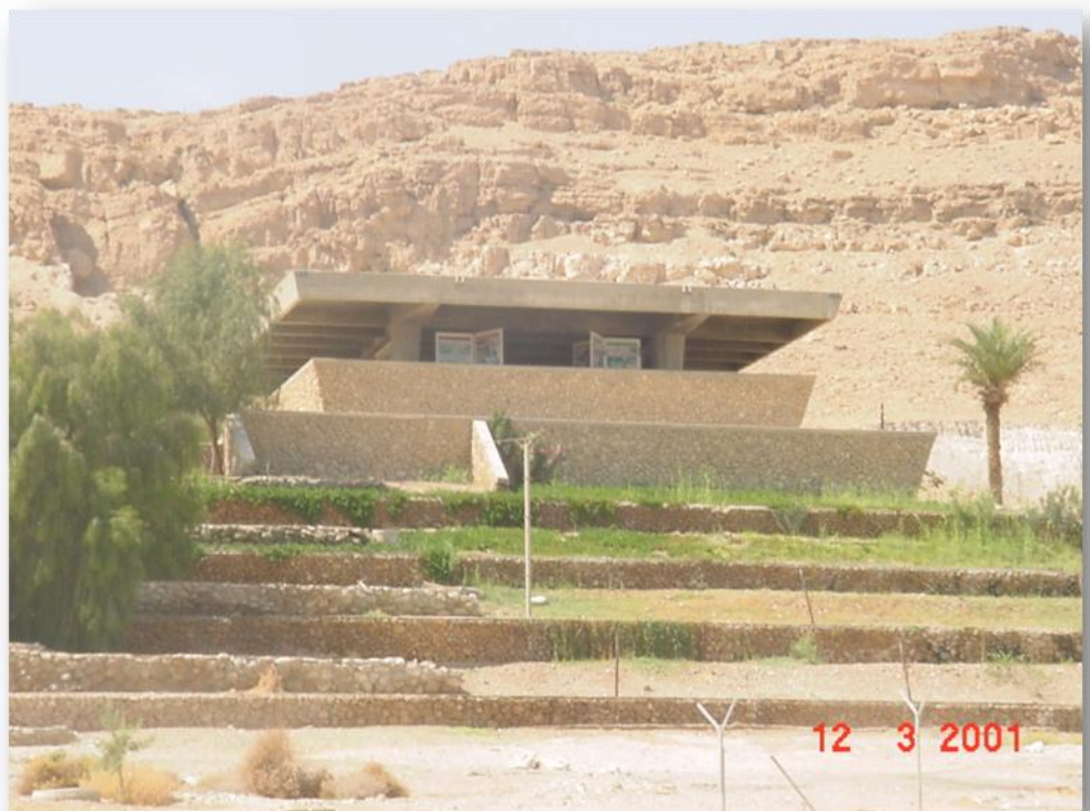
מוזיאון בית היוצר בהיותו פעיל

הכניסה למוזיאון, הוליכה דרך מעלה שיפועי הסובב את המבנה עד למרפסת. במבנה המוזיאון היתה קיימת ספרייה ואולם כינוסים. סירת תומאס מולינה אשר הוצגה תחילה ברחבת המוזיאון, אחר שריפת מרכבת מונטפיורי בירושלים הועברה אל המבנה פנימה.