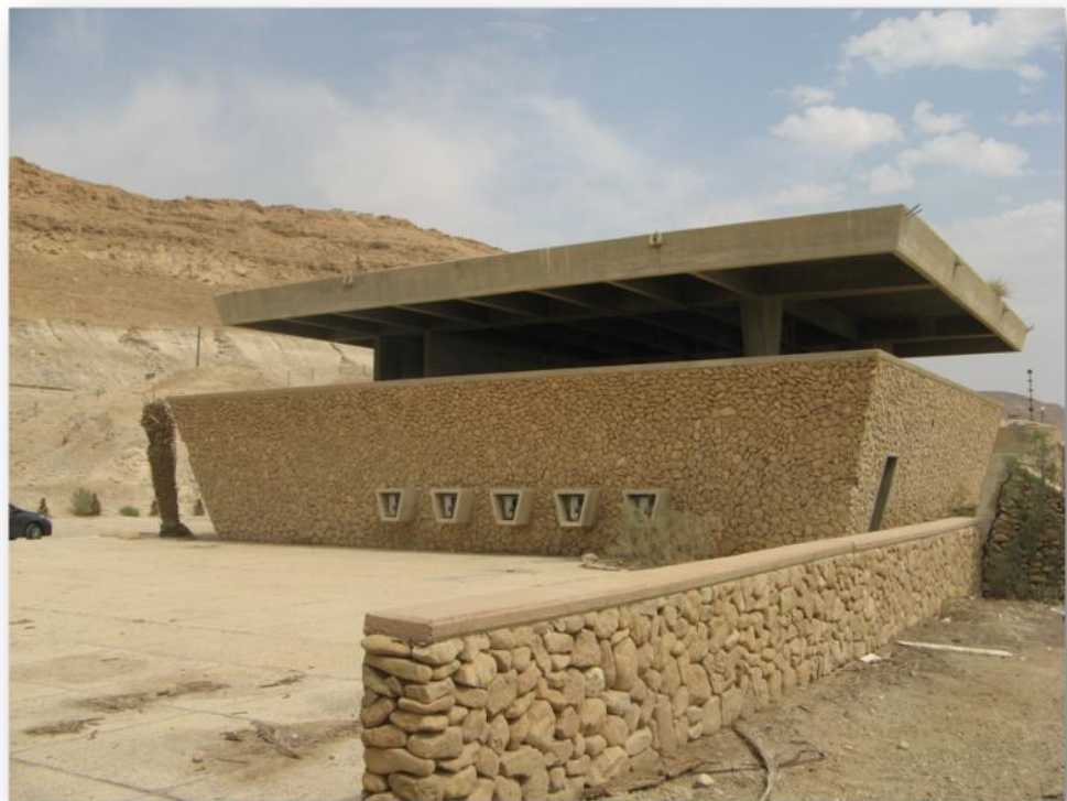
רחבת הכניסה למוזיאון - 2012