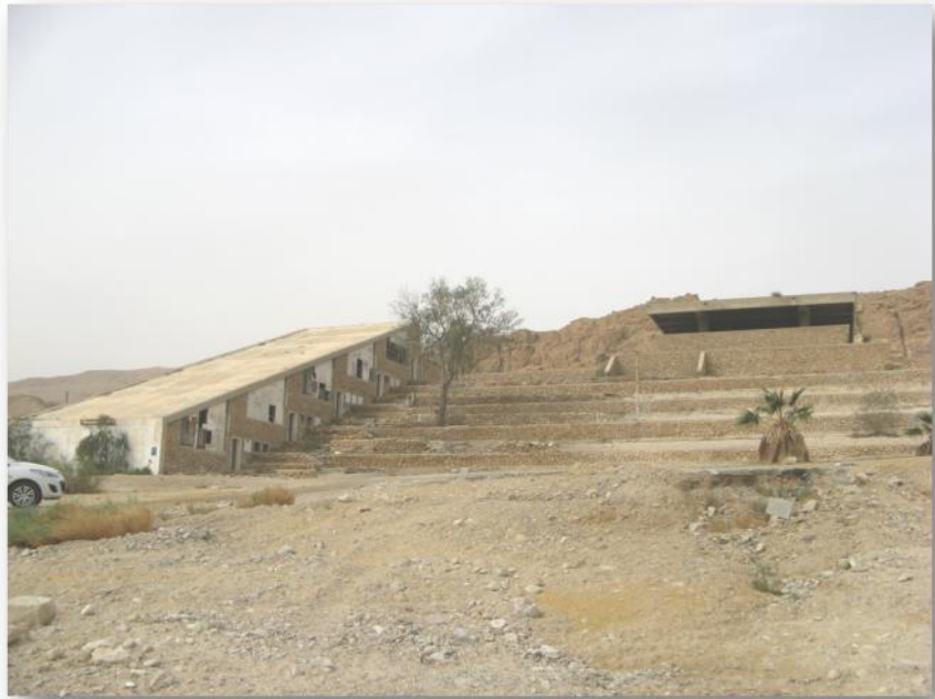
מבנה המוזיאון והאכסניה בתוואי הקרקע יורד - 2012