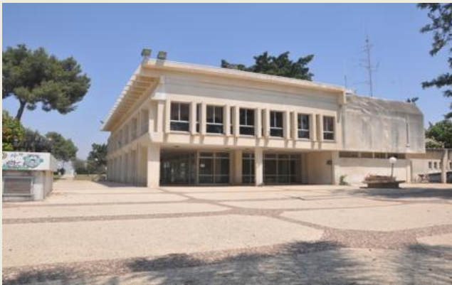
חדר האוכל בנחל עוז.

בשנת 1976 נחנך חדר האוכל החדש, שכלל מקום לכ-400 סועדים, שתי קומות ופונקציות קיבוציות מרכזיות. חדר האוכל הישן המשיך לתפקד כבית תרבות, מועדון וקולנוע עד סוף שנות השמונים ולצורך כך נאטמו חלונותיו ונבנו מושבי עץ בחלקו.