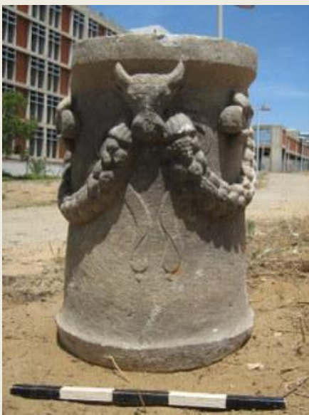
מוזבח פגאני, ביה"ח ברזילי.