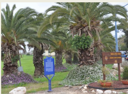
שלט בישיבת כרם ביבנה