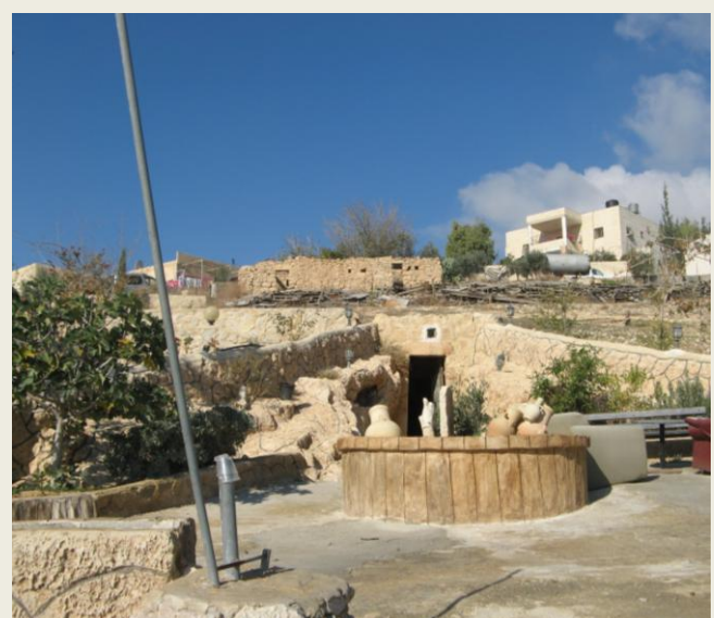
צילום: בכפר דריג'את, (עופר יוגב).