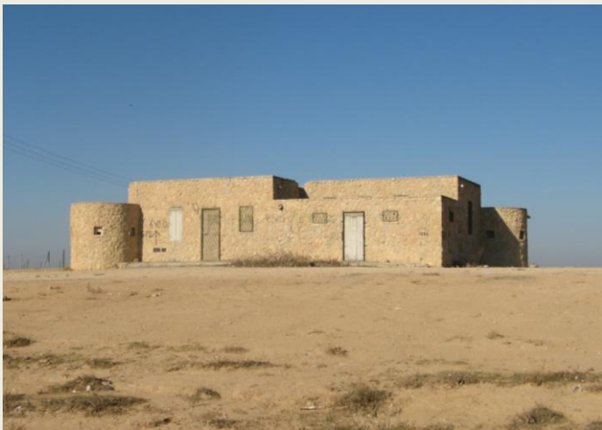
צילום: מבנה משטרת שובל, (עופר יוגב).

כמו כן, יש לתעד את השימושים השונים שנעשו במבנה מאז שחדל להיות משטרה (בראשית ימי מדינת ישראל התקיימו בו דיוני בית הדין השבטי הבדוי) ואולי גם של המבנים האחרים (משטרת כורנוב, שימשה כמרכז לוגיסטי וכמחסן בעת החפירות הארכיאולוגיות של האתר וכעת יש בה מסעדה).