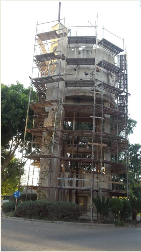
צילום: מגדל המים בנגבה