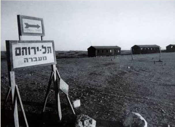
צילום: המעברה בתל ירוחם, (ארכיון עיריית ירוחם).

בגובה 520 מטר מעל פני הים, ב-9 במאי שנת 1951, ב' בשבט תשי"א, נחנכה מעברת תל-ירוחם, יסוד לעיר החדשה הראשונה בנגב, פרי יוזמה משותפת של הסוכנות היהודית, משרד העבודה וסולל בונה. ירוחם, הייתה אחד היישובים הבודדים והמבודדים בין באר שבע לאילת. תחילה הוקמו במעברה אוהלים ועם הזמן הוספו צריפי העץ. בשלוש השנים הראשונות נקלטו בה עולי רומניה, ומשנת 1954 ואילך עולים ממרוקו, תוניסיה, לוב, הודו ופרס. לאחר הפיגוע במעלה עקרבים בשנת 1954, הוקם בצמוד למעברה מחנה צבאי, שחייליו ליוו את האוטובוסים לאילת ושמרו מפני מסתננים.