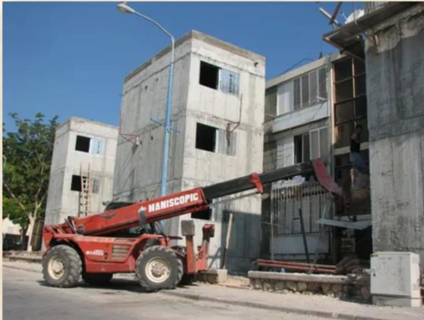
הפרויקט מתבצע בלוח זמנים דחוס הודות לעובדה שמרבית הדירות מאוכלסות: מיכאל יעקובסון

את זה, כמובן, ההנהגה תצטרך לבצע לא רק עם כלכלן כי אם גם עם אדריכל - אבל כזה הרואה עצמו כממש ייעוד ערכי בעבודתו. זוהי - ככל הנראה - אכן המכה הגדולה של עיירות הפיתוח.