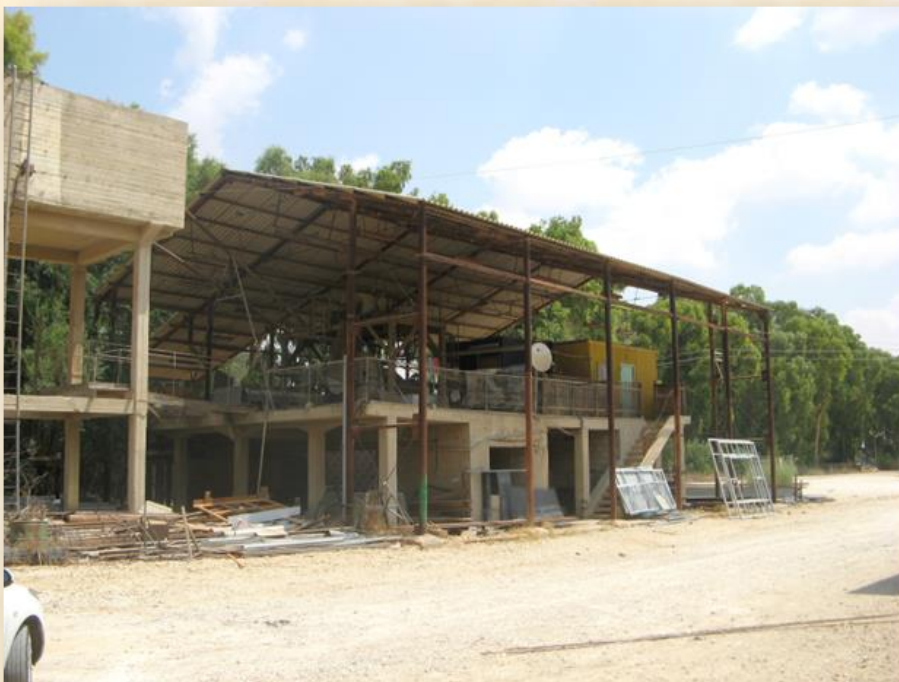
מפעל החבלים מאגבות קק"ל גילת: עפר יוגב

ביקש מייטס להעמיק את הניסיונות בצמח, להשלים אזורי נטיעה רחבים בנגב שלא יוערו ולהפכו למוצר תעשייתי המספק תעסוקה בעיירות העולים. משם הם הובלו ישירות למשתלת גילת. הקק"ל התגאתה במבצע ובצעד בלתי זהיר פרסמה בעיתונות את דבר הבאת שתילי האגבות שהוצאו בדרך-לא-דרך מקניה.