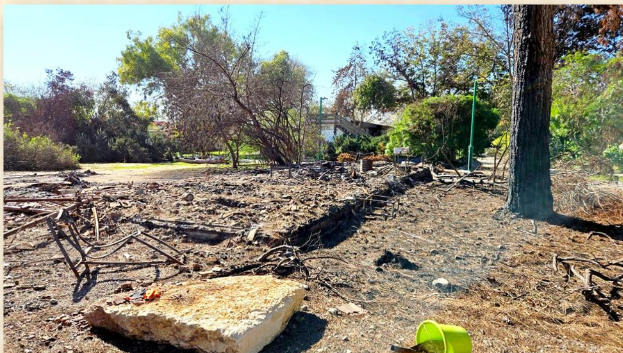
צריף ההיאחזות קיבוץ ניר עוז

גיליון מס' 43 י"א אדר א' תשפ"ד, 20 בפברואר 2024