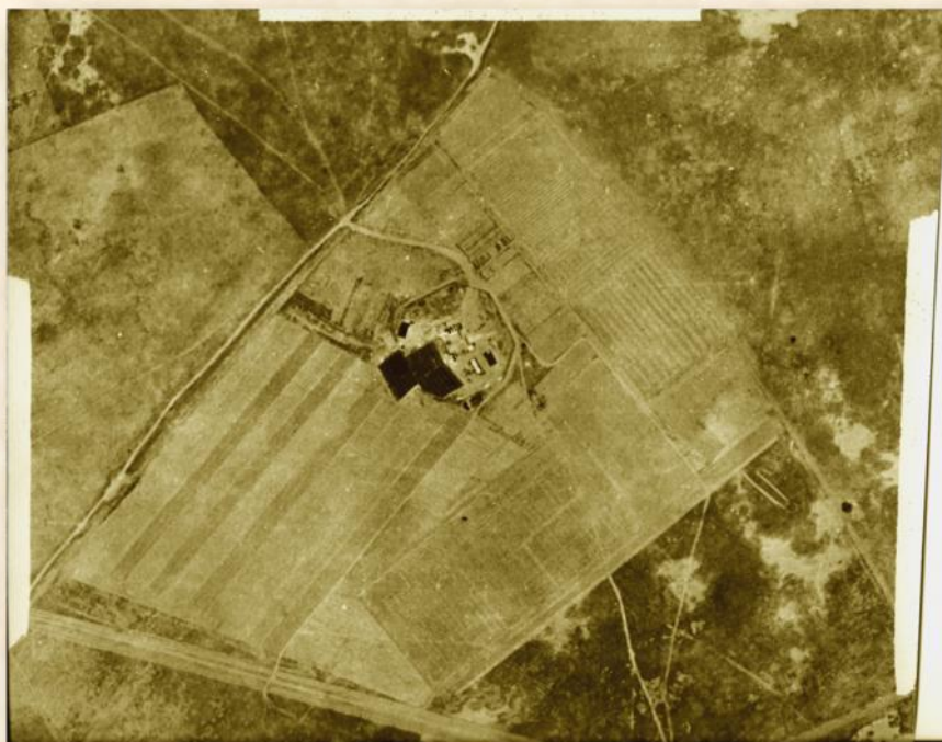
מצפה גבולות וחלקות השדה והמטעים 1945: צילום מטוס חיל האוויר הבריטי

לאחר שלוש שנים, במוצאי יום כיפור שנת 1946, הוקמו 11 יישובים בלילה אחד, 9 מהם בנגב הצפוני ושניים בשפלה