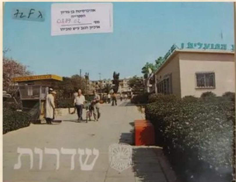
שער חוברת פרסומית על שדרות

לצערי, את הבשורה לא שמעתי יוצאת לא משדרות ולא מאף אחת מערי הפיתוח בדרום (אולי למעט ירוחם לשם ניכנס איש מעשה מהזירה הלאומית).