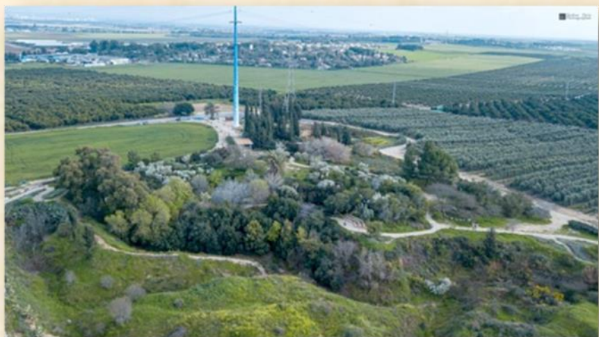
גבעת תום ותומר ברקע קבוץ נגבה: מתוך אתר גבעת תום ותומר

עצים וצמחים מיוחדים שמהווים את שלד הגן: אלות אטלנטיות, אלונים, שיטות סלילניות, קטלבים, זקום מצרי, שקמה, רתמים, אלות מסטיק, עצי תמר, תאנים, אשל הפרקים, שיחי לוטם, צבר ללא קוצים, צמחי תבלין ועוד.