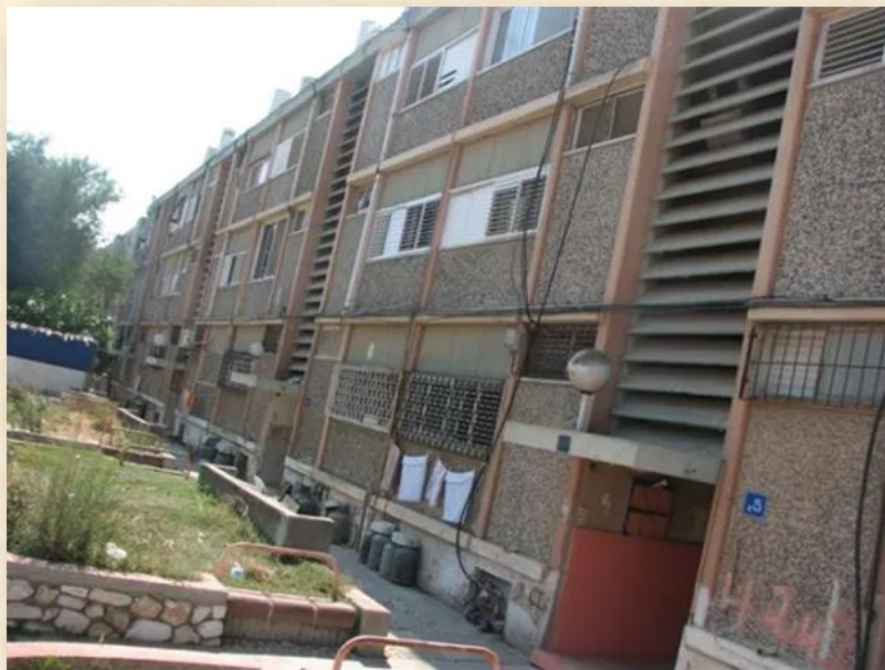
החזית הראשית נשמרת: מיכאל יעקובסון

הכותב הינו אדריכל ובעל הבלוג "חלון אחורי"