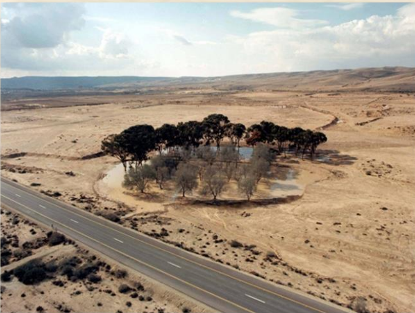
שיטת ההשקיה, לימים 'לימנים': אתר קק"ל

בשיחות פרטיות וביומניו עולה כי וייץ הניח, לדעתו, את הבסיס הרעיוני לשיטה זו כבר כמה שנים קודם לכן. מייטס חש שרעיונו החדש "נגזל" וביקש את תמיכת המתיישבים בשם