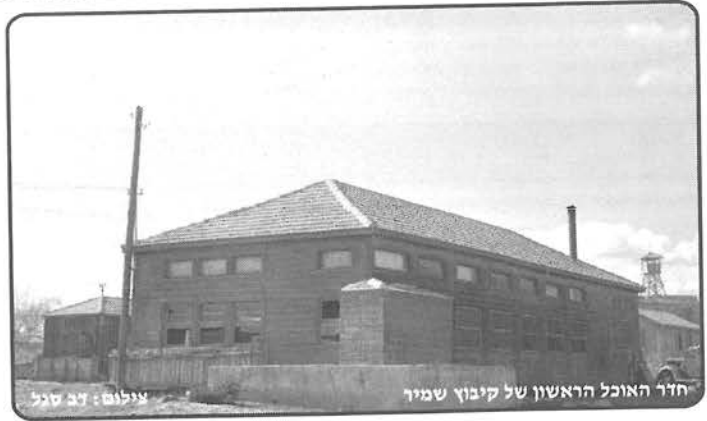
חדר האוכל הראשון של קיבוץ שמיר.

בעקבות יוזמת אגף התכנון של משרד הפנים לאכוף שימור בקיבוצים בעזרת תכניות סטטוטוריות מחייבות, קמה קבוצה של אדריכלים חברי קיבוץ וחברים נוספים, להוביל מהלך שונה ו"רך" יותר ולחדש חשיבה תכנונית וערכית על הקיבוץ המתחדש