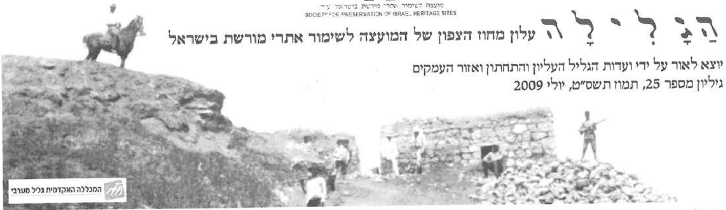
המכללה האקדמית גליל מערבי

יוצא לאור על ידי ועדות הגליל העליון והתחתון ואזור העמקים גיליון מספר 25, תמוז תשס"ט, יולי 2009