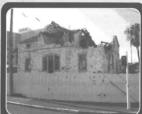
המבנה לאחר פגיעת טיל הגראד, מבט משדרות בן גוריון פינת שדרות העצמאות

הבניין, המיועד לשימור, עמד חודשים רבים הרוס, עד שסודרו הפרטים המנהליים והתקציביים שאפשרו את תכנון שיקומו. העבודה החלה בתיעוד פיזי שלו, בשרטוט מדויק של פרטיו ובזיהוי קווי ההרס ואופיים. בשלב זה זוהו השיטות שבהן נבנה הבית והושוו לשיטות הבנייה המקובלות היום. התברר שהמבנה אופייני לבנייה הטמפלרית המאוחרת. בחלקו התחתון נבנה בור מים, שהתמלא בחורף ממרזבי הגג. במרתף, לצד הבור, נבנו חדרים נוספים שנהנו מגישה לחצר מונמכת. חלק זה נפגע רק קלות בפיצוץ, בזכות קירותיו העבים שחלקם תומכים קרקע. חלק מתקרת המרתף, שנבנתה על שלד עץ, קרס, וכך גם חלק קטן מהמדרגות וממעקה העץ, האופייניים כל כך לבתי הטמפלרים.