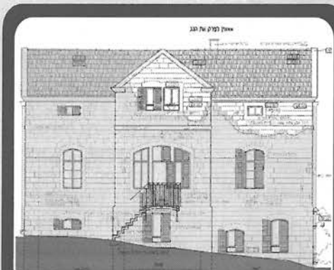
חזית השחזור לכיוון שדרות בן גוריון

חובתן הביטוחית של הרשויות להחזיר את הנכס הפגוע לבעליו כשהוא מתקן עד למצב שלפני הפגיעה; ההכרח לטפל גם בהזנחה רבת השנים, שלב שבלעדיו לא יתקיים המבנה גם אם ישחזור; היעדר "בעל בית" בעל צרכים מוגדרים; הימצאות כל החומר ההרוס בשטח, כשחלקו ניתן לשימוש חוזר; הסימטריה שבין אגפו הצפוני, הפגוע, של המבנה, לאגף הדרומי השלם שלו, שהקלה מאד על הבנת שיטת הבנייה המקורית, שנחשפה בקו החרס. משיקולים אלה נבעה ההחלטה לשחזר את המבנה בטכנולוגיה המקורית (במידת האפשר), בעזרת חומרים ששימשו במקור לבנייתו, ולהביאו לצורתו המקורית. למעט עניינים שוליים - כך אכן נעשה. את החלק האחורי-המערבי של המבנה הוחלט להרוס, ותחתיו בוצע שחזור שלם, הפעם עם רצפות ותקרות משלד עץ במקום הפלדה והבטון. בנדבך האבן הראשון נעשה בעת השחזור שימוש בסיתות שונה מזה של הקירות המקוריים. כתוצאה מכך נשארה "צלקת עדינה" על הזיתות המבנה, בקו שבין החלק המקורי בקטע שנהרס לזה ששוחזר, לספר על תולדות הבית.