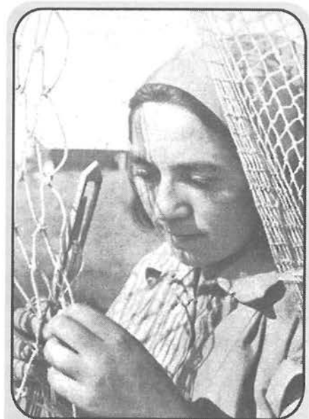
חברה בקבוצת דייגים מתוך האלבום "משמר וספורט", הוצאת חברת דובק, סוף שנות השלושים

המכשול העיקרי שעמד בדרכן של קבוצות הדיג העבריות מאז שנות העשרים - האבטלה בימי הקיץ. יש לציין שהממשלה אסרה על דיג האורות, בנימוק שהוא משנה את יחסי הכוחות בין יהודים לערבים באגם. מעניין שלאחר המאורעות יזמו ערביי אזור הבטיחה, בצפון הכנרת, שיתוף פעולה עם דיגי