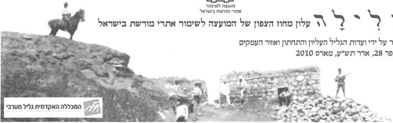
המכללה האקדמית גליל מערבי

יוצא לאור על ידי ועדות הגליל העליון והתחתון ואזור העמקים גיליון מספר 28, אדר תש"ע, מארס 2010