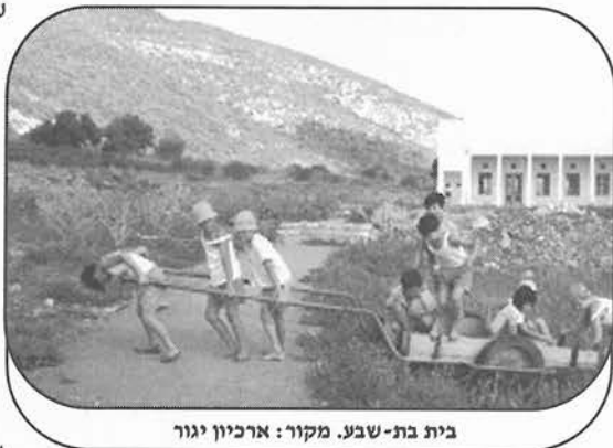
בית בת-שבע.

התרבותיים. נקבע כי "בית בר-יהודה" יהיה המרכז התרבותי של יגור. הוא נבנה לצד חדר האוכל, כדי לשלבו בחיי היום-יום של החברים, ונחנך באפריל 1969. יש בו אולם הרצאות, חדרים לפעולה תרבותית ולחוגים, ספרייה מרכזית, מועדון לחברים, חדר מוזיקה ורחבת כינוס. ניכר שבבנייתו ובאופן הפעלתו