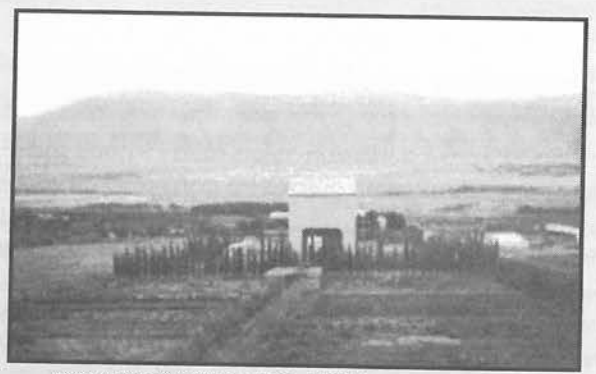
הבמה המשותפת בשנות השלושים.

אירוע קשה אירע ב-1944, כשנערכה בעין חרוד הזמרייה הראשונה בארץ - כינוס של כ-800 חברי מקהלות מרחבי היישוב. בערב המופע קרסה הבמה הגדולה תחת משקל הזמרים,