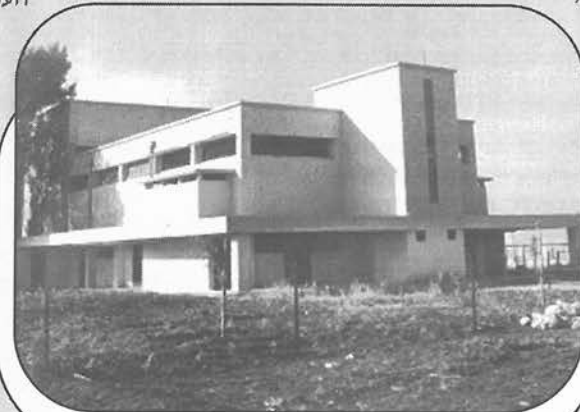
בית העם לאחר שיפוץ, 1946.

תכנון נקודת הקבע של מושב העובדים נהלל, ב-1921, הושפע מצורתה האליפטית של הגבעה שעליה ישב. ממנה צמח הרעיון של כביש טבעתי הסובב את מרכז הכפר, כשמחוץ לו החלקות החקלאיות ובתוכם בתי המגורים ושירותי המשק והחברה. תכנון "סגור" זה, שאינו מאפשר הקמת יחידות נוספות, הועדף גם על ידי המוסדות המיישבים, שרצו לגרום באמצעותו לדור ההמשך לפנות בעתיד להתיישבות חדשה. לפי תכניתו המקורית של ריכארד קאופמן מתנוססת במרכז הכפר, בראש הגבעה, קבוצת מבני ציבור, ולרגליהם בתי בעלי המלאכה והמורים, שסביבם טבעת בתי המתיישבים. למרות שבנהלל התהוותה חברה של אנשים צנועים, שהשקיעו את עצמם בעבודות המשק, זו הייתה גם חברה צמאת תרבות. "מבנה הציבור" הראשון שהקימה - אוהל גדול שכונה "האוהל האדום" - המה כל ערב מאסיפות, הרצאות ואירועי תרבות. מאוחר יותר הוא הוחלף ב"צריף הגדול", שכונה "האורווה" בגלל תפקידו הקודם. כשהתחילו תיאטראות הארץ להגיע למושב נבנתה במה ארעית להצגות תחת כיפת השמים.