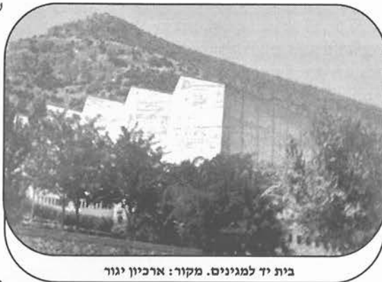
בית יד למגינים.