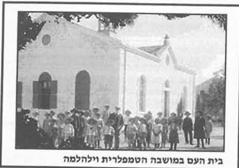
בית העם במושבה הטמפלרית וילהלמה

בתי העם במושבות הטמפלרים שימשו כמרכז רוחני, תרבותי ודתי, ומוקמו בדרך כלל במרכז היישוב. ייחודם הארכיטקטוני סימל את חשיבותם בחיי הקהילה