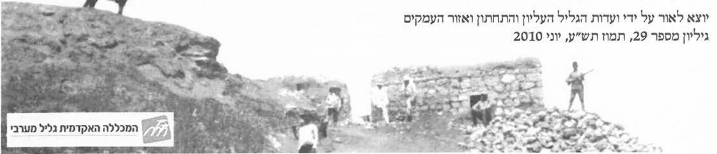
המכללה האקדמית גליל מערבי

יוצא לאור על ידי ועדות הגליל העליון והתחתון ואזור העמקים גיליון מספר 29, תמוז תש"ע, יוני 2010