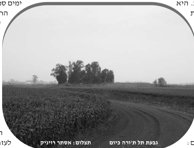
גבעת תל ת'ורה כיום

רק לאחר שהנהלת הגופים הציוניים בבוקובינה הבהירה להנהלה הציונית כי יחסה המתנכר לקבוצה עלול לפגוע בתרומות יהודי בוקובינה לקרנות הלאומיות, הסכימה המחלקה להתיישבות לאפשר לקבוצה להתיישב, אך