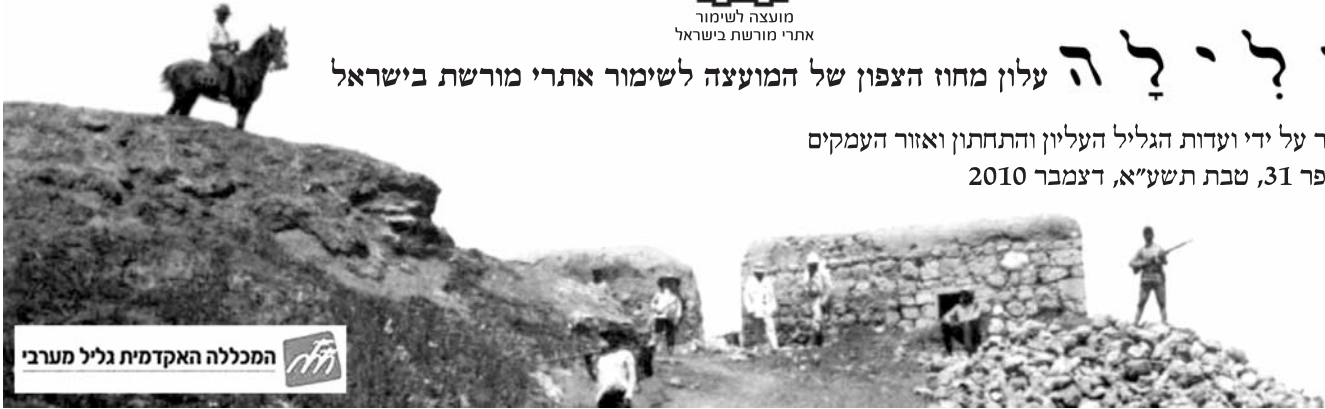
המכללה האקדמית גליל מערבי