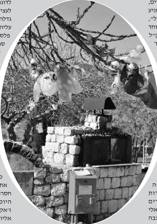
עץ תאנה ליד ציון קברו של ר' מנחם בן יאיר בבית הקברות העתיק של צפת.

זה בני דתות שונות, כמו בישראל, יש עצים המקודשים למאמינים שונים, ומנהגים הקשורים בהם "זולגים" מדת לדת. בתל דן, למשל, ליד קברו של שיח' מרזוק, ניצבו אלון