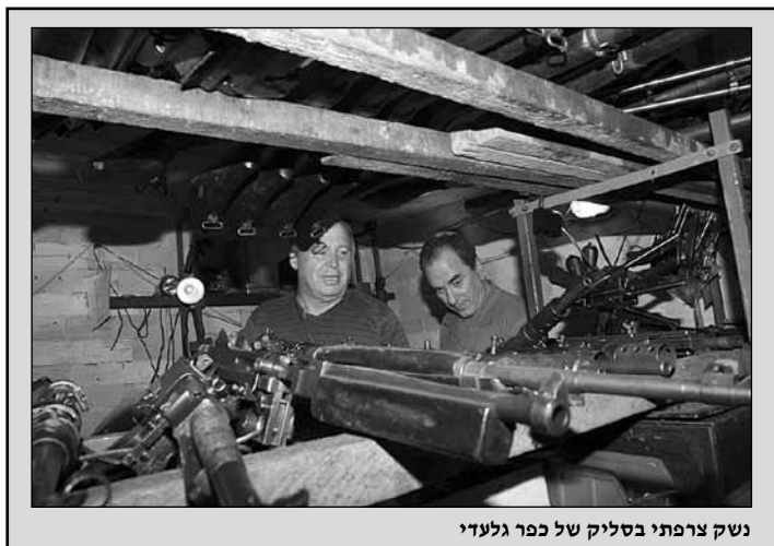
נשק צרפתי בסליק של כפר גלעדי

אנשי הקיבוץ טענו שהפרדות המתות בשדות הקרב הנטושים יגרמו להתפרצות מגיפות, וכך ניתן להם להיכנס ללבנון כדי לטפל בדבר, ובינתיים לאסוף כמויות גדולות של נשק שלל צרפתי