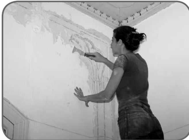
חשיפת ציורי הקיר