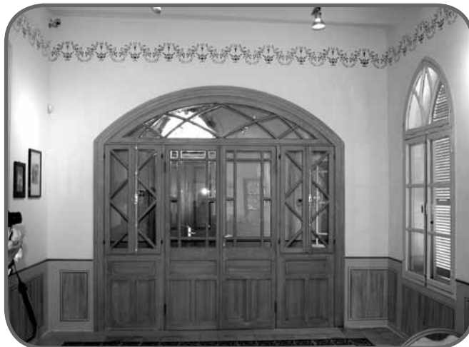
חדר האוכל המשוחזר