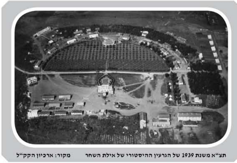
תצ"א משנת 1939 של הגרעין ההיסטורי של אילת השחר

שונה מהמקובל, ומזכיר את בתי המושבות באזור הם נבנו בשילוב של טכנולוגיות מסורתיות וחומרים מקומיים כגון אבן וגומא, עם טכנולוגיות מודרניות וחומרים מיובאים כמו בטון ורעפי מרסי. השילוב של בטון, שרק הגיע אז לארץ, בבניית האבן הוא יוצא דופן. הרפת, שהוקמה לפני בתי המגורים, הייתה המבנה הראשון הבנוי מבטון בלבד בגליל העליון! מעבר ליצירתיות של ארליך, מפקח הבנייה, הדבר משקף גם את החיבור שבין יק"א ה"שמרנית" לבין הרעיונות הסוציאליסטים, שהחלו להתבטא באותה תקופה גם בסגנון אדריכלי חדש - הסגנון המודרניסטי.