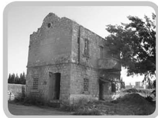
המבנה הדו-קומתי היום

יצאתי לצמח שעל גדות הכנרת לתעד את מה שנותר ממתחם הרכבת. חמישה מבנים יש באתר, שלושה מהתקופה העות'מאנית ושניים מתקופת המנדט. את אלה העות'מאנים קל לזהות - הם נבנו מאבני גזית