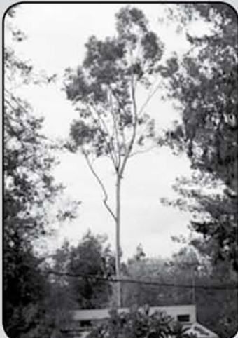
האיקליפטוס הלימוני בחולתה בצעירותו

"רגל הפיל". זה הוא עץ ענק שמוצאו מאמריקה המרכזית, וגזעו המרשים מתעבה ומתפתל לקראת הקרקע, ויוצר מעין צורה דמוית רגל פיל. בקיבוצים אחרים ובמוסדות לא-קיבוציים שדודיש תכנן בהם את הנוי יש ודאי עוד עצים מיוחדים, אך