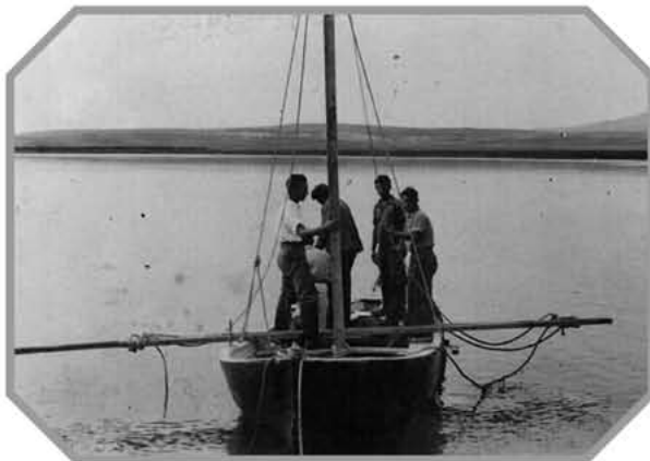
דייגים באגם החולה