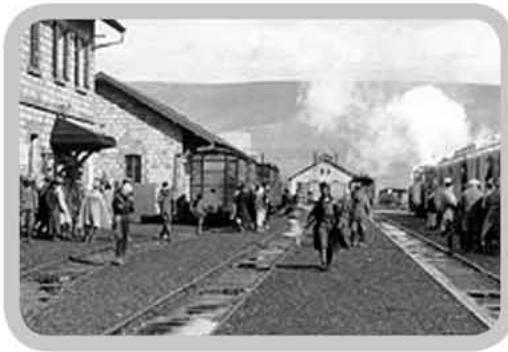
תחנת צמח בשנות השלושים

התחנה בעיירה צמח הפכה לתחנת גבול בהסכמת הבריטים והצרפתים, למרות שהגבול המדיני בין פלשתינה-א"י לסוריה נקבע 8 ק"מ ממזרח לה, באל-חמה. צמח שגשגה והתרחבה בזכות התחנה, ונבנו בה בית-מכס, מחסנים, חנויות ובתי מגורים לעובדי הרכבת. בשל מיקומה המיוחד הוקם בה מתקן סובב להיפוך הקטרים שהוחלפו בהמשך הנסיעה מעבר לגבול. אך לא כולם ראו בעין טובה את צמיחתה של צמח. סוחרי טבריה, למשל, ראו בכך הסגת גבול. במאסר 1928 ביקר בעיר אלפרד מונד, לימים הלורד מלצ'ט, ופרנסיה שטחו בפניו את בעיותיהם, בהן ניתוקם מקו הרכבת. למרות תזכיר מפורט שנחתם בידי יהודים, מוסלמים ונוצרים - החליטו הבריטים שלא להיענות לבקשה ולא להקים מסילה לטבריה.