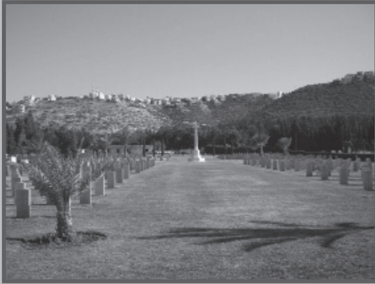
בית הקברות הבריטי בחוף הכרמל

וימאים בריטים וזרים, וש אחרי 66 שנים כבר אין עליהם סימון. ירדתי יום יום לבית הקברות הבריטי בחוף הכרמל, ולאחר כמה חודשי חיפושים החלטתי יום אחד, בנובמבר 2008, לסרוק שוב את הצמחייה שבקצהו הצפוני. להפתעתי גיליתי ליד הכניסה הראשית מתחם קבורה קטן של כ-20X20 מטרים, ובו קברים צבאיים ואזרחיים של בריטים ובעלי לאומים אחרים, כולם מהשנים 1939-1948. בין הקברים גיליתי כמה צלבי עץ ללא שמות, וכן רווחים "ריקים". מתחת לשכתב החצץ, בעומק סנטימטרים ספורים, מצאתי בסיסי בטון עגולים שבמרכזם חור עם שאריות של צלבי עץ. שומר בית הקברות מסר לי שאביו, שאת עבודתו ירש, סיפר לו שלפני שנים הוצאו גופות של לוחמים איטלקיים מבית הקברות והוחזרו לאיטליה.