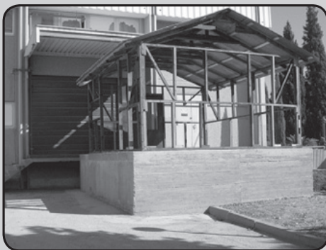
הקמת הצריף מחדש במוזיאון העלייה החמישית בתפן

במירוף נגד השעון (והדחפורים) פונה הצריף, תכולתו מוינה וקוטלגה, והכל הועבר למוזיאון בתפן