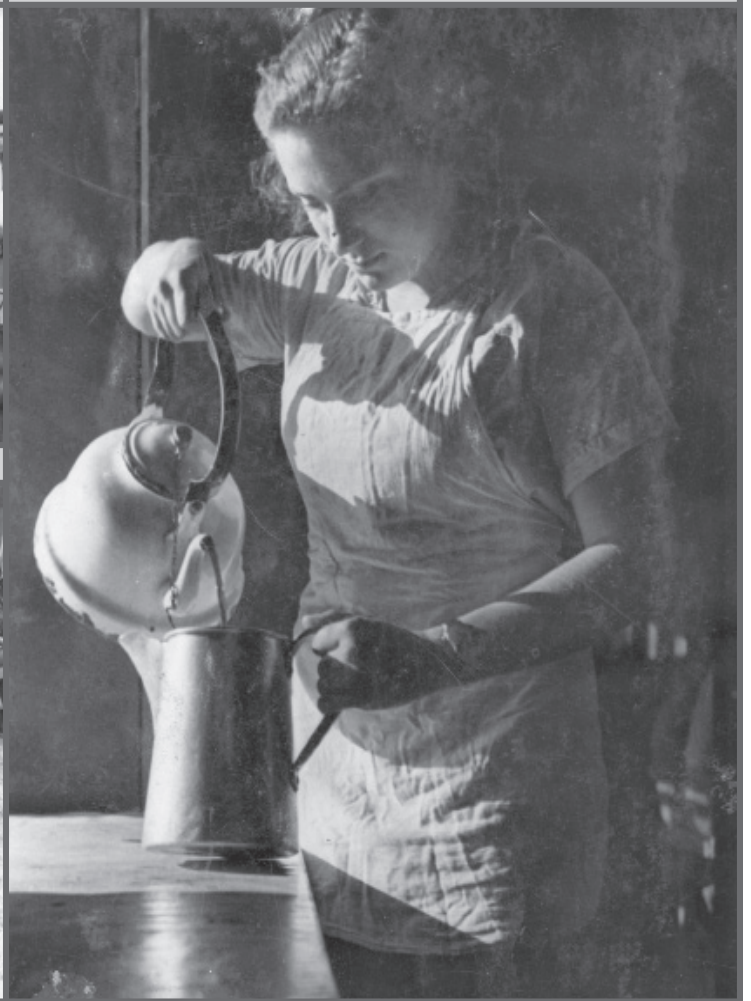
במטבח המוסד, 1939