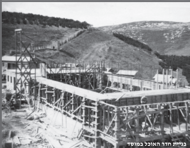
בניית חדר האוכל במוסד