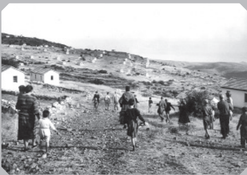
מעברת פראדיה ממזרח, מכיוון כביש עכו-צפת