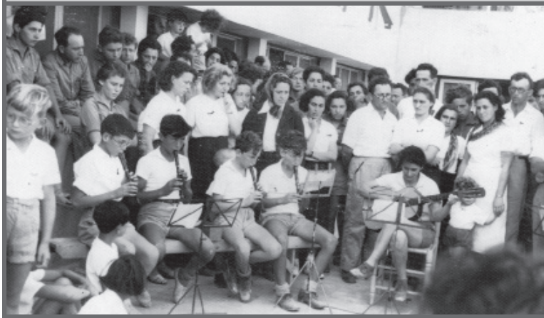
תזמורת המוסד באחד במאי