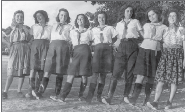
קבוצת חבצלת בהצגת הפואמה הפדגוגית מאת מקרנקו, 1941