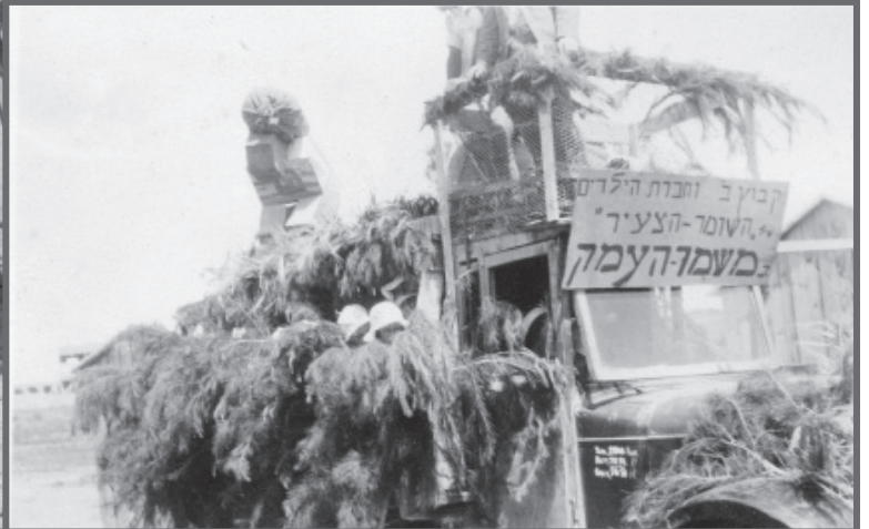
תהלכות אחד במאי במזרע