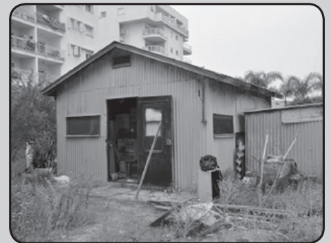
הצריף בפנינת הרחובות ויצמן וחניטה בנהריה, ערב הפינוי

האדריכלית נעמה נאמן-מזרחי מנהלת את מחוז חיפה והגליל המערבי במועצה לשימור.