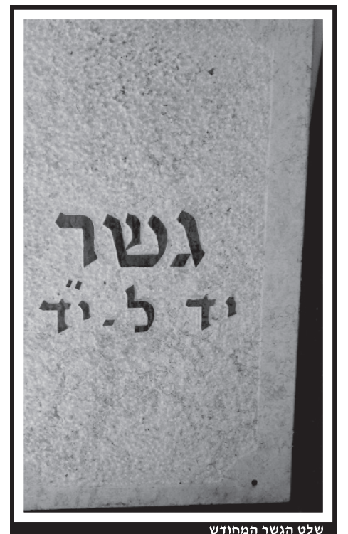
שלט הגשר המחודש