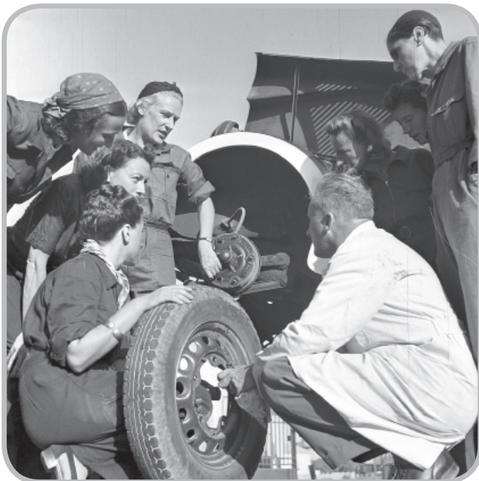
על פי הרישום של שוורץ: הכשרת מכונאיות רכב בנחלת יצחק (כנראה מהמתיגייסות ל-ATS)