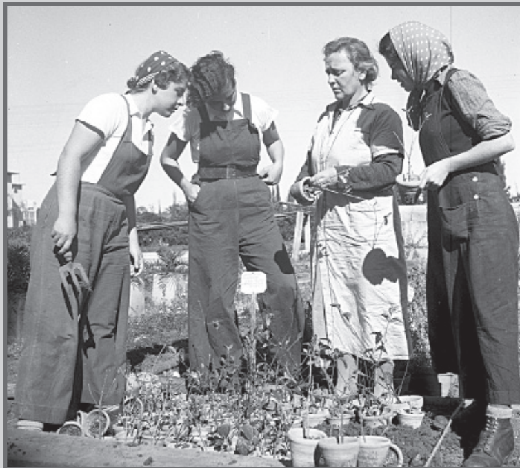
על פי הרישום של שוורץ: בית הספר החקלאי בנהלל