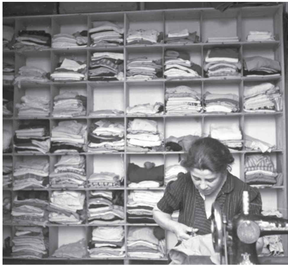
על פי הרישום של שוורץ: בגליל