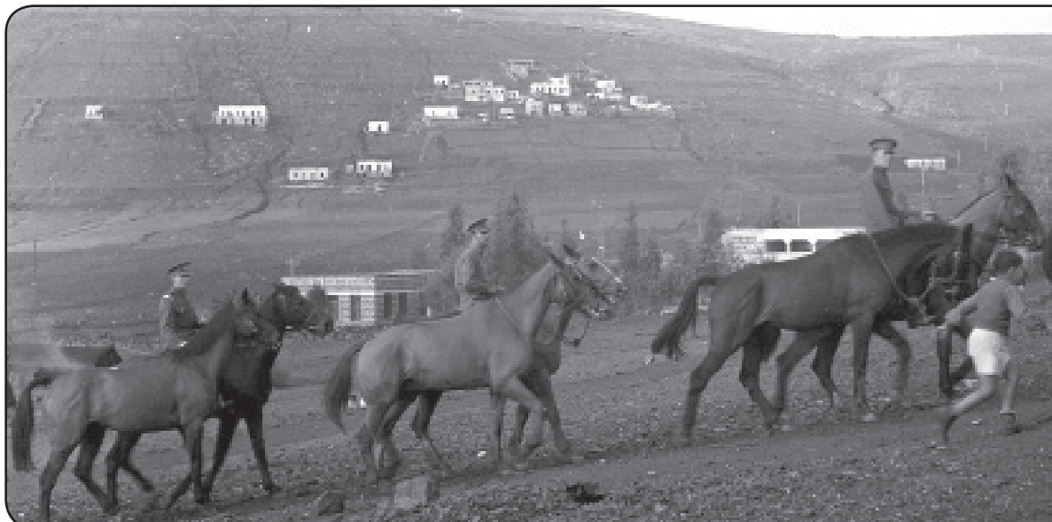
על פי הרישום של שוורץ: חוות סוסים ליד טבריה

לקראת גיבוש תכנית מתאר חדשה למושב יזמו תושבי רחוב הראשונים - לב המתחם ההיסטורי - תכנית מפורטת, האמורה לשלב את השימור בהסדרת עקרונות תכנון ופיתוח במתחם. המועצה לשימור סייעה באמצעות מימון מחקר ייחודי, שהיה חלק מדרישות הוועדה המחוזית לתכנון, על ההיסטוריה של ההתפתחות הפיסית של המושב. המחקר המאלף, שנכתב על ידי