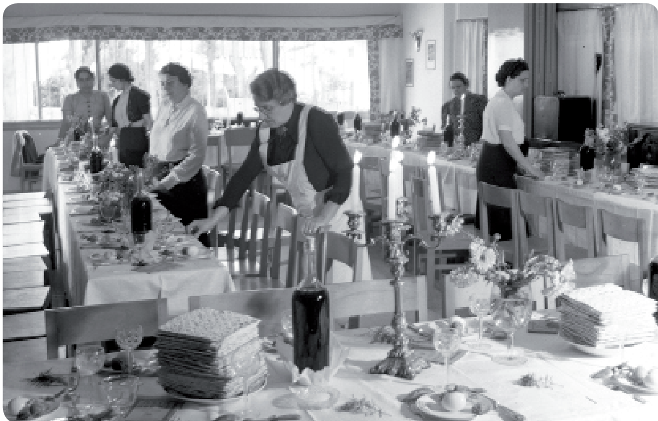
הכנות לסדר פסח בבית הספר החקלאי בנהלל

ב-1948 נהרס פוטו שוורץ בפיצוץ מכונית תופת בסמוך לו. למרבה המזל נשמר חלק גדול מהתצלומים בביתה של טרודי, ובהם אלפי תשלילים ותצלומי