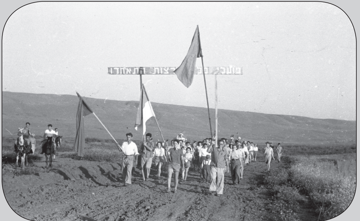
על פי הרישום של שוורץ: בגליל