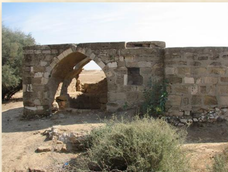
מבנה-על של באר דרומית למושב תפרח: דן גזית

(*) במלחמה העולמית הראשונה שהו בצפון הנגב, במשך כחצי שנה, כחצי מיליון חיילי הצבא הבריטי ונספחיו שעלו ממצרים מול האימפריה העות'מאנית. הבריטים העדיפו להשקות את צבאם (כולל רבבות סוסים, פרדים וגמלים) בשאיבה מנביעות נחל בשור ואגירת המים האלה בבורות המים מהתקופה הביזנטית, הנפוצים בשטח.