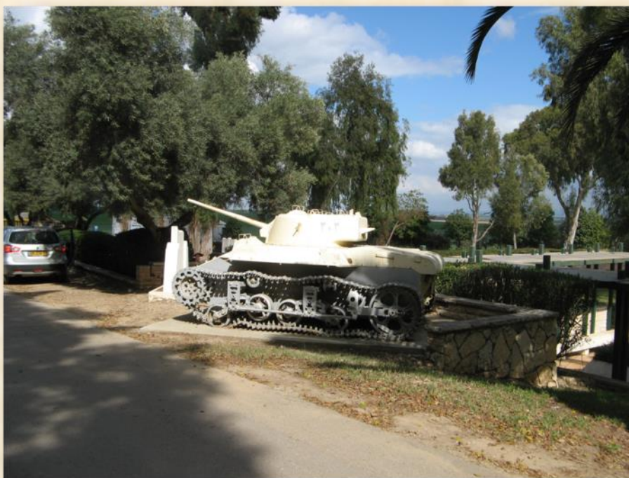
הטנק בכניסה לבית העלמין