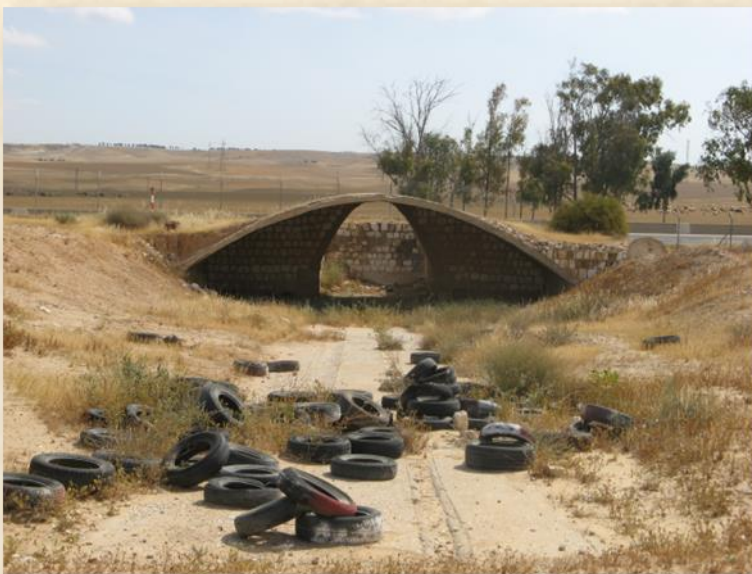
ד"ר תת קרקעי (למטוס קרב מנחת שדה תימן: עפר יוגב)

תחילת מלחמת העולם השנייה עמדה בסימן של ניצחונות בזק גרמניים שהביאו בשיאן לכיבוש צרפת על ידי כוחות גרמניה ב-1940 ולחשש כבד בצמרת השלטון הבריטי מפלישה גרמנית לבריטניה. חשש זה הביא להיערכות במפקדת הכוחות הבריטיים במזרח-התיכון לתחזיות קשות של מרידת אלמנטים ערביים פרו-גרמניים ושל התקפות איטלקיות וגרמניות על אינטרסים בריטיים במזרח-התיכון (גלבר, 1990, עמ' 16-17).