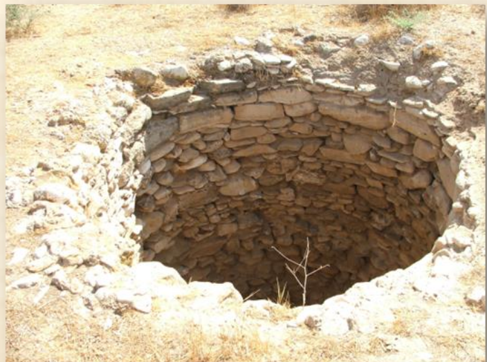
ביר קמלה (מדרום-מזרח לתל שרוחן: דן גזית)

הלמות, באר שרוחן, מאגר נירים; בארות רבובה (רואיבה) מצפון לגבולות; באר חוות נבון (מדרום למגן); באר מדרום-מערב למגן; באר בכניסה לגבולות.