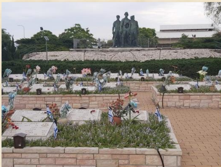
בית העלמין: אתר מא"ז יואב

בשנת 1949 הזמינו יד מרדכי ונגבה את הפסל נתן רפופורט לבנות מצבות זיכרון פיסוליות מברונזה.