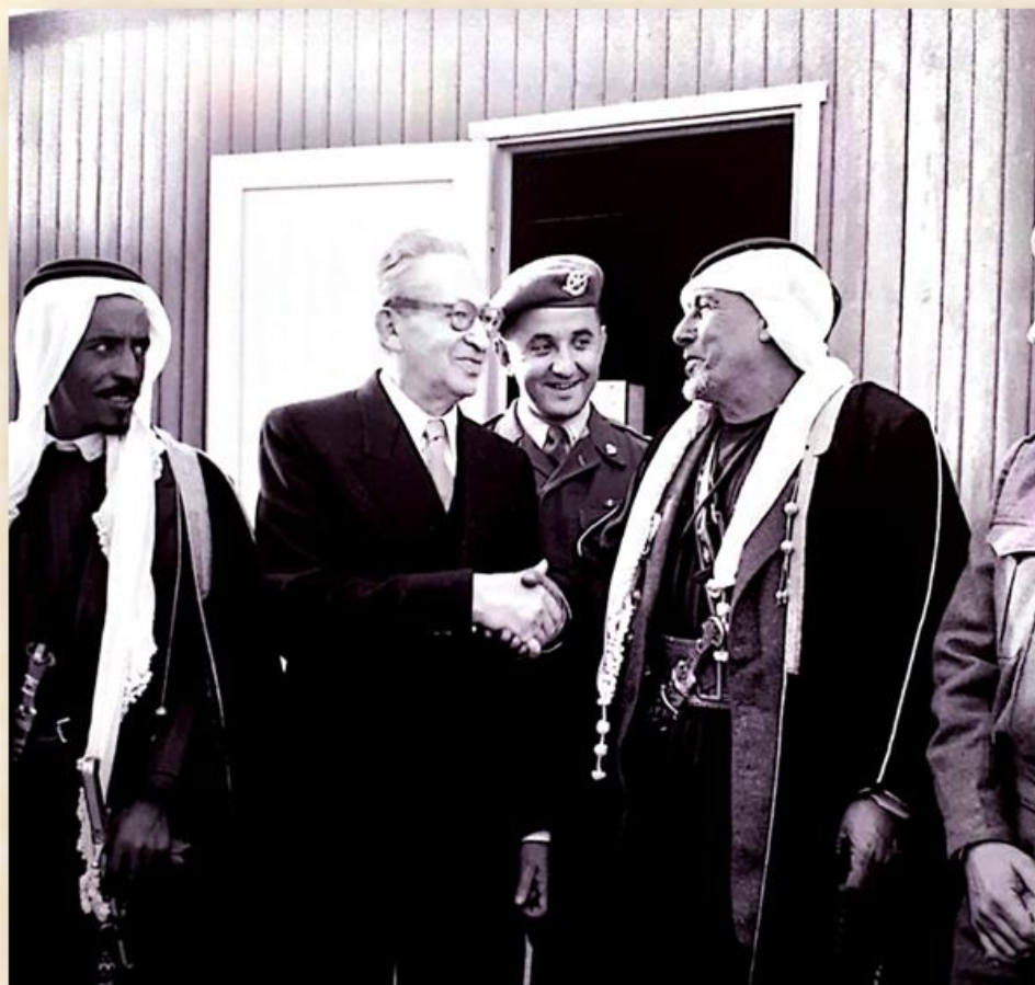
נשיא המדינה השני יצחק בן צבי, שיח סלמאן אל הוזייל, שיח עודה אבו מעמר והמושל הצבאי פנחס עמיר