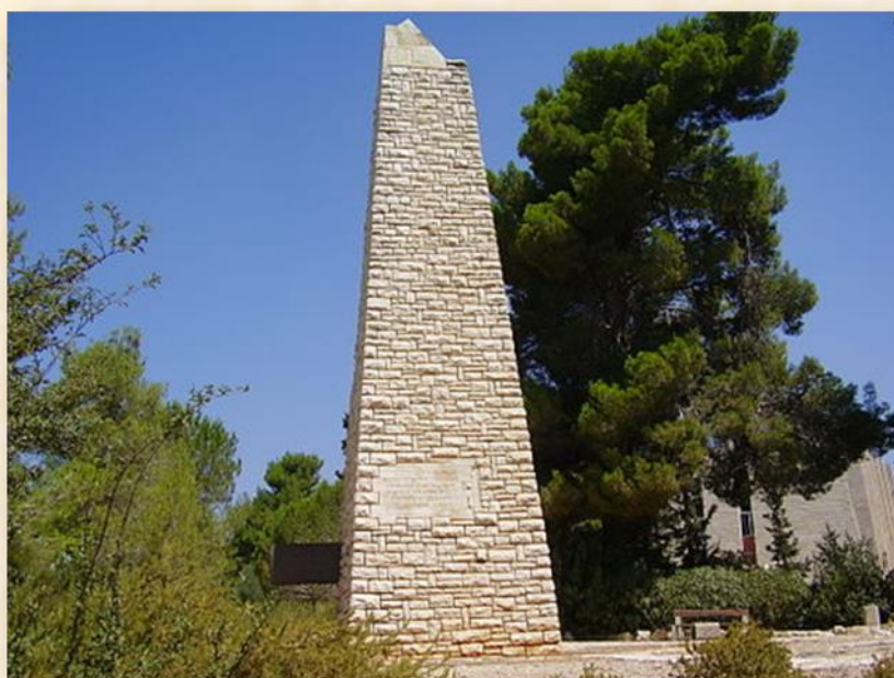
האנדרטה לזכרו בטלזסטון (קרית יערים) : יובל נבו רביבים