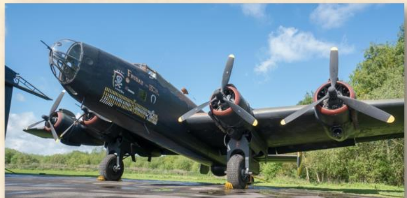
הנדלי פייג' הליפקס, מהמטוסים שנפגעו בפעולת

המלכותי הבריטי, וכוחות האצ"ל תקפו את בסיס חיל האוויר בחצור והשמידו מטוסי האליפקס (אמבר, אייל וכהן, 1997, עמ' 87). התקפה זאת הביאה להגברת אמצעי האבטחה במחנה וכן גרמה למתיחות בקרב החיילים הבריטיים שהתבטאה ביריות מפעם לפעם בשל חשש בלתי מבוסס (את"ה 115/57, מכתב מיום 13.3.1946).