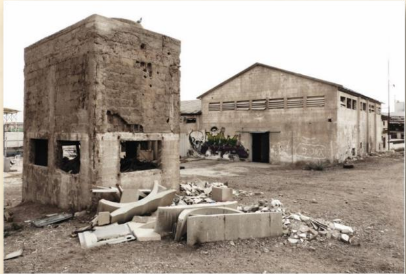
מגדל קירור ביח לקרח אילת - שנות השמונים

בית החרושת לקרח באילת הוקם כחלק מפיתוח שכונת המאפייה