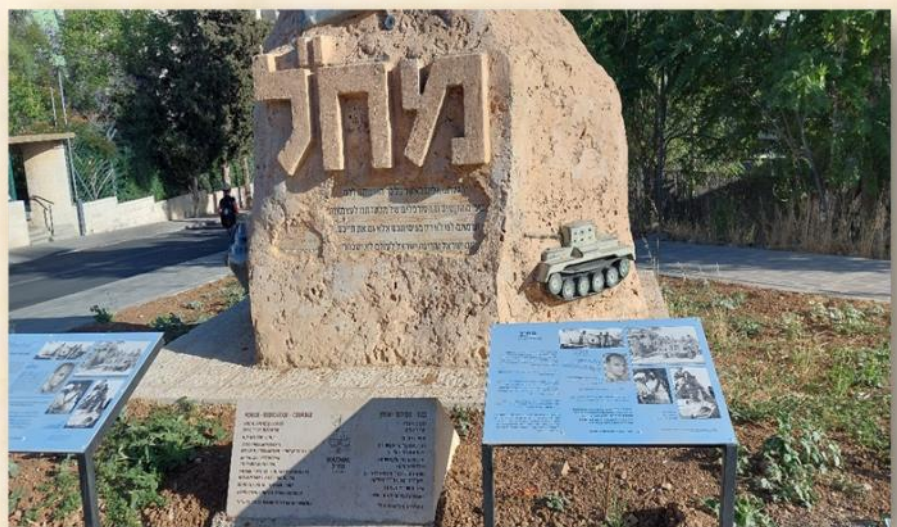
אנדרטת מח"ל בכניסה לגבעת התחמושת