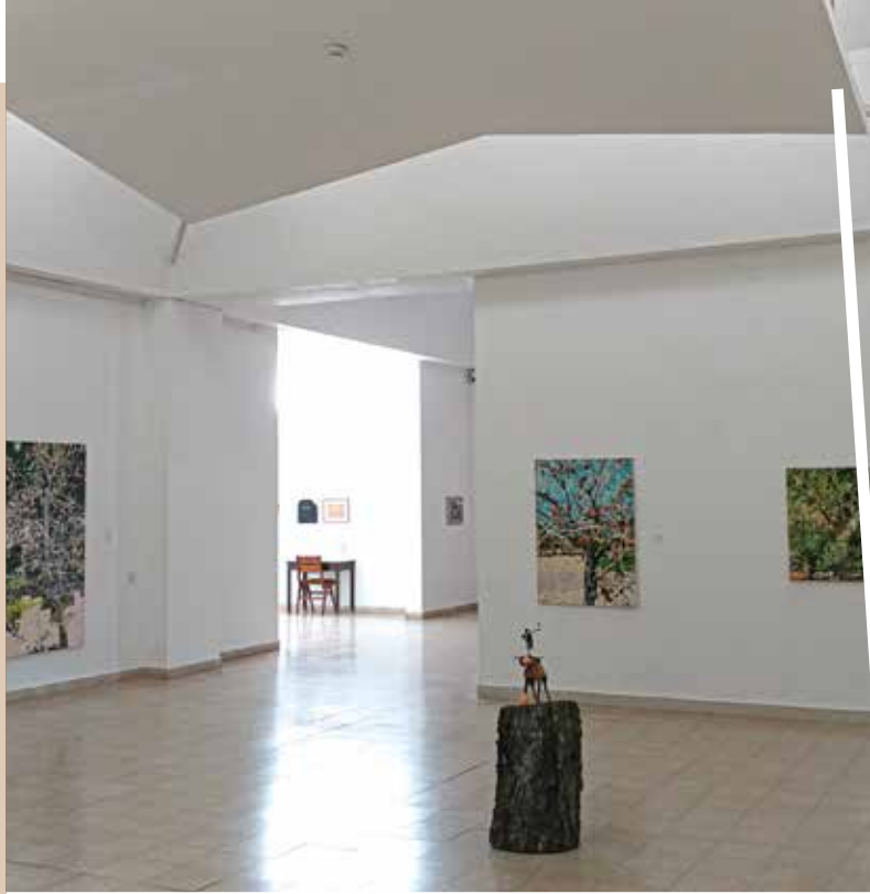
המשכן לאמנות, עין חרוד

הרשמה: https://store.shimur.org/rehovottours