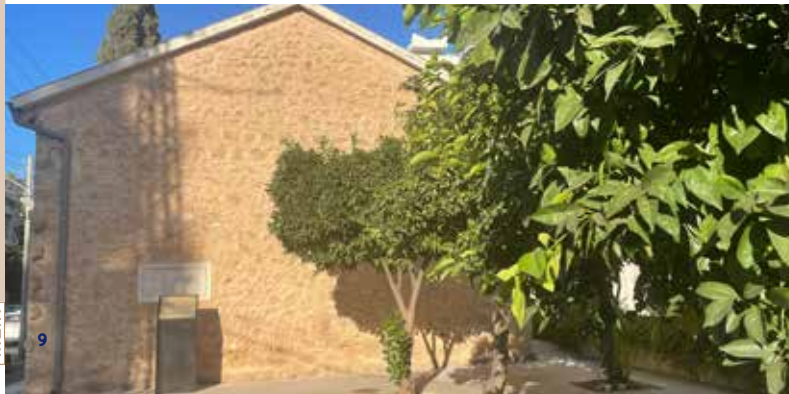
בית האסמים, רחובות