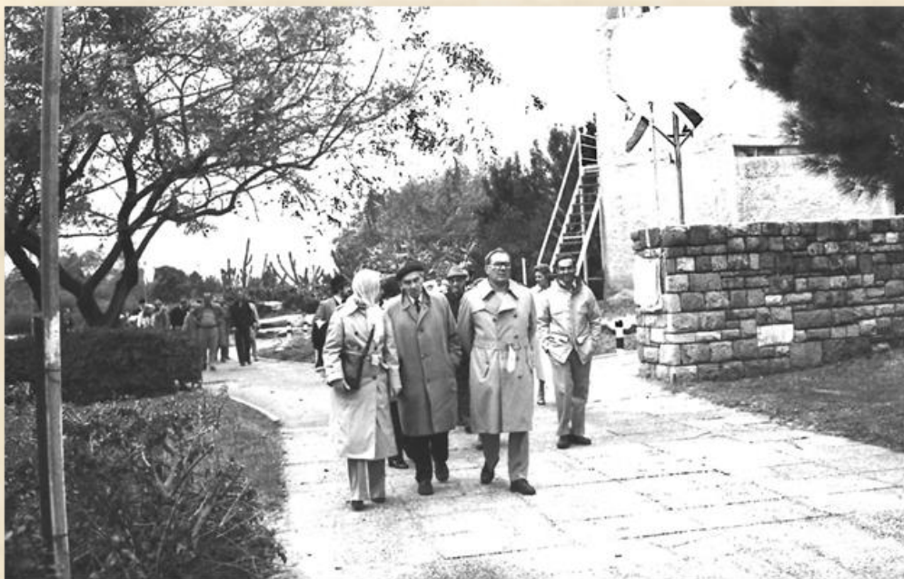
נציגי ארגון ציוני אמריקה על רקע מגדל המים