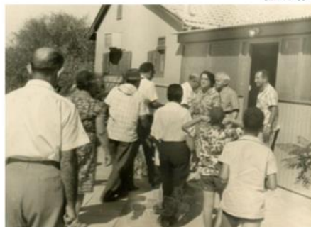
דודו ופולה בן גוריון מקבלים קבוצת תיירים, 1964