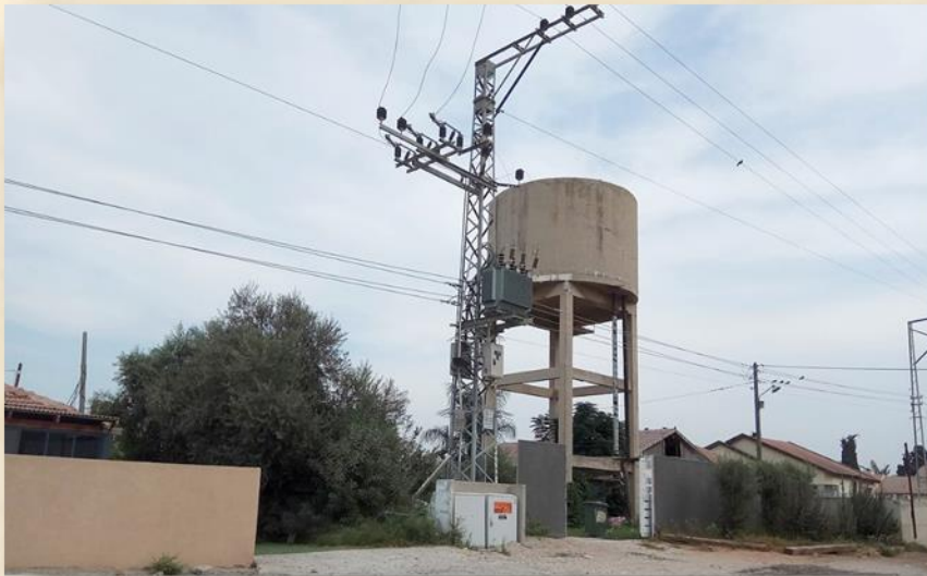
מגדל המים שדה עוזיהו

"וַיַּעַשׂ הַיֵּשֶׁר בְּעֵינָיו ה' כָּל אֲשֶׁר עָשָׂה אֲמַצְיָהוּ אָבִיו. רַק הַבָּמוֹת לֹא סָרוּ עוֹד הָעָם מִזִּבְחִים וּמִקְטָרִים בְּבָמוֹת. וַיִּנָּגַע ה' אֶת הַמֶּלֶךְ וַיְהִי מִצְרַע עַד יוֹם מָתוֹ וַיֵּשֶׁב בְּבֵית הַחֶפְשִׁית וַיּוֹתֵם בֶּן הַמֶּלֶךְ עַל הַבַּיִת שֶׁפֵּט אֶת עַם הָאָרֶץ (מלכים ב', ט"ו – 3-5).