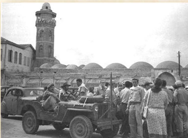
חיילים יהודים בשוק של מגדל 1948