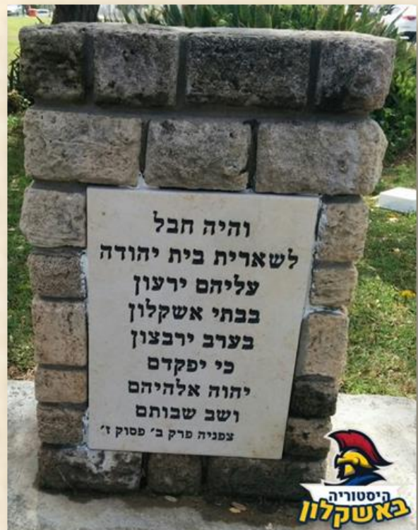
לוח האבן המשוחזר : עיריית אשקלון

היכן ואיך היה הלוח המקורי: לאחר הדברים האלה, קבלתי טלפון מאנשי יד בן צבי בירושלים. הם שמחו על כך שלוח האבן הוחזר, אך אמרו כי עד כמה שהם יודעים, הלוח הראשון עם הפסוק לא היה היכן שנמצאת מסגרת האבן, אלא היה מתחת לכותרת קורינתית אשר הונחה בכיכר (ראו תמונות מצורפות). והלוח לא היה לוח אבן, כי אם לוח ברזל.