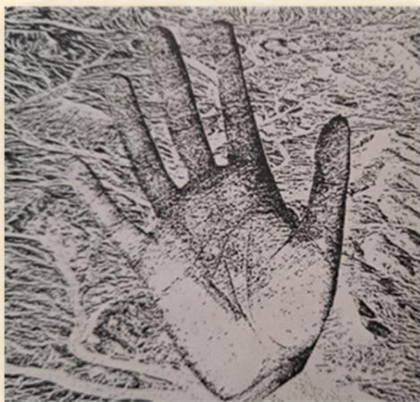
תוואי כף היד עם תבנית נוף בנגב: גיל פלד