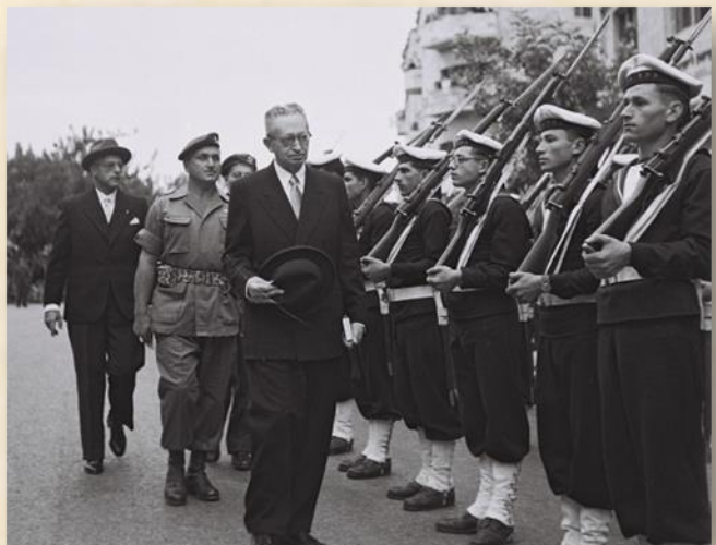
נשיא המדינה יצחק בן-צבי סוקר משמר כבוד לאחר השבעתו לנשיא המדינה 1952

בחבל תענך: תענך 1 תענך 2 תענך 3 וכן הלאה. וכאן בנגב: שובל 1 שובל 2 שובל 3 או עימרה 1 עימרה 2 עימרה 3 וכן הלאה.