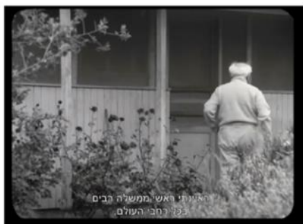
האישה ראש ממשלה רביס בני רחב העולם

צילומים היסטוריים, חזית הצריף הדרומי, ה"מרפסת" כאתר צילומים קבוע של בן גוריון