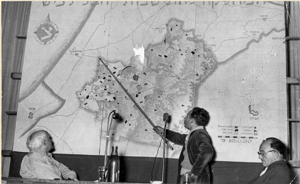
הכרזה על חבל לכיש, לובה אליאב, לוי אשכול, בן גוריון

הכותב הינו מנכ"ל ובעלים ב"סיפור מסע" הפקת טיולים ואירועי שטח