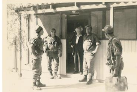
בן גוריון ואנשי המשמר, ללא ציין שנה, משמאל נראה ענף עץ הפלפלון (ארכיון שדה בוקר)

סל קציר • תיעוד מתחם צריף בן גוריון שדה - בוקר • פרק 3 רקע היסטורי ותרבותי