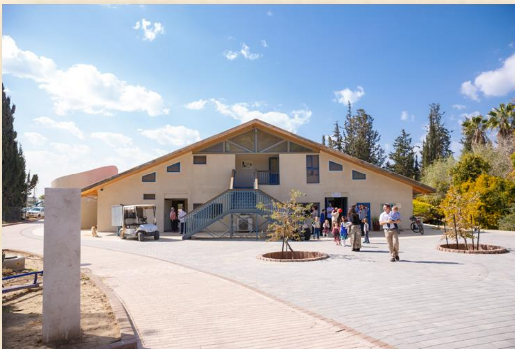
מרכז המבקרים בארות בנגב: ארכיון עלומים