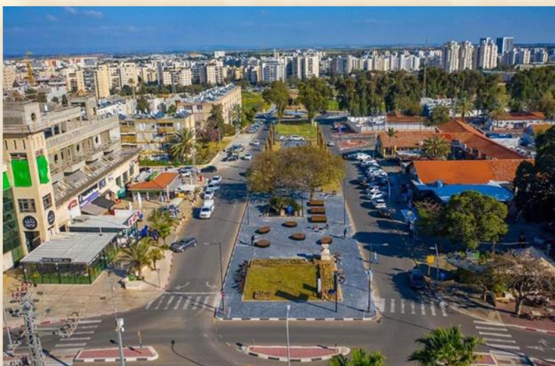
שדרות צפנייה אשקלון: אתר עמית רהוט רחוב וגן

אחלק את הפסוק ואבהיר אותו כך שיהיה קל להבין אותו, (הפרשנות, נשענת על שני פרשנים מודרניים: דעת מקרא של מוסד הרב קוק, ושטיינזלץ, בהוצאת קורן). והיה חבל - הכוונה חבל הארץ הנדונה (בפסוק הקודם, הוא מדבר על חבלי ארץ פלישתים). לשארית בית יהודה - כאמור, לא כל יהודה יצאו לגלות בבל, אלו שנשארו ייגאלו וירשו את ארצות הפלישתים (ובוודאי יתווספו אליהם שבי ציון).