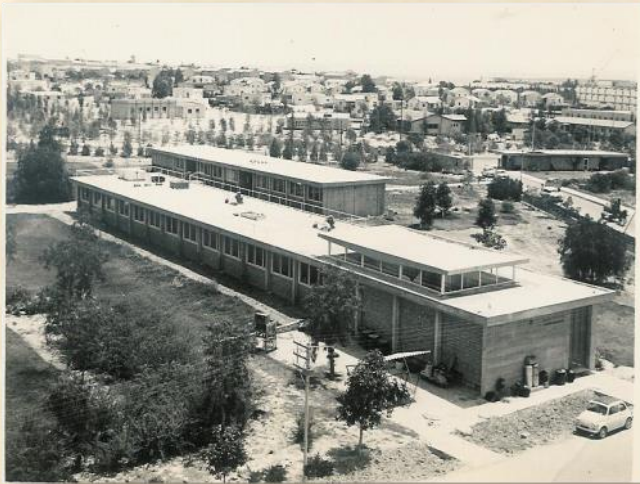
הבניין המקורי במתחם ברגמן 1958: פרופ' יוסף מזרחי

7. מתחם ברגמן באר שבע - על אף כל ההתנגדויות שהגשנו והבקשה לערר למועצה הארצית לתכנון ובנייה, הוועדה המחוזית לא איפשרה לנו להגיש את הערר לתוכנית לוועדה הארצית. מכיוון שלא מחר בבוקר הולכים להרוס את כל המתחם, אנו עדין תקווה שנצליח עם הכוחות החדשים שלנו להציל כמה שיותר מהמורשת הכה ייחודית שטמונה שמקום זה שהביא דה פקטו להפרחת השממה של הנגב. הפערים בין מה שביקשנו לשמור לבין מה שאישרה הוועדה אינם גדולים, ואנו נמשיך לחפש פתרונות כדי להציל את בנק הגנים הגדול בעולם של ה'פיטאיות' ואת צמח החוחובה המקורי האחרון שנותר במתחם.