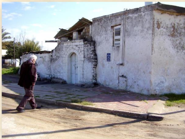
אחד הבתים היחידים ששרדו במג'דל, (בית ערוסי)

רחל לאה שלטה ברוסית, ביידיש ובערבית, וזכרה את חגי ישראל ואת מאכליהם השונים, ועוד זכרה היטב