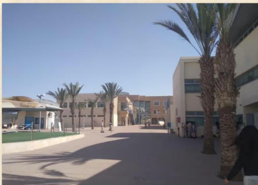
בית הספר הטכני של חיל האוויר