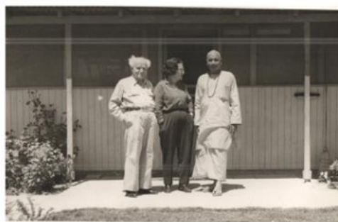
פולה דודו-בן גוריון בפתח ביתם, ללא ציין שנה, כנראה שנות השישים המאוחרות (ארכיון שדה בוקר)

בן גוריון נכנס לצריף. שימי גורדים בצמוד לצריף הדרומי, ללא ציין שנה (קטע מסרט)