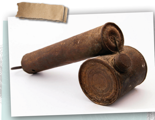
ניר קירר, בארבעות מוזאון ראשון לציון

מטבע לשון: "צריך לרסס אותו בפליט" - צריך לגמור אתו חשבון, להתנקם בו, לחסל אותו.