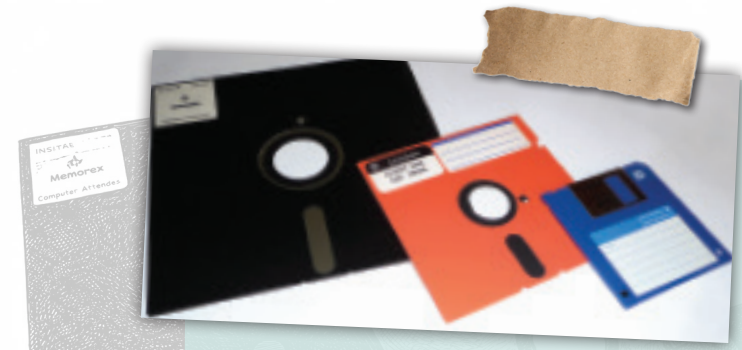
ויקטוריה ויקטוריה George Chernilevsky

שנות ה-80 וה-90, לפני שהמציאו את הדיסק און קי ואת השמירה בענן שמרו קבצים בדיסקט, ששמו העברי "תקליטון". נפח אחסונו היה קטן מנפח של תמונה שמצלמים כיום בטלפון נייד. הדיסקט היה ריבוע מפלסטיק קשיח ובתוכו עיגול מפלסטיק גמיש שעליו נשמר המידע. הדיסקטים היו קלים ואפשרו להעביר קבצים ממחשב למחשב, אך הם היו רגישים לשינויים במזג האוויר ומגנטים היו מבלבלים ומקלקלים אותם. כאשר הופיעו התקליטורים (CD) הראשונים למחשב, נעלמו הדיסקטים מהנוף.