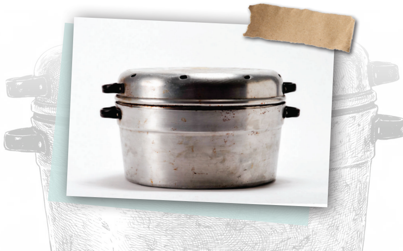
ד"ר יריב

פאר היצירה של מפעל פלאום היה סיר הפלא – סיר שמשמש לאפייה על כיריים הודות למבנה המיוחד שלו. בימים שבהם תנור אפייה היה מצרך נדיר, הצליחו אנשים לעשות נפלאות בהכנת עוגות בעזרת סיר הפלא! את הסיר, שהיה בעל חור עם ארובה במרכז, היו מניחים על הלהבה של הגז או על פתילייה. החום התפשט בכל דרך הארובה ואפה את העוגה, וריח מדהים התפשט בכל הבית. מפעל פלאום לייצור כלי בית ומטבח מאלומיניום ומאמייל הוקם בשנת 1933 בעיר גנים, כיום העיר רמת גן, סמוך למפעל "עלית". שם המפעל מורכב מהמילים פל (פלשתינה) אלום (אלומיניום). בתקופת המנדט הבריטי ואחריה כולם השתמשו בסירים תוצרת פלאום.