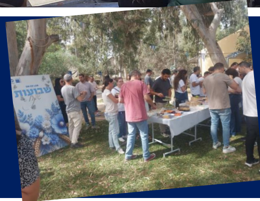
מפגש עובדי חברת HP INDIGO

סיור לתלמידי כיתה ד' מבי"ס אלון מעלה החמישה בהדרכתה של מירי הרשקו.